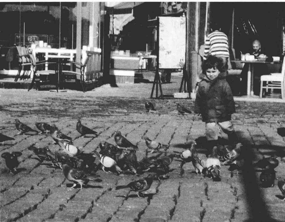
土耳其伊斯坦布尔 | 塔克西姆广场