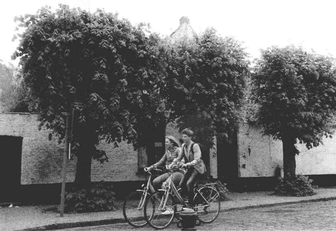
比利时 | 布鲁日