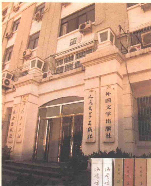
人民文学出版社大楼