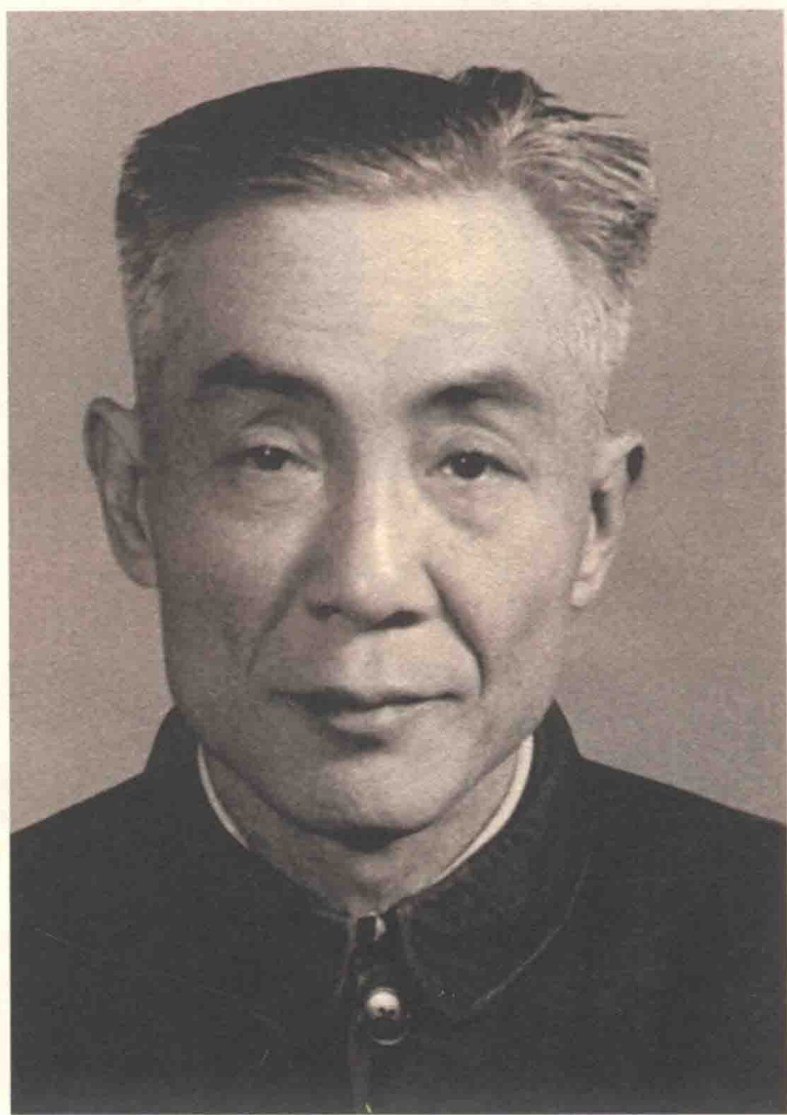
冯雪峰摄于 1973 年