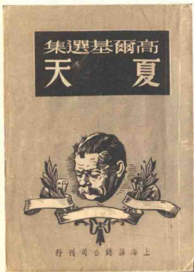
高尔基的小说《夏天》1946年改译本