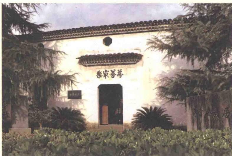
浙江义乌冯雪峰故居