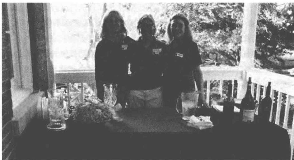
图 1.2 志愿者是博物馆在特殊事务方面的重要外援(圣奥古斯丁灯塔与海事博物馆)

体现社区发展多样性的展览、项目和拓展活动。这个趋势已经蔓延至各种博物馆,大家都开始根据社区特色,发掘和开展各类文化多样性的活动。例如,奥克兰的佩拉尔塔庄园历史公园就提供吸引当地社区人群的各种游览和参观项目。同时,社区也为能支持和参与博物馆举办的诸如种族问题、历史战争问题的讨论以及各类文化庆典而感到自豪。而像史密森学会这样的组织已经花费了几十年时间收集相应的藏品,以展现美国社会日益丰富的多样性。由于相关藏品的数量越来越多,它还为此单独建立了一座体现文化多样性在国家历史中的重要性的博物馆。其他博物馆也经常举办关于历史人物和改变历史进程的重要事件的纪念活动,以及反映国家和当地社区多样性的活动。尽管博物馆已经开展了众多关于社会和文化多样性的讨论,在未来,博物馆和美术馆仍将继续丰富各类反映文化多样性的藏品,培养更为多样化的博物馆工作人员、志愿者和社区。