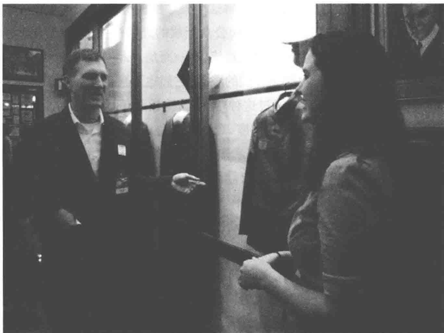
图 1.1 志愿者讲解员是博物馆的支柱

进入20世纪,博物馆注意到志愿者的重要性和活跃度,开始设立志愿者协调官这样的职位,并成立相应部门以进行志愿者管理。美国博物馆志愿者协会于2011年颁布了相关的博物馆志愿者项目的标准和最佳实践指导,指出志愿者协调官这一岗位非常重要,博物馆