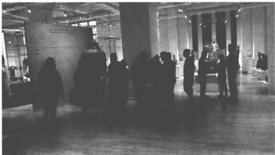
带领观众参观是传统的志愿者工作之一