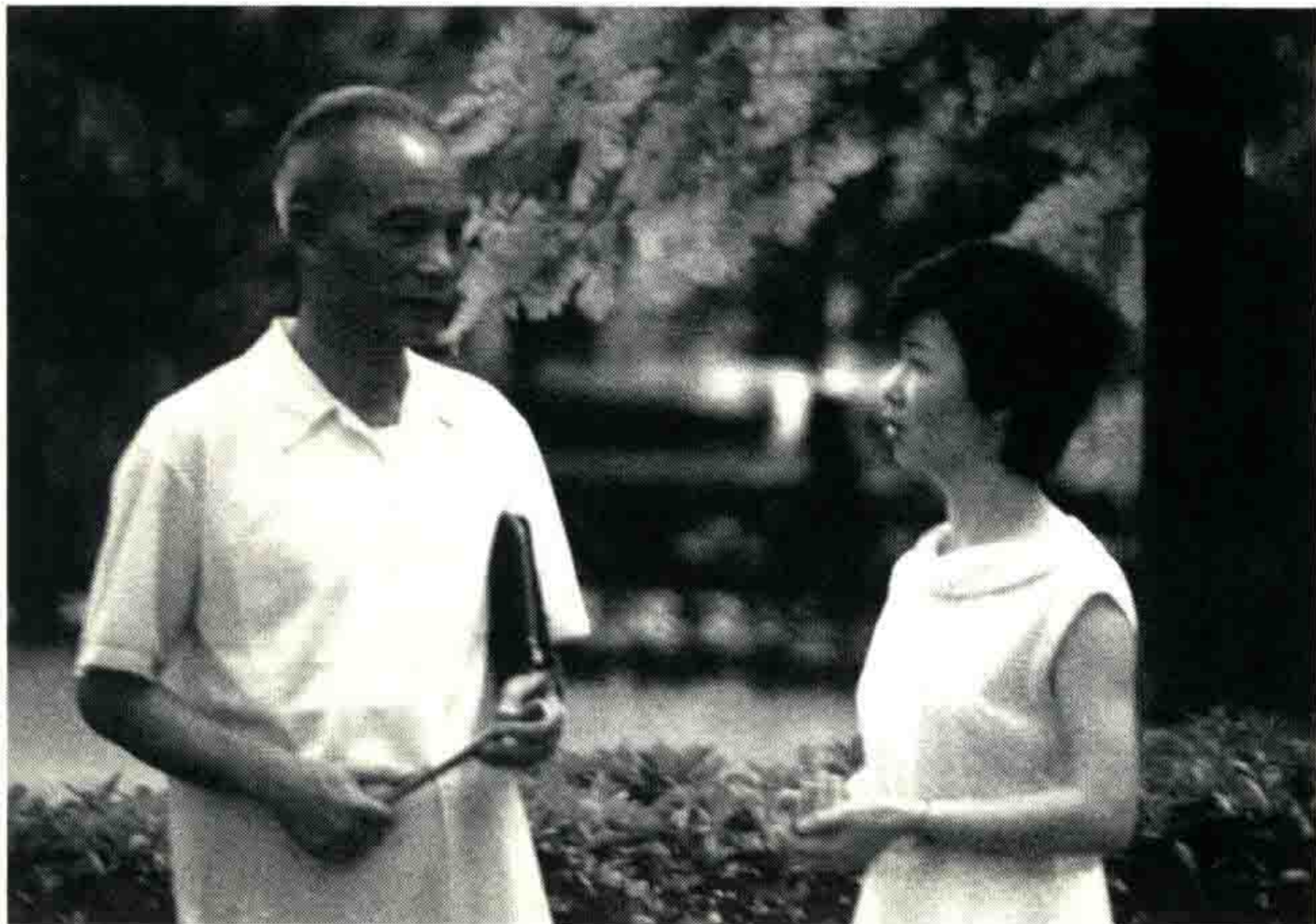
本文作者（右）与钟老在广西师范大学王城校区

为弘扬一代中国教育家的献身精神，倡导全社会尊师重教，推动中国教育面向世界面向未来面向四个现代化发展，20世纪90年代初，国家八五规划项目以大手笔创意，绘制了八卷本中国当代精英人物传记丛书，其中专辟一卷为中国师范教育界英雄模范树碑立传。作为广西师范大学第一届硕士研究生，1982年春天，我从北国冰城哈尔滨来到山水甲天下的桂林，走进绿树成荫秀美