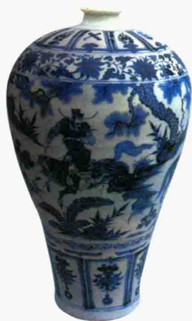
元代 青花“萧何月下追韩信”梅瓶 高 44.1 厘米 南京市博物馆藏