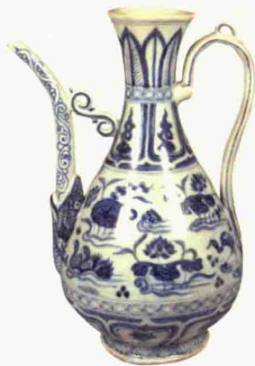
元代 青花莲池鸳鸯纹执壶 高 28.3 厘米 观复博物馆藏

上图这件宝物是元青花莲池鸳鸯纹执壶，这个执壶的造型受金元时期玉壶春瓶造型的影响，加了柄和流（即壶嘴）。这个壶当时应该是游牧民族用来喝酒的，这样一壶酒温起来很方便，倒出来可以畅饮。这个元青花的执壶说明了双向的问题，一是游牧文化向农耕文化靠拢，二是农耕文化向游牧文化学习。元青花是我们中原的优秀文化跟外来的优秀文化碰撞结合的一个实例。我们民族对待文化的态度坚韧而宽容，西方的文化进来的时候，我们能迅速地消化成为自己的文化，这就是我们民族文化强大的一个原因。