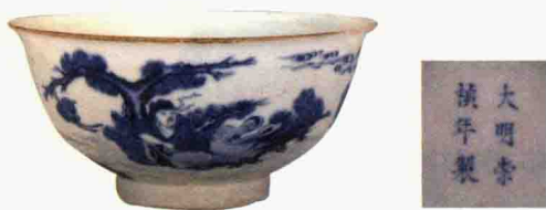
明崇禎 青花仙人乘槎碗

这是一个看似很普通的碗，碗里有严重的粘沙现象。本身青花碗没有什么特殊的，唯一特殊的是它底下的六个字——“大明崇禎年制”。明代带有年款的官窑，较多的是永、宣、成、弘、正、嘉、隆、万，其他时期能见到年款的就非常少，尤其是崇禎。在全世界已知的资料里能查到的署“大明崇禎年制”款的是非常少的，我印象中就几十件而已。这个碗虽然品相很不好，有严重的使用痕迹，里面有粘砂，所以它磨过，留下了岁月的痕迹，但它是明朝后期的一个标准器，画的题材是“仙人乘槎”。它在画风上也有了康熙的特征，所以这是那个时期的一个标准器，很重要的一个文物。