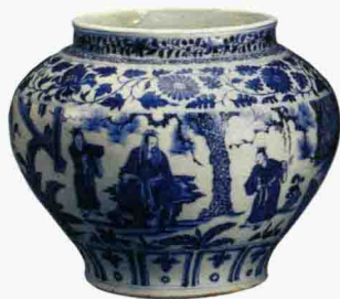
元代 青花“三顾茅庐”罐 高 26.6 厘米 香港苏富比