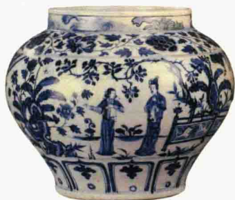
元代 青花“锦香亭”罐 高 27.3 厘米 原藏英国大维德基金会