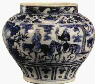
元代 青花“昭君出塞”罐 高 28.4 厘米 日本出光美术馆藏