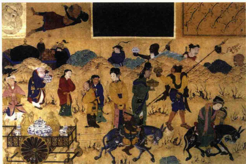
15 世纪 细密画 中国瓷器输往西亚场景

没有分散过。首推的就是土耳其的托布卡帕皇宫，它的第一个记载，也就是记载有这批东西的时间是 1453 年，距今已经 550 多年了。第二个收藏比较多的是伊朗的阿克比尔寺，集中了 32 件，而且没有被拆散过。这不是一个偶然。伊朗和土耳其在地理位置上都属于西亚、中东，为什么能侥幸存下来这样批量的元青花呢？可见当时的需求以及我们和西亚之间的贸易往来和文化交流比较多。第三个收藏元青花比较多的地方是中国江西高安，在高安的地库里一共有 19 件，20 世纪 80 年代的时候一次性出土。那么为什么高安有呢？因为高安离元青花的产地景德镇非常近。