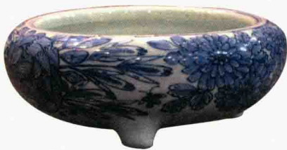
明万历 “铁线描” 青花三足炉

这是一件明代的青花器。青花的呈色剂是要花钱买的，不是白来的，从元青花时代到永宣青花时代，所用的青料由苏麻离青发展到平等青，再到回回青，在使用青料时都会有大量的平涂。但是到了明代后期，由于青料缺乏，画面上又想让人感觉画得比较满，就用了一种特殊的绘画方式，叫“铁线描”。这件上面没有一笔平涂，就是不把颜色涂上去，因为那样费材料，而是用无数道线来反映东西的颜色，比如这个叶子，看上去也是蓝的，但是仔细看会发现是用线构成的，并不是用平涂构成的。这是明代晚期青料匮乏所致，后来又演变成一种风格，这个风格在清雍正时期又有所追摹。这件东西非常不错，是明代万历年间的青花。