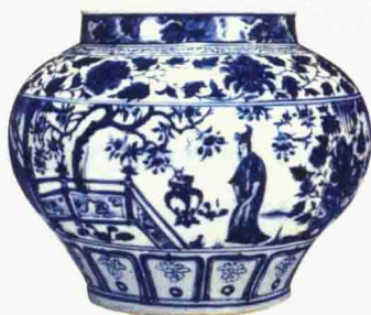
元代 青花“西厢记”罐 高 28 厘米 香港苏富比