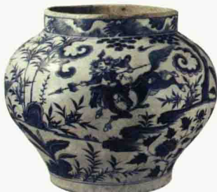
元代 青花“尉迟恭救主”罐 高 27.8 厘米 美国波士顿美术馆藏