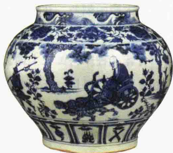
元代 青花“鬼谷子下山”罐 腹径33厘米 伦敦佳士得

我们过去对元青花的了解非常少。几十年前，大部分人不知道有元青花这个事物，明清两朝的人一直固执地认为青花是明代初年创烧的，而不是元代创烧的。这种认识一直影响到我开始喜欢瓷器的时候，当时还有很多人坚持这个观念。