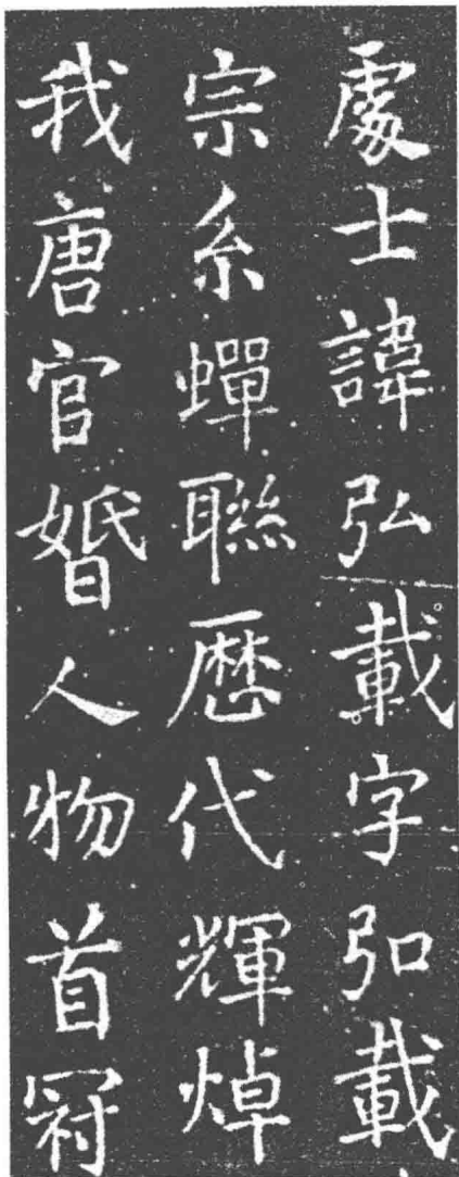
图 127 墓志局部