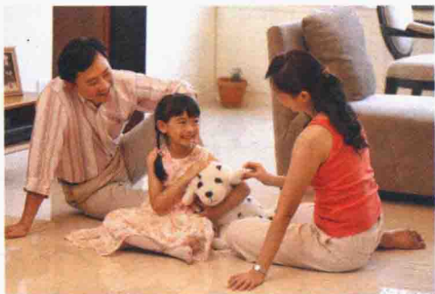
图1-2 融洽温馨的家庭氛围有利于孩子成长

家庭成员的关系影响着家庭的氛围，而家庭关系中占主导地位的夫妻关系则决定着家庭的氛围，从而形成一种独特的心理环境，深深地影响着孩子。