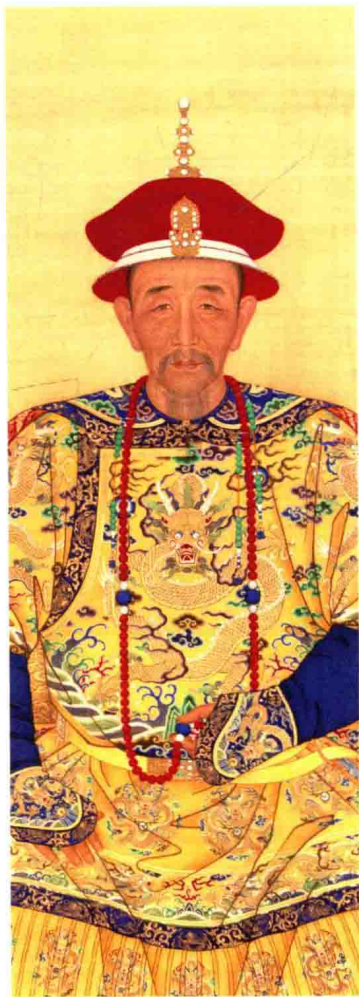
清人绘 康熙皇帝朝服像轴（局部） 绢本设色 纵274.7厘米 横125.6厘米 故宫博物院藏

清朝宫廷中的人物肖像画，大都与皇室有关。如果再加以细致区别的话，还可以有皇帝、皇子公主、后妃、文武功臣、太监内官等几类。其中以皇帝的肖像画数量最多。这些作品中的人物肖像，大多具有个性特征，应当都是对着真人写生而成的，有着很高的文献价值。