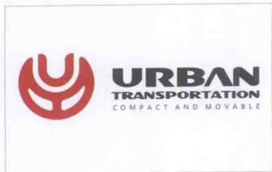
Urban Transportation (电动摩托车)