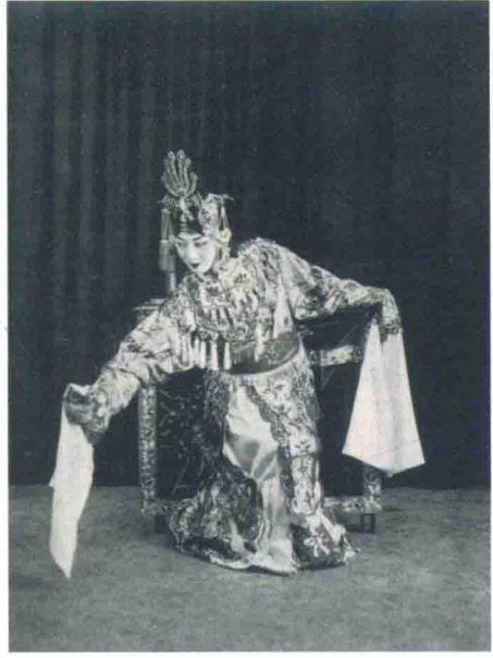
访美演出《贵妃醉酒》