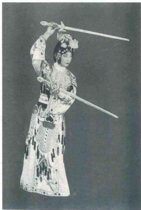
访美演出《霸王别姬》