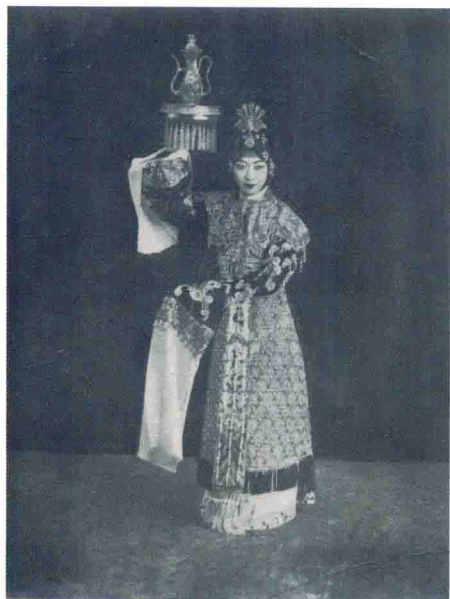
访美演出《麻姑献寿》