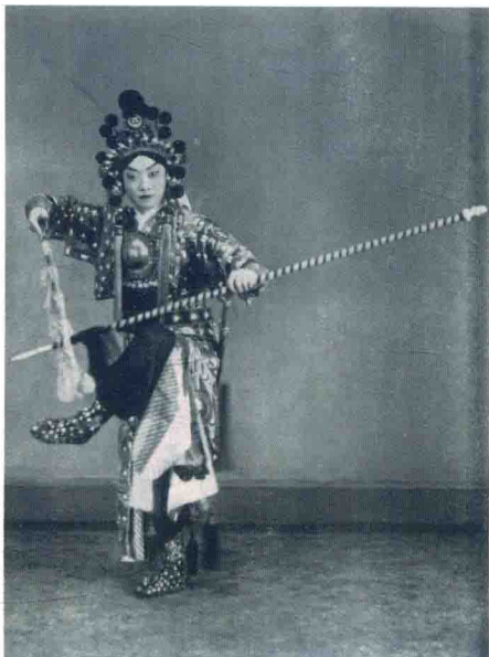
访美演出《木兰从军》