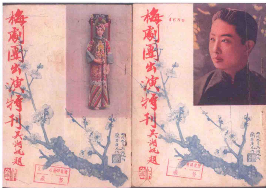
1946年，中国大戏院梅剧团出演特刊封面