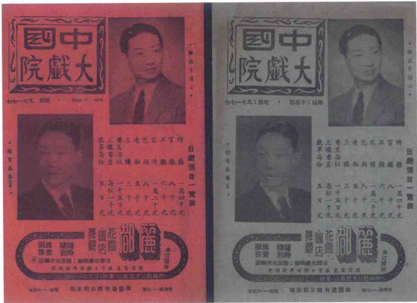
1946年上海中国大戏院戏单封面