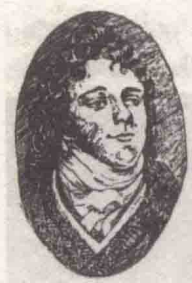
① 18 世纪的名绅柴斯特菲尔德，古典社交的奠基人

现今，随着我国服务型政府的建立，代表政府的公务员形象越来越受到国际社会的关注。掌握和学习这一国际化、科学化和与时俱进的着装规则应成为国家公务员的必修功课。