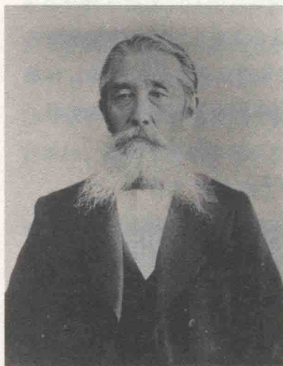
① 板垣退助，日本第一个政党自由党的创立者、改革家、民权家、伯爵，称为日本的卢梭

表面上看来，日本的TPO计划是从时间（T）、地点（P）、场合（O）三个方面对欧洲的着装规则（THE DRESS CODE）的明确化、系统化研究与实践，而实际上却通过非常便于操作的TPO计划树立了国民信心，提升了国民素质。自此日本成为亚洲最发达的国家，而作为关键的指标之一，就是基于“THE DRESS CODE”的TPO计划的成功实践。