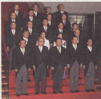
②日本首相换届，首相和内阁成员必须穿晨礼服拍张全家福，这个传统已经保持了一个多世纪，今天仍在继续着