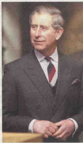
②查尔斯王子一身很英国化的黑色套装