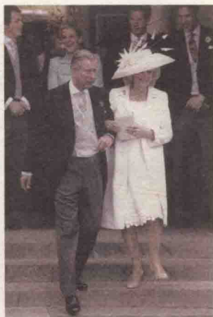
④ 21 世纪的名绅查尔斯王子，古典社交的守望者