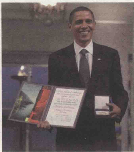
③美国总统奥巴马的西服套装准确无误，但与黑色套装传递的信息绝不相同