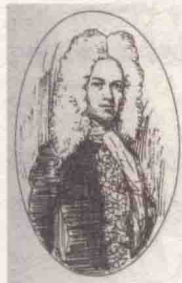
② 19 世纪的名绅布鲁梅尔，古典社交规制的倡导者和推动者