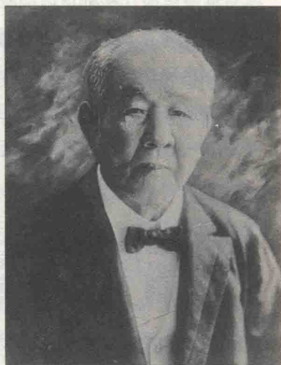
③ 渋沢荣一，明治维新时期影响日本现代工业的重要实业家