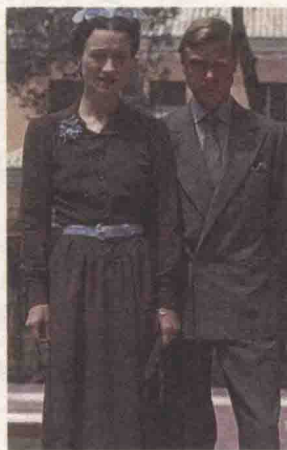
③ 20 世纪的名绅温莎公爵，时尚社交的倡导者