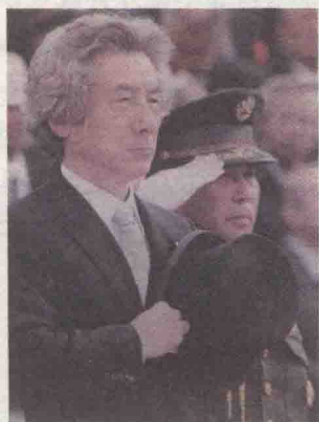
①日本首相小泉纯一郎的大礼帽和银灰色领带暗示他穿的一定是晨礼服，并提示他在参加最高级别的仪式

贵族以“礼”作为自身素质的修养，见面有多种见面礼，如鞠躬礼、点头礼、接吻礼等；用餐也有多种礼仪，刀叉使用方式和摆放方式都有明确的规定等，这一切都有相应的服装形制（语言）提示我们。例如礼服按时间分为日间礼服和晚礼服，又按礼仪级别而划分为第一礼服、正式礼服及准礼服。每一种礼服有着自己的固定搭配元素，不可混淆，否则形象会出现问题。我们经常会在英国的赛马会、帆船比赛场合看到女士穿着两件套箱式套装或礼服连衣裙，并戴手套和帽子，男士则必穿表示白天的第一礼服晨礼服和戴礼帽，或它的简装版董事套装。只有这样才能证明他的社交归属。重要的是，是否保持了源于贵族礼仪着装传统每个细节的准确性，这是判断绅士的重要标志，它的纯正性可以成为判定社会地位高低的标签（图 1-2）。