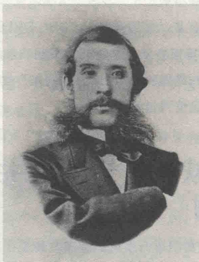
② 大久保利通，明治维新三杰之一，主张西方的实业经济强国和内政改革