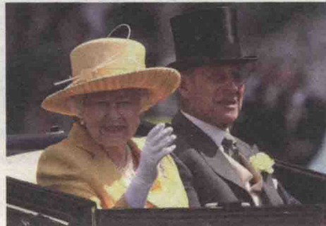
③和④英国每年一度的赛马会，无论王室还是贵族男人必须穿晨礼服