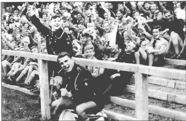
▲正在呐喊助威的希特勒青年团员们。

席腊赫所能提供的，远比军事训练和令人困倦的政治课多得多。席腊赫深知这些年轻人的真正需求，引导青年们积极参加活动，为男女少年儿童提供此前只有有钱人家的孩子才能享受的业余活动项目：穿越整个德国的旅行，徒步漫游，骑自行车旅游以及帐篷营地。孩子们在合唱队里一起唱歌，学习演奏乐器，在乐队的伴奏下行进。有表演天才的则参加话剧表演队。希特勒青年团的“成就教育”设立各种各样的奖章、奖金，鼓励那些在“帝国音乐节”“帝国戏剧节”以及体育方面或者“帝国职业竞赛”中证明了自己才艺的孩子们。年纪大一些的，14岁时就从少年队转入希特勒青年团。他们特别喜欢希特勒青年团的特殊支部。在希特勒青年团的飞机驾驶和航海队里，男孩子们熟悉了德国国防军各个兵种的要求，为将来在军队和武装党卫军中服役作准备。