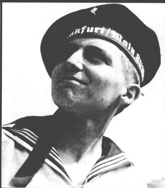
▲ 希特勒青年团拥有各种特殊支部，当然这些都是为了让德国青年能够更好地在军队中服役而设置的。照片中的就是希特勒青年团海军支部的成员，他们将在入伍前就接受海军技能的培训。