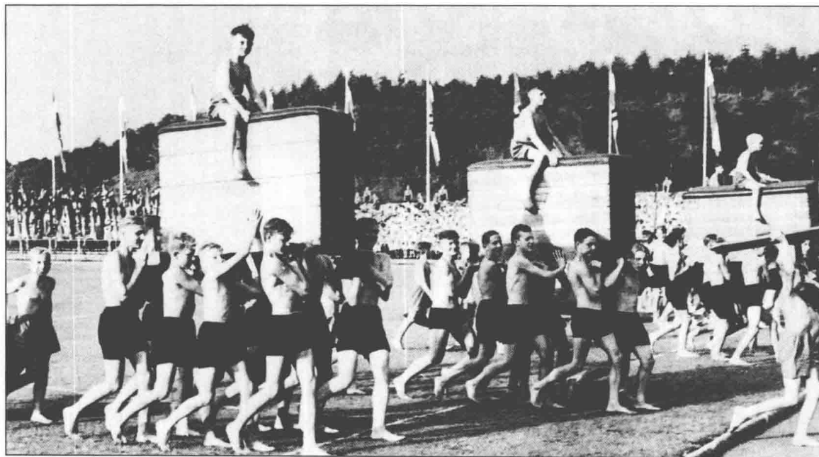
▲德国少年队，希特勒青年团的儿童组织。照片中的少年队员们正在进行一场比赛，希特勒青年团经常组织各种各样的体育竞技，来提升青少年的身体素质以及技能。

早在1936年，希特勒就宣称：“一个新的美的类型产生了。不再是肥胖的啤酒肚小市民，身材苗条而修长的青年是我们这个时代的象征，他（们）叉开双腿神气十足地站在这个地球上，身体健康，思想健康。”1937年，纳粹设立了“希特勒青年团全国体育竞赛”，它的宗旨是充分展示德国的“力量与不可战胜”。