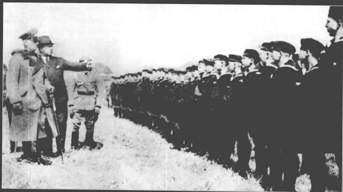
▲ 二战大战前，冯·伦德施泰特将军在德国北部检阅一群希特勒青年团海军支部的孩子们。