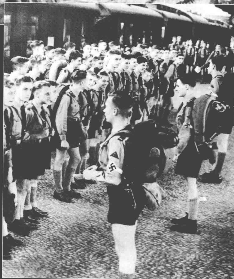
◀ 1939 年，正在弗雷岑整队准备上车的希特勒青年团团员，他们将乘火车前往勃兰登堡帮助收割庄稼。整个二次大战期间，由于德国国内劳动力缺乏，希特勒青年团在这方面扮演了重要的角色。