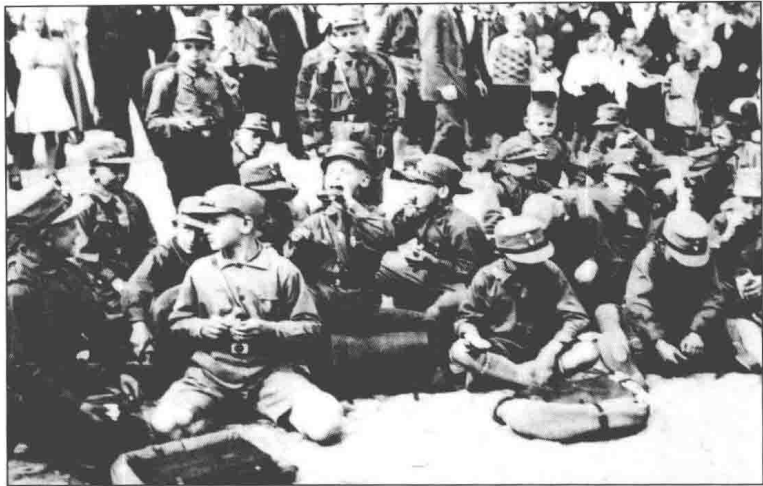
▲“德意志民族的未来”，一次集会途中的德国少年们。