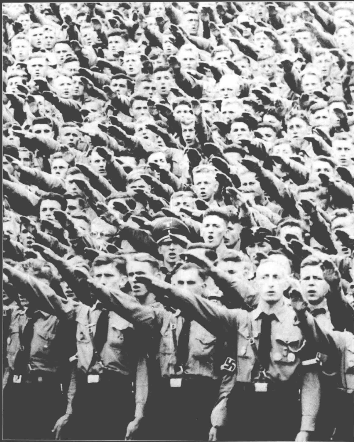
▲ 高呼“嗨，希特勒！”的希特勒青年团团员们。