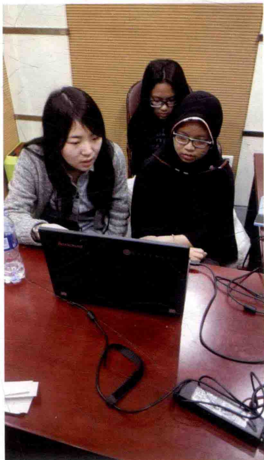
印尼爪哇语基本词汇录音照片