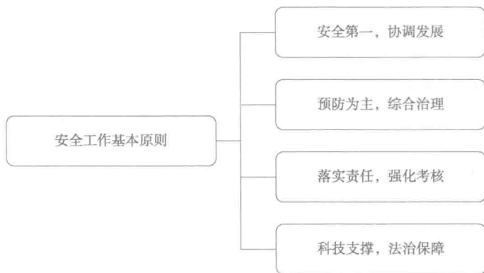
图1-1 安全工作基本原则

《国务院关于加强道路交通安全工作的意见》(国发[2012]30号)提出了道路交通安全工作的四大基本原则(图1-1)。