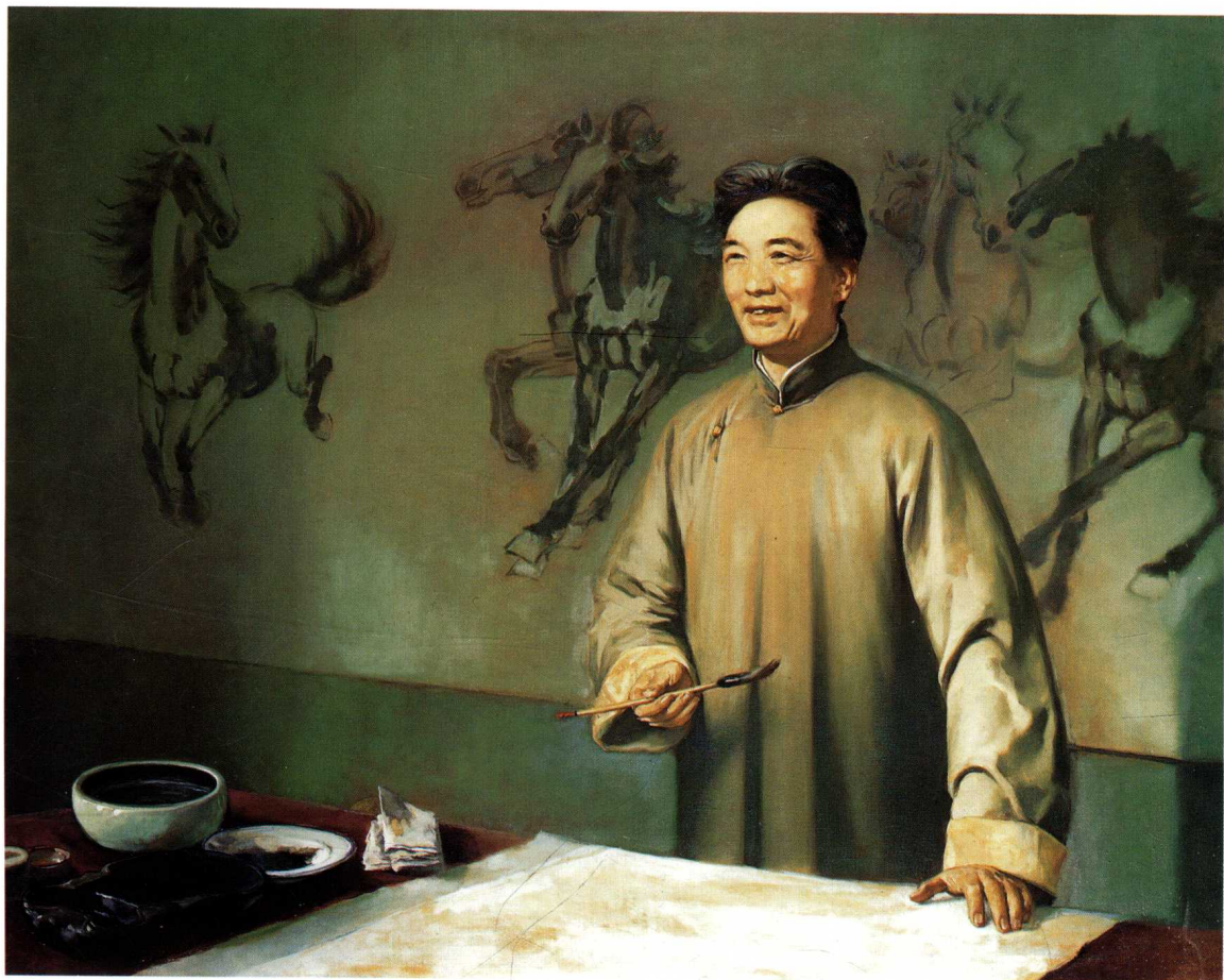
画家徐悲鸿（油画） 120cm × 150cm 1978年 /戴 泽