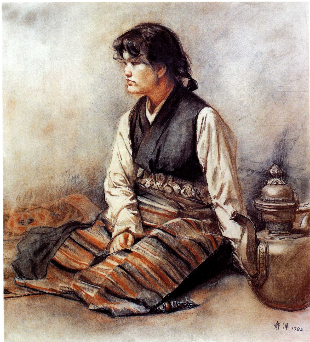
铜壶藏女（素描） 73cm×60cm 1982年 /戴 泽