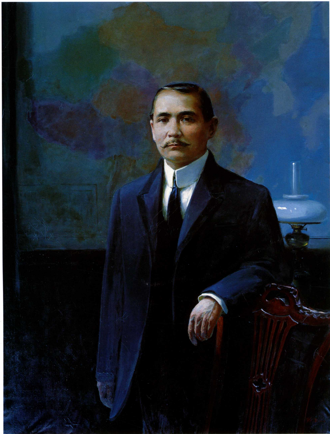
孙中山（油画） 120cm × 150cm 1982年 /戴 泽