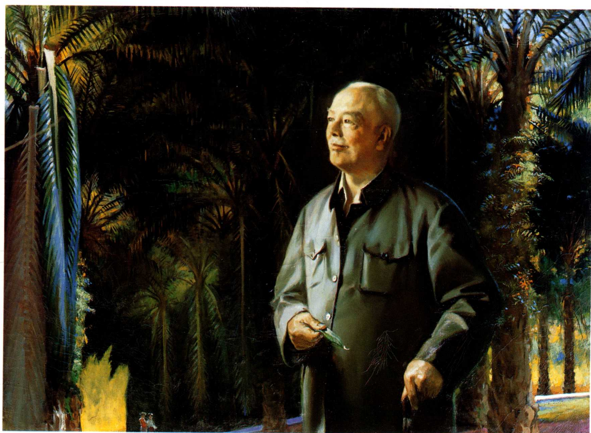
植物学家蔡希陶（油画） 120cm × 150cm 1981年 /戴 泽