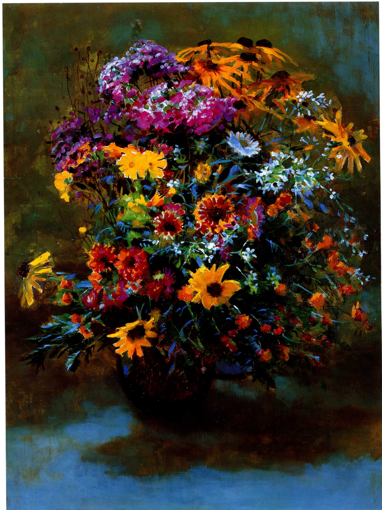
繁花 (油画) / 戴 泽