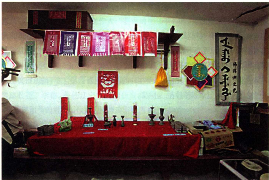
吉林九台瓜尔佳(罗关)家族堂子西墙上的祖宗匣子

人类在漫长的岁月中,不论取用什么用具,不管表示得如何粗犷简约,能够最先懂得并创造记录自身群体生存轨迹和历史的人们,永远是功不可没的伟大智者。