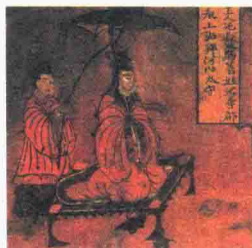
北魏 漆画屏风 《烈女古贤图》(局部)