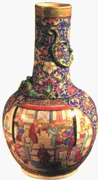
清晚期 粉彩开光人物纹瓶

从造型上讲，这种直颈、底下呈球状的都叫“天球瓶”。这件天球瓶颜色非常鲜艳。天球瓶是明代初年才出现的造型，后来非常受社会欢迎，宫廷、民间都喜欢。在清代康乾盛世，尤其是乾隆时期，天球瓶做得比较多。到了清代晚期，摹古之风兴起，也模仿做了一些这种造型的瓶子。这时候的天球瓶跟明代的完全不一样，明代的天球瓶都比较敦实，比较扁；清代的相对来说都比较鼓，比较挺拔。