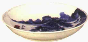
清康熙 青花携琴访友图盘 口径 28.6 厘米 观复博物馆藏