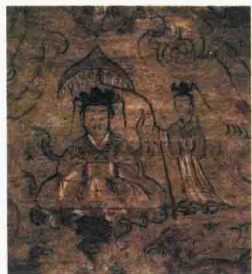
东晋十六国 墓室壁画《月和西王母》(局部)

中国人发明伞的历史至少可以追溯到春秋时期，再早就找不到文字记载了。伞最初出现的时候并不是为了避雨，而是为了确认主人的位置。我们看到皇帝出行的时候都有宝伞跟随，这样人的地位就很清楚。今天我们要找到明代以前的伞都非常困难，我们看到的往往都是西化的伞。