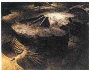
战国 江陵望山漆木车伞