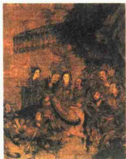
宋代 地官画轴 (局部)