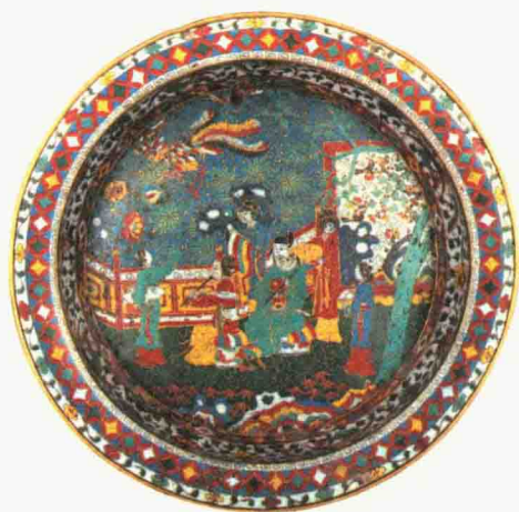
明晚期 铜胎掐丝珐琅吹箫引凤折沿盆 口径 39.4 厘米 观复博物馆藏