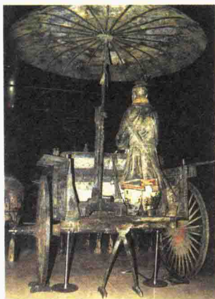
秦始皇陵一号铜马车伞