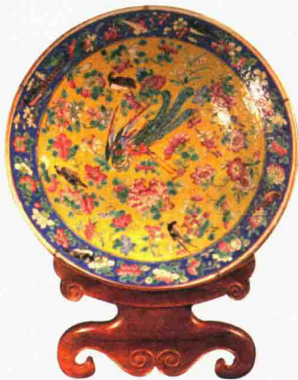
清同治 粉彩百鸟朝凤纹盘

这个盘子很有意思。这种浅浅向上的造型，是清代同治、光绪年间的典型特征。这上面的彩非常热闹，图案是百鸟朝凤，尽管中间画了一只凤凰，但这凤凰显得很没劲儿，一副软弱的样子，并且其他的鸟不是