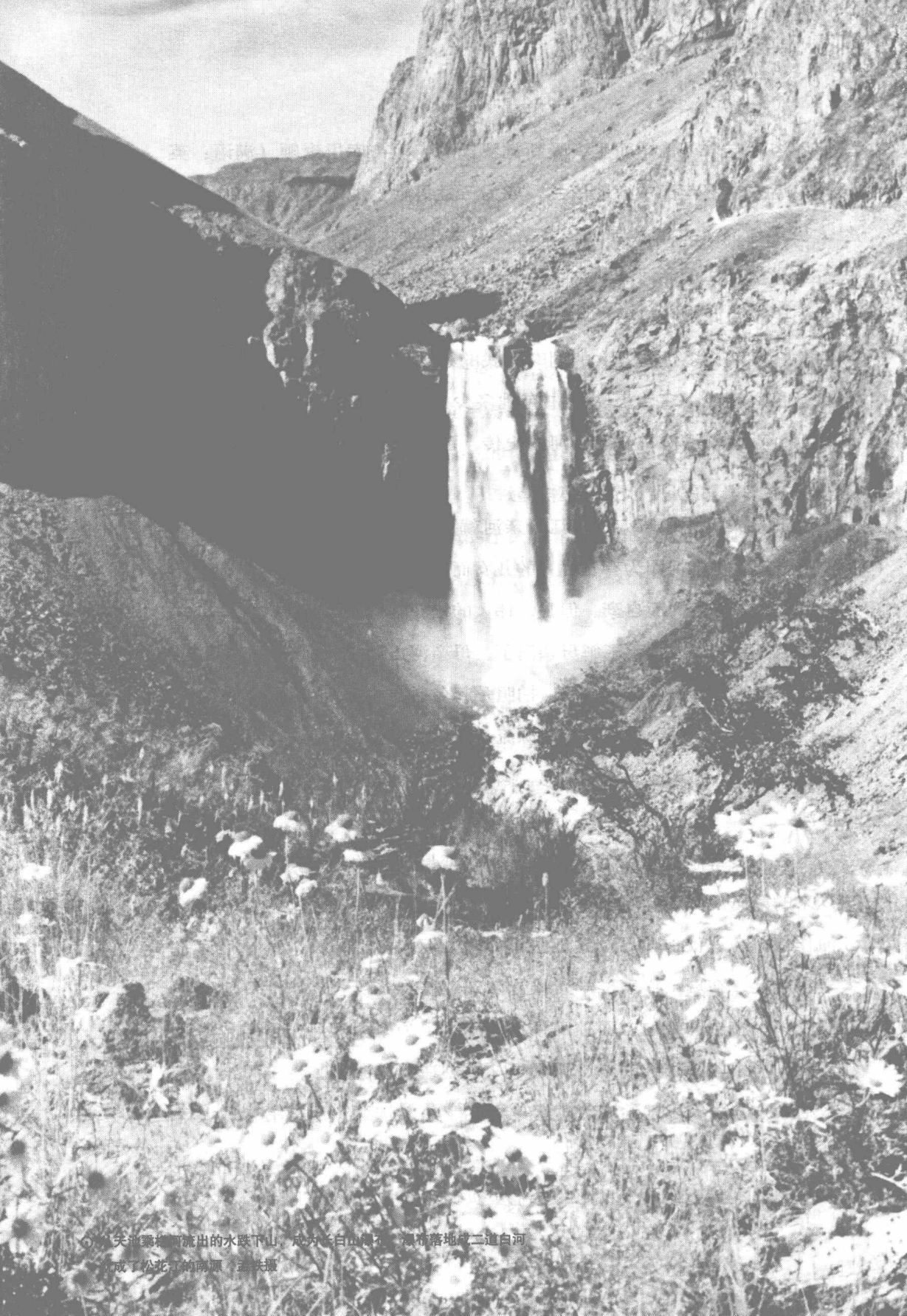
6. 天池瀑布流出的水跌下山，成为长白山瀑布，瀑布落地成二道白河，就成了松花江的南源。