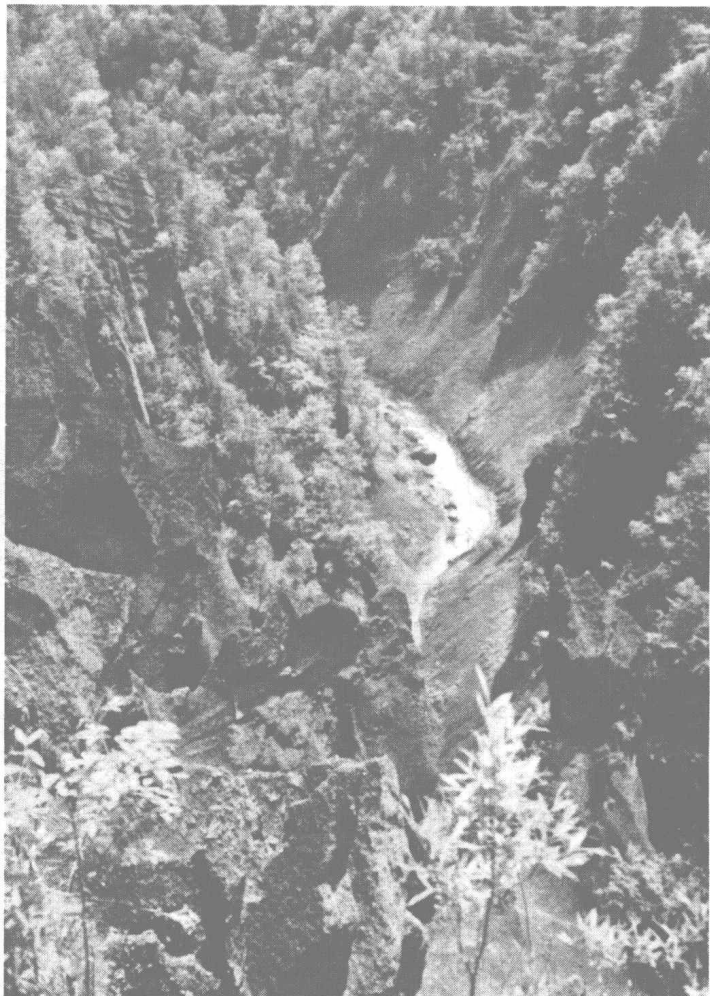
◎ 长白山西坡的锦江大峡谷，是头道松花江源头之一

乃是一种机缘。有了这个机缘，笔者和读者也就成了朋友，而这部松花江母亲河的传记，也就成为我们共同的拥有。