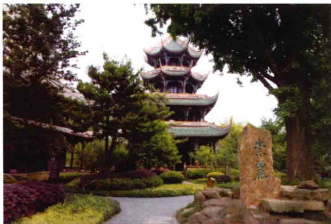
图 1-18 望江楼

地处四川西部，以衙署园林、寺观园林、祠宇园林为主，宅院园林、陵寝园林等为辅。传承了中国古典园林的脉络，又区别于江南、北方和岭南的园林。江南园林玲珑精巧，立意超然，建筑轻盈，白墙灰瓦，空间灵活多变。北方园林则更多显示皇家的大气恢弘，富丽堂皇，普遍有明确中轴线，布局面积较大；而岭南园林主推实用主义，建筑数量多且体量大，装饰丰富。西蜀园林在传承朴素自然观和“天人合一”等思想的基础上结合古迹和名人建立园林，如杜甫草堂、武侯祠、望江楼(图 1-18)、望丛祠、桂湖和宝光寺等，“布局灵活疏朗”“不拘一格”，虽然不比江南的细腻婉约，却也表现出更为大气端庄、古雅清旷、清秀幽然的基调。