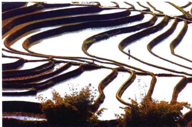
图 1-2 农业景观

景观是指土地及土地上的物质和空间所构成的综合体，是复杂的自然过程和人类活动在大地上的痕迹、烙印(图 1-2)。人类从世代劳动中获得了物质收获、生活保障与精神享受，也从其中获得了“自由”、“尊严”和“审美”。