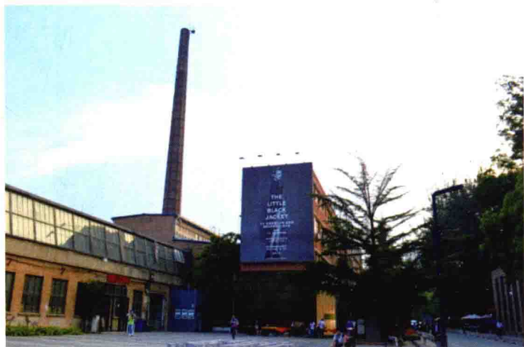
图 1-22 利用废弃工厂改建的 798 街区景观