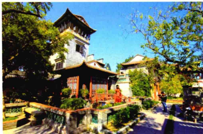
图 1-16 可园