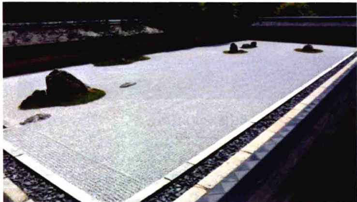
图 1-8 京都龙安寺庭院

日本古典园林以枯山水庭院为其最显著的特征。15 世纪建于京都龙安寺的枯山水庭院(图 1-8)，是园林中的精品。它占地呈矩形，面积仅 330 m 2 ，庭园地形平坦，由 15 尊大小不一的石头及大片灰色细卵石铺地构成。