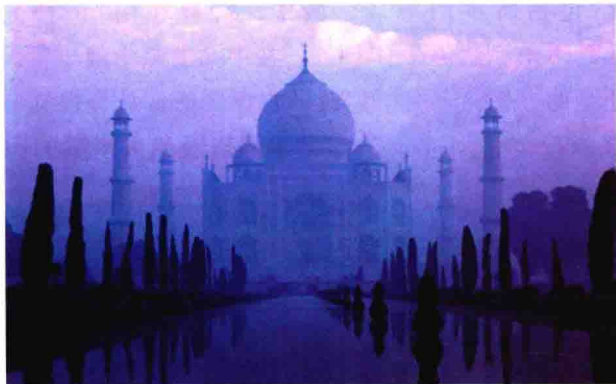
图 1-6 泰姬陵