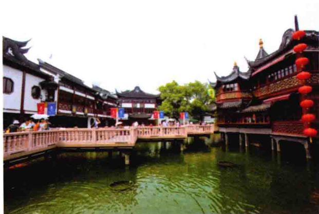
图 1-12 上海豫园(2)