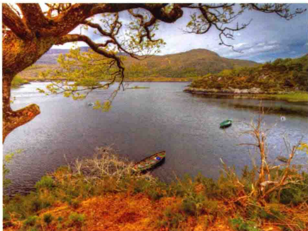
图 1-19 纯粹自然元素构成的景观

现代景观的类型更为多元化、多样化：从纯粹自然元素(图 1-19)，自然元素与人工设计的结合(图 1-20)，到完全人工设计建造物(图 1-21)，甚至人类活动的废弃物(图 1-22)，也可以成为构成景观的元素。