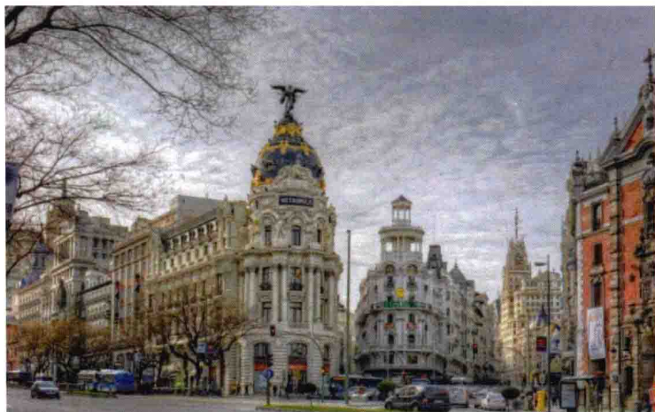
图 1-21 完全人工设计建造的街道景观