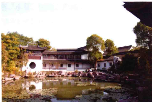
图 1-1 包含日常生活、活动最多内容的私家园林

园林是在一定的空间地域内，运用工程技术和艺术手段，通过改造地形、地貌(包括筑山、叠石、理水等)，种植树木花草，营造建筑、小品，布置园路等途径，创作而成的游憩境域(图 1-1)。