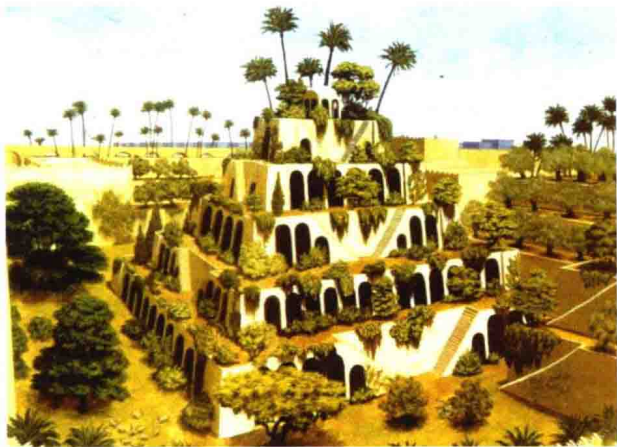
图 1-5 传说中“空中花园”的想象图

中东地区古典园林以传说中巴比伦的“空中花园”(图 1-5)最为著名,后来进一步演化出“阿拉伯风格”园林(图 1-6)。