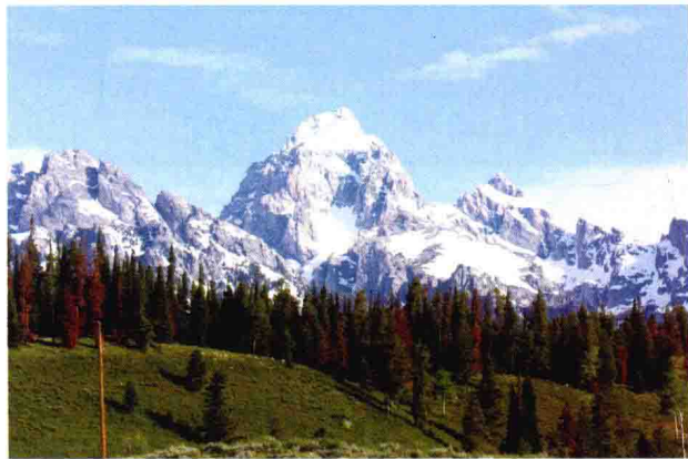
图 1-4 “风景”同义或近义

“景观”一词最早在文献中出现是在希伯来文本的《圣经》(the Book Psalms)中，用于对圣城耶路撒冷总体美景(包括所罗门寺庙、城堡、宫殿在内)的描述。“景观”的英文为 landscape，德语为 Landschaft，法语为 paysage。在中文文献中最早景观一词没有确切的出处考证。无论东方文化还是西方文化，“景观”最早的含义更多具有视觉、美学方面的意义，即与“风景”(scenery)同义或近义(图 1-4)。文学艺术界以及绝大多数的园林风景学者所理解的景观也主要是这一层含义。