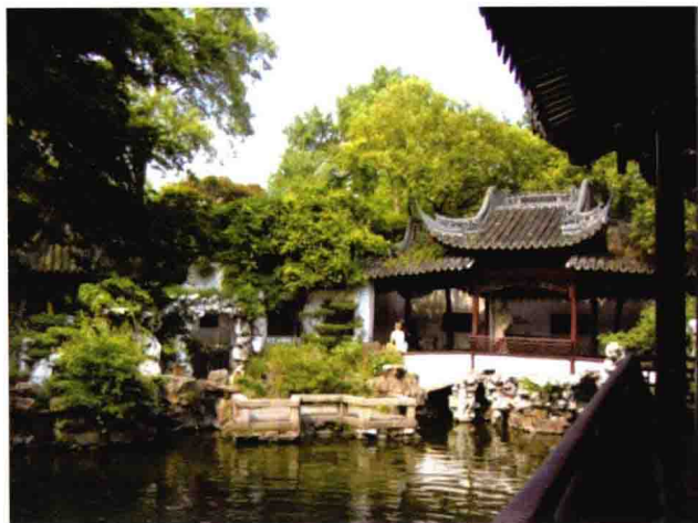
图 1-11 上海豫园(1)

传统私家园林大多在当代转变成成为公共园林，出现了大量游人，场地也出现了过于狭小的感觉。