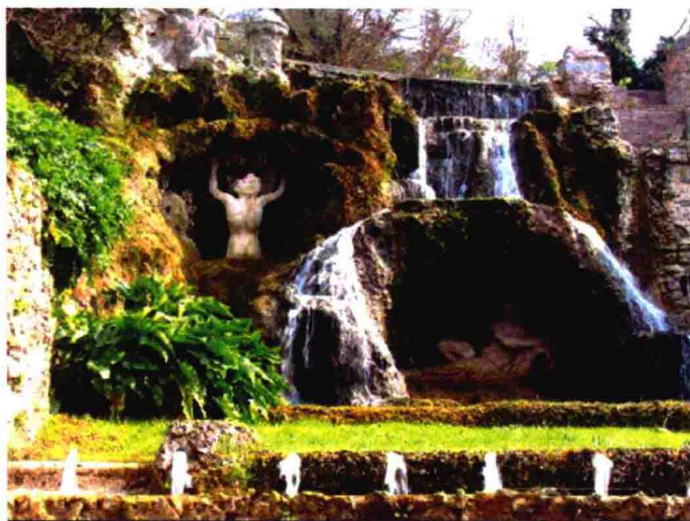
图 1-7 雕塑与水