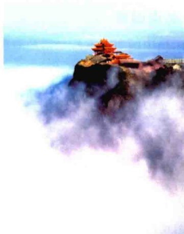
图 1-13 峨眉山寺庙与云海

寺庙园林是指佛寺、道观、历史名人纪念性祠庙的园林，为中国园林的三种基本类型(皇家园林、寺庙园林、私家园林)之一。寺庙园林数量众多，突破了皇家园林和私家园林在分布上的局限，广布在自然环境优美的名山胜地。“可惜湖山天下好，十分风景属僧家”，“天下名胜寺占多”。其中自然景色的优美，环境景观的独特，天然景观与人工景观的高度融合(图 1-13)，内部园林气氛与外部园林环境的有机结合，都是皇家园林和私家园林所望尘莫及的。