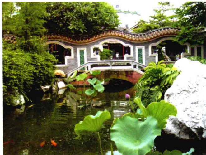
图 1-15 清晖园