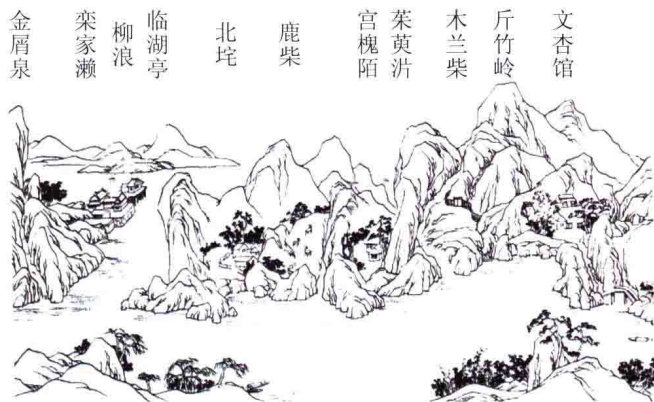
图 1-3 唐代“诗佛”王维的辋川别业

即在一定的地段范围内，利用并改造天然山水地貌或者人为地开辟山水地貌，结合植物的栽植和建筑的布置，从而构成一个供人们观赏、游憩、居住的环境。