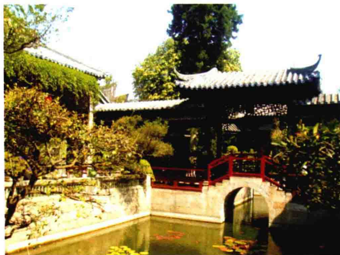
图 1-17 余荫山房