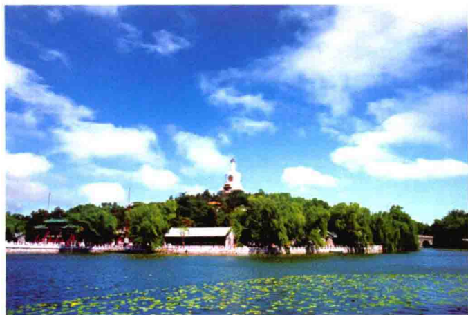
图 1-10 北海公园

它的特点是规模宏大，真山真水较多，园中建筑色彩富丽堂皇，建筑体型高大。现存的著名皇家园林有：北京的颐和园、北京的北海公园(图 1-10)、河北承德的避暑山庄。