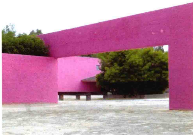
图 1-9 巴拉甘风格建筑与园林

现代园林景观形式包括：法国现代园林风格、现代巴洛克风格、巴拉甘风格(图 1-9)、加利福尼亚学派、瑞典斯德哥尔摩学派园林景观等。