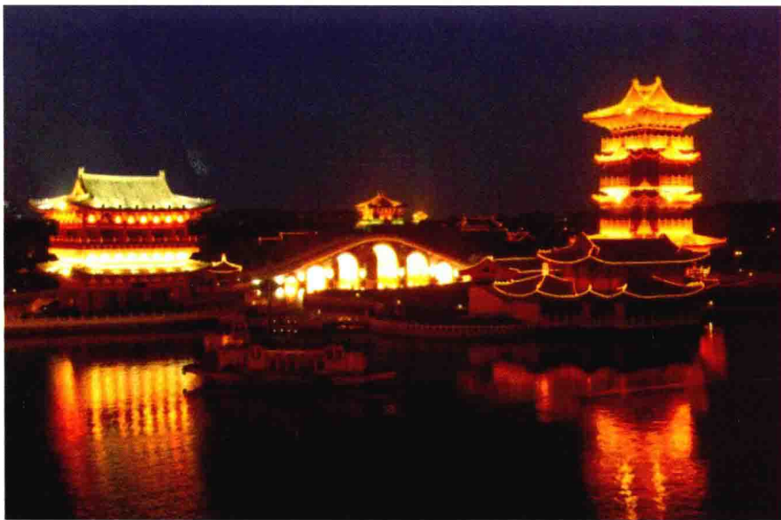
图 1-14 “清明上河园”

北方园林，因地域宽广，范围较大；又因大多所在地为首都，以建筑富丽堂皇著名。因自然气象条件所局限，河流湖泊、园石和常绿树木都较少。风格粗犷，秀丽媚美不足。北方园林的代表大多集中于北京、西安、洛阳、开封(图 1-14)。