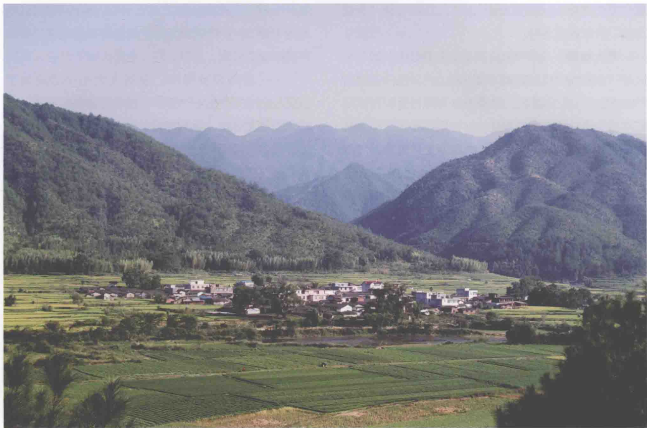
•闽西：大山深处的村庄

像马鞍形。福建西部和中部有两列呈东北—西南走向的大山带，它们与福建的海岸带平行，构成福建地形的基本骨架。