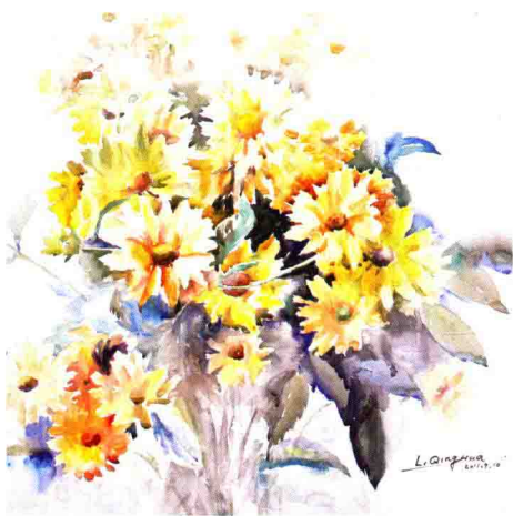
太阳花 54 cm x 54 cm 2008