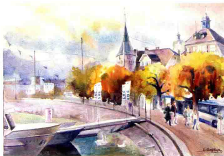
卢塞恩湖畔 79 cm x 54 cm 2013

到大自然中去，到生活中去，汲取艺术营养，走的路多了，看的东西自然多起来，笔下的形象就丰富起来。勤能补拙，只要坚持不懈、锲而不舍，定能有所收获！水彩的人生是绚丽的、永恒的。以水融情、以彩绘景，用真诚表现自然之美、生活之美、艺术之美，愿我的水彩画给大家带来快乐！