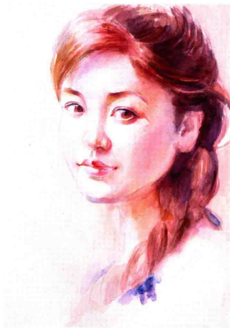
美女肖像 38 cm x 52 cm 2010