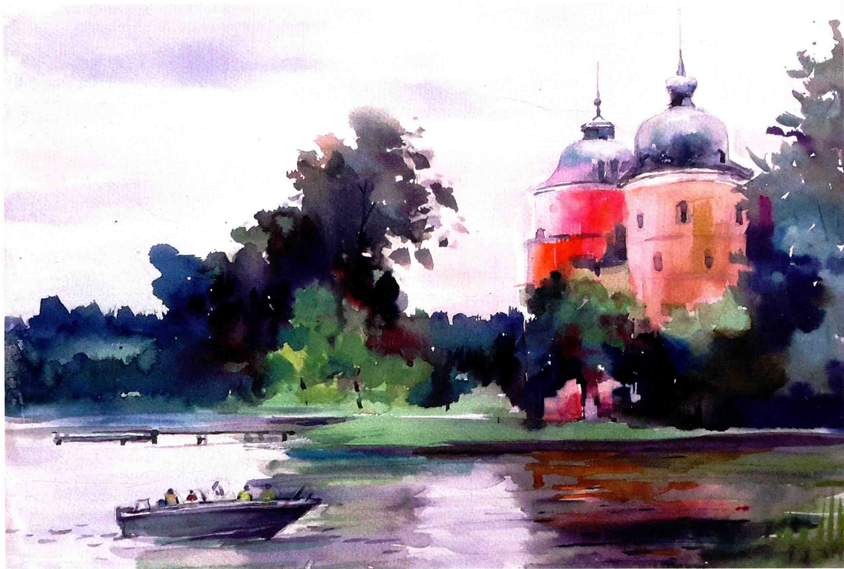
菲德列古堡小景 52 cm x 38 cm 2015