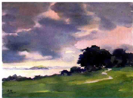
罗托鲁阿秋色 79 cm x 54 cm 2013