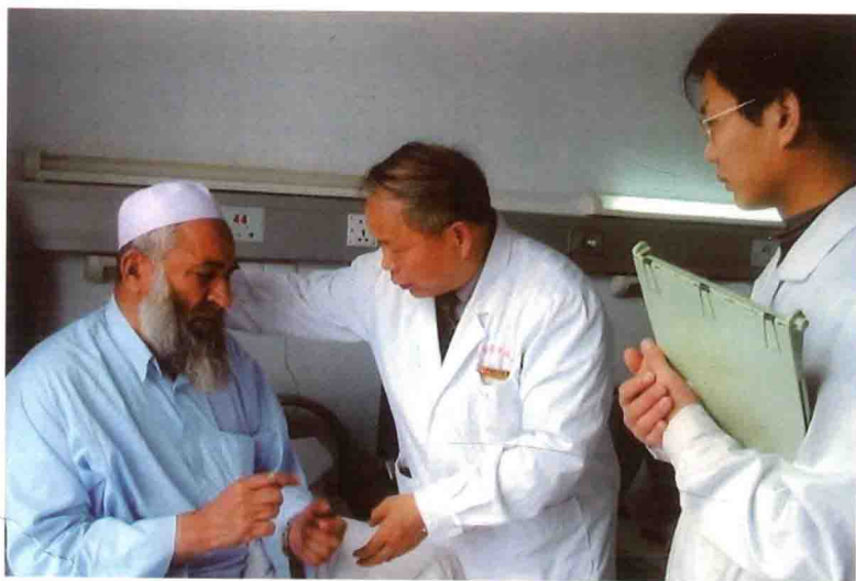
给阿富汗病人看病