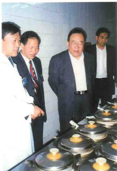
原卫生部副部长朱庆生视察医院中药煎药房