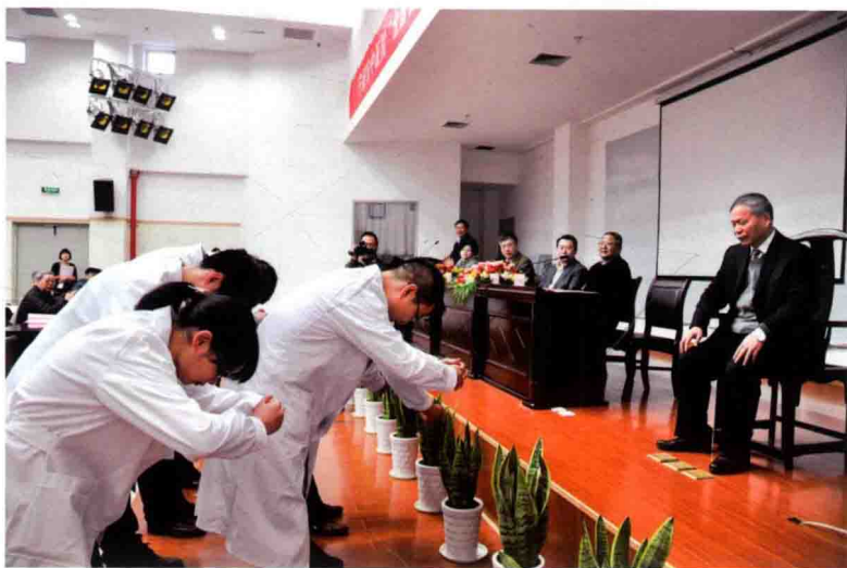
名老中医工作室启动、拜师仪式