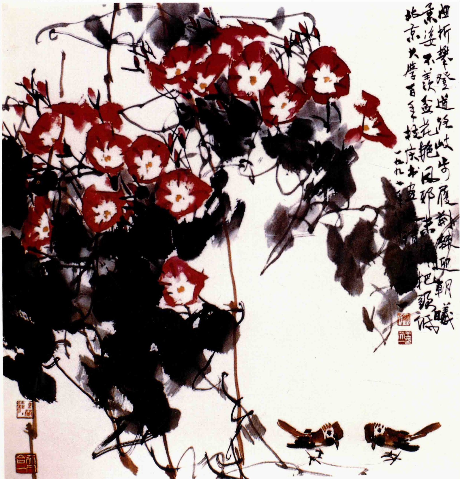
红牵牛花 68cm×68cm 1997年