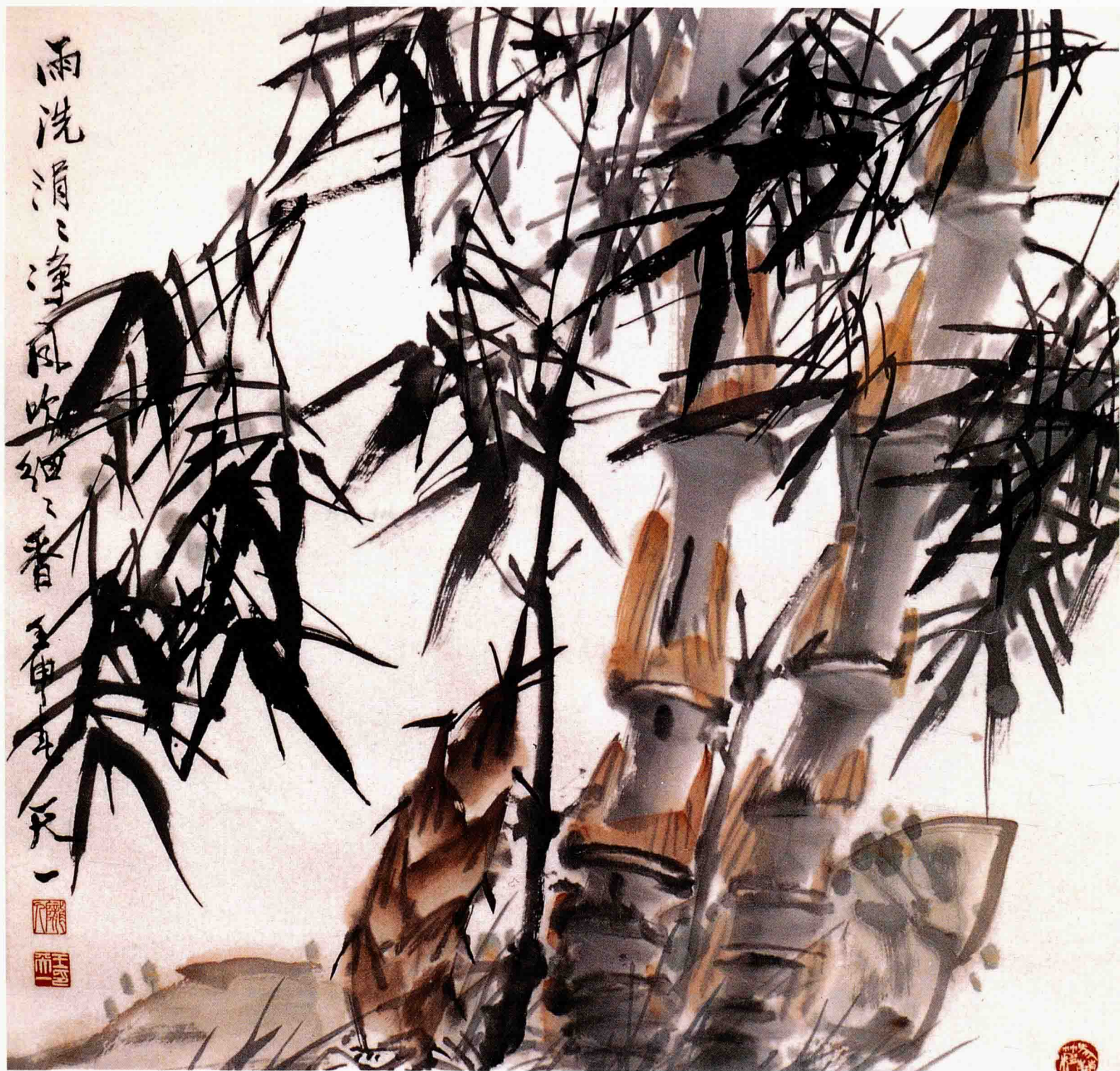
岩竹 68cm×68cm 1992年