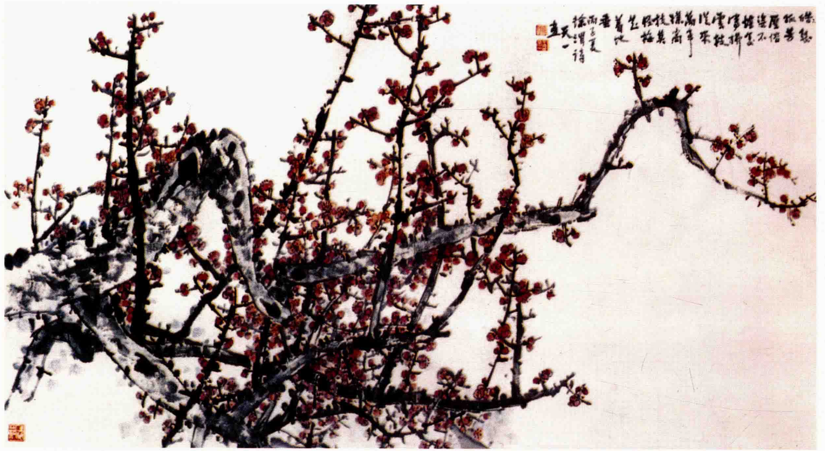
红梅 124cm×246cm 1996年