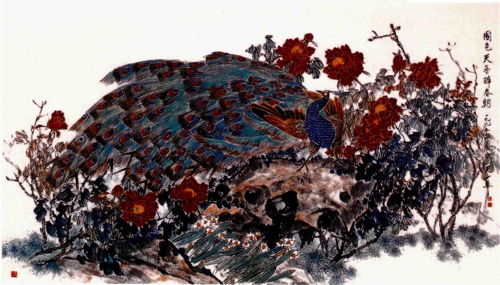
国色天香醉春朝(天安门大厅布置画) 140cm×265cm 1999年