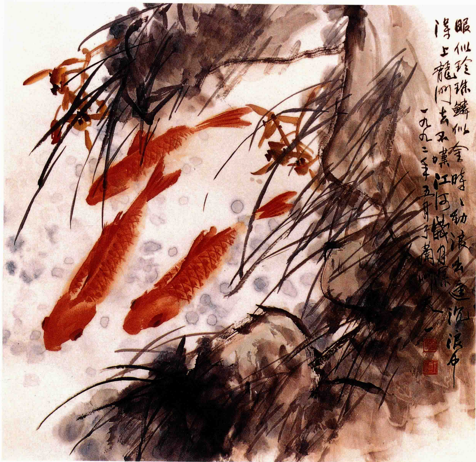
红三鲤 68cm×68cm 1992年