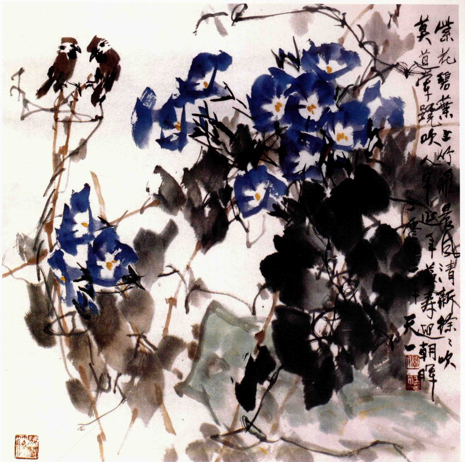
兰牵牛 68cm×68cm 2002年