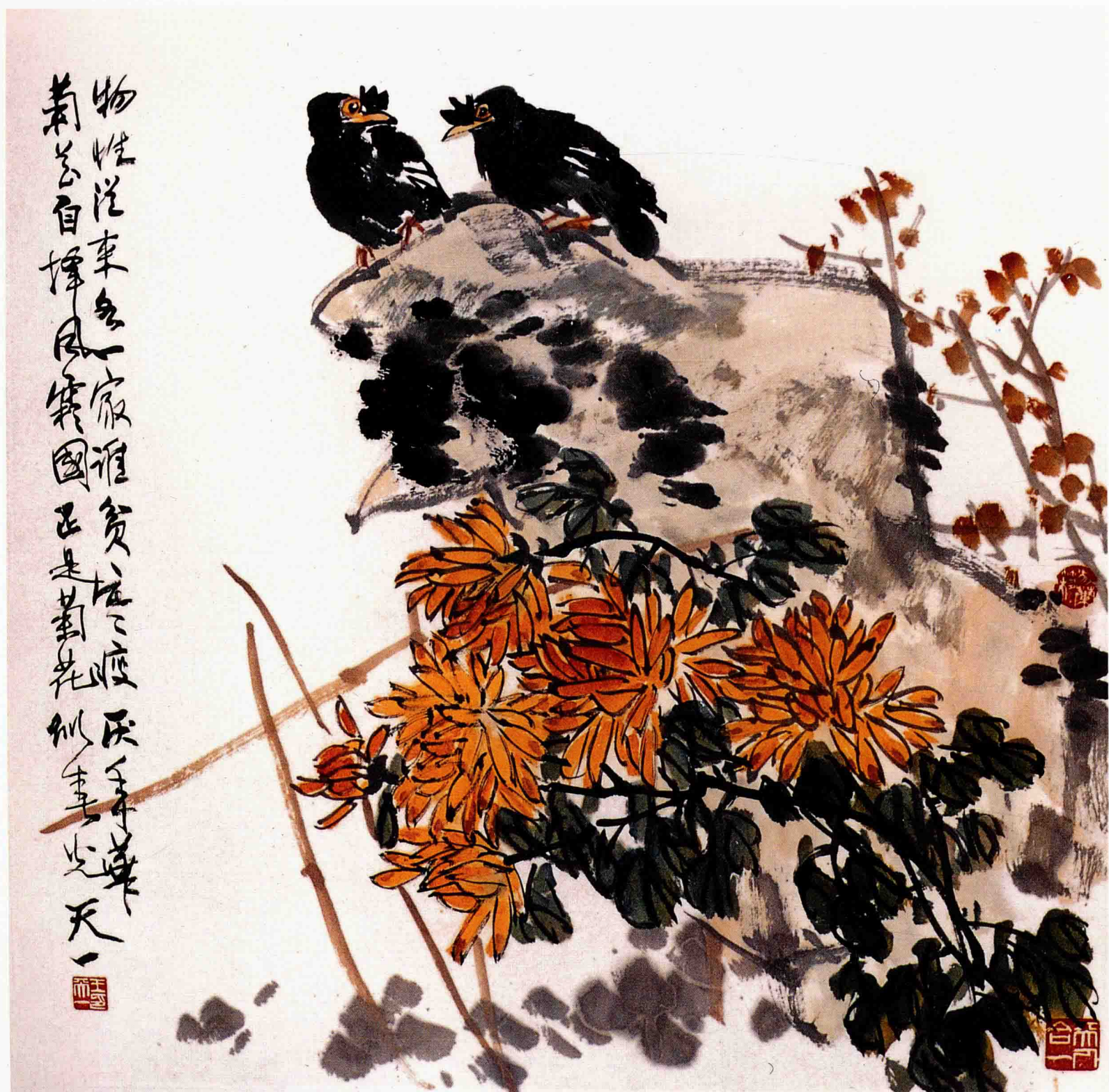
金菊斗艳 68cm×68cm 2000年