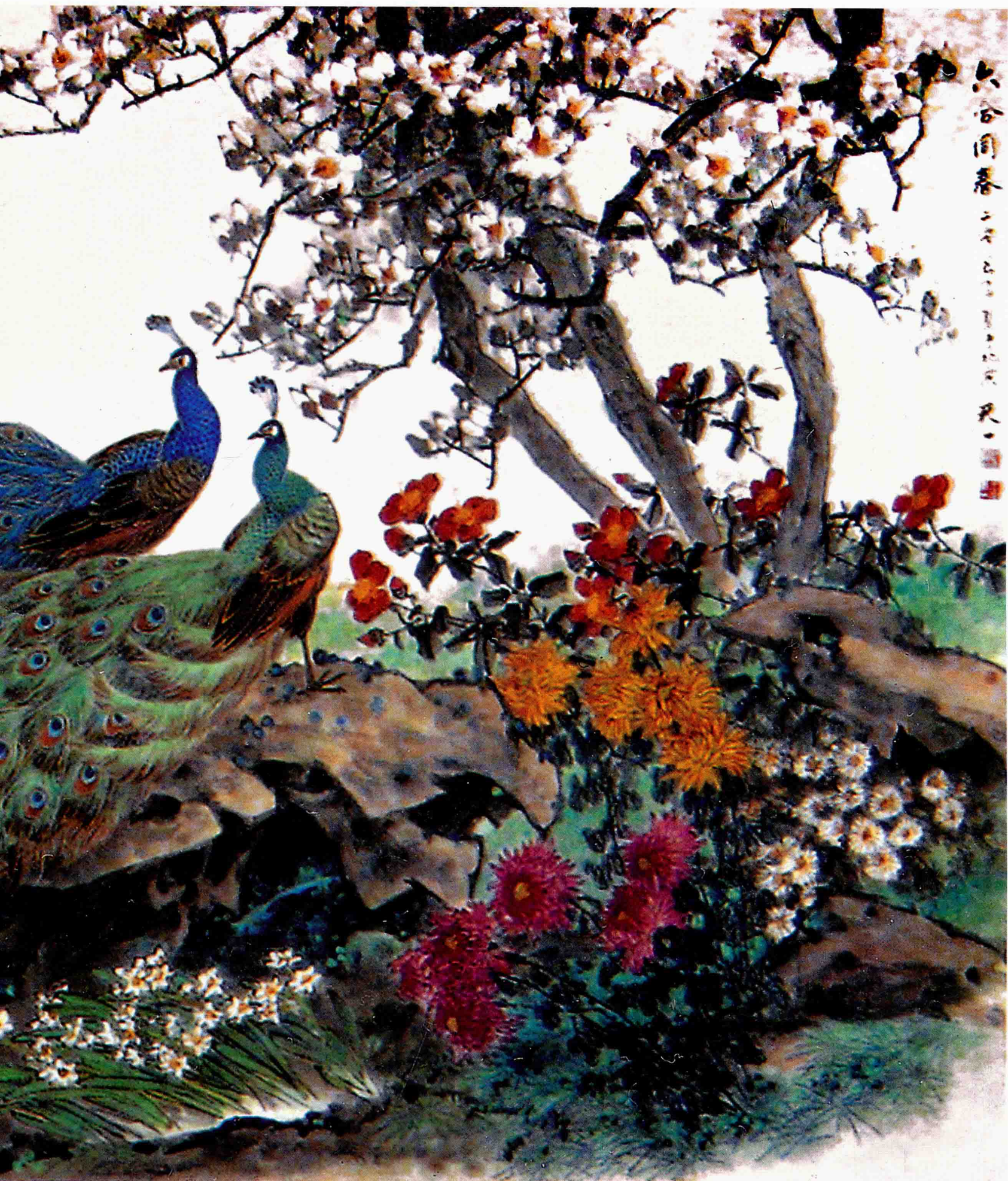
六合同春（国务院布置画） 250cm×370cm 2005年