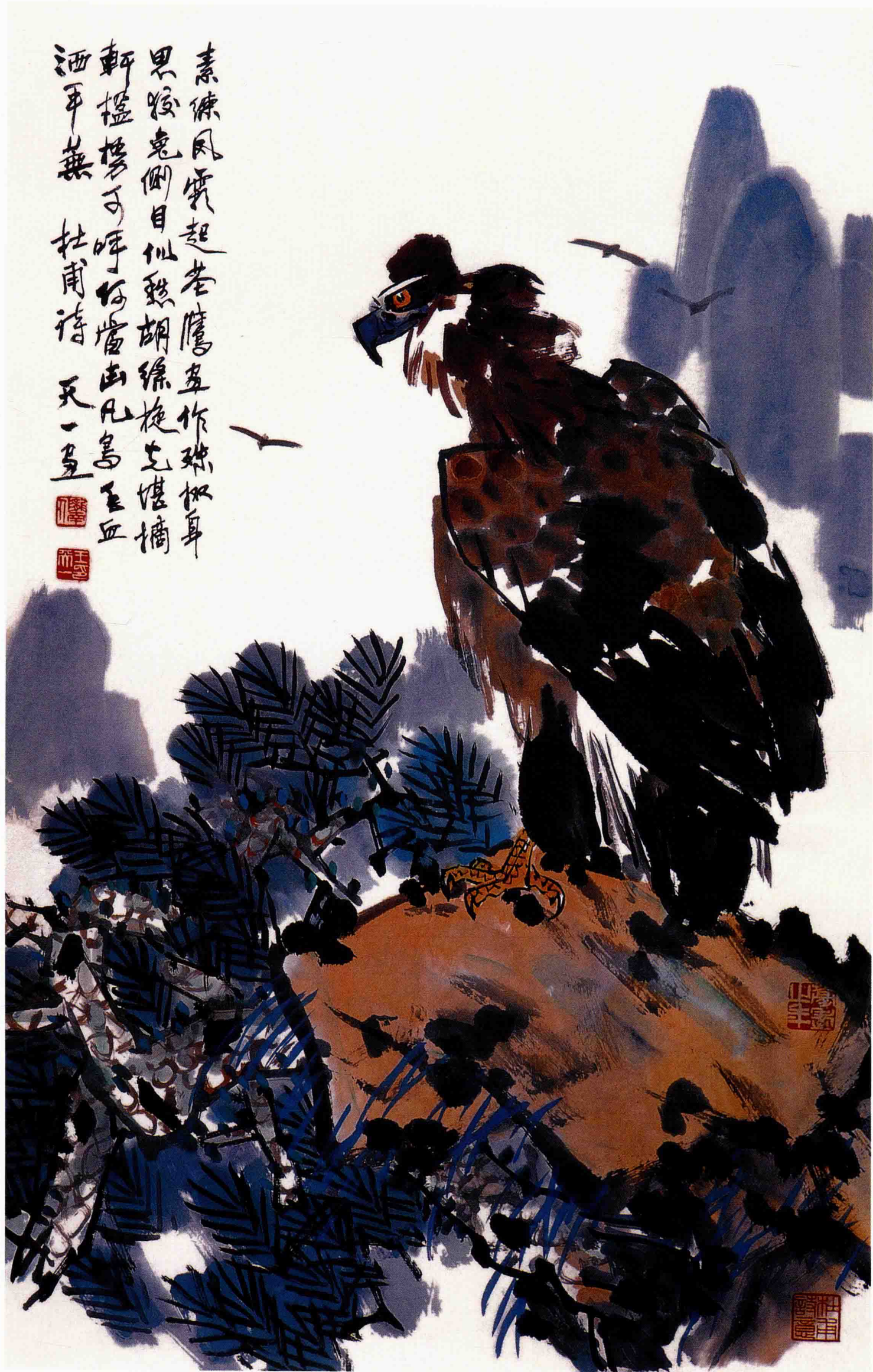
鷹 96cm×60cm 2009年