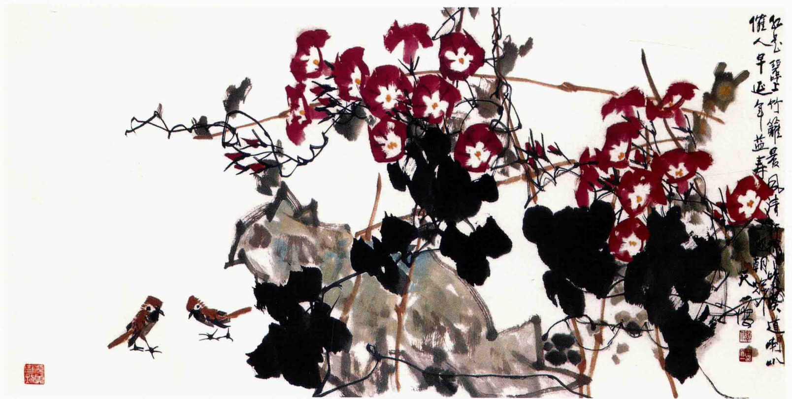
红牵牛(北京画展) 67cm×136cm 2002年