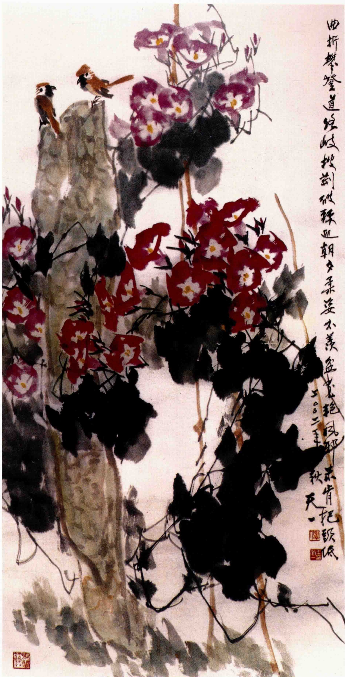
映山红 68cm×68cm 1992年