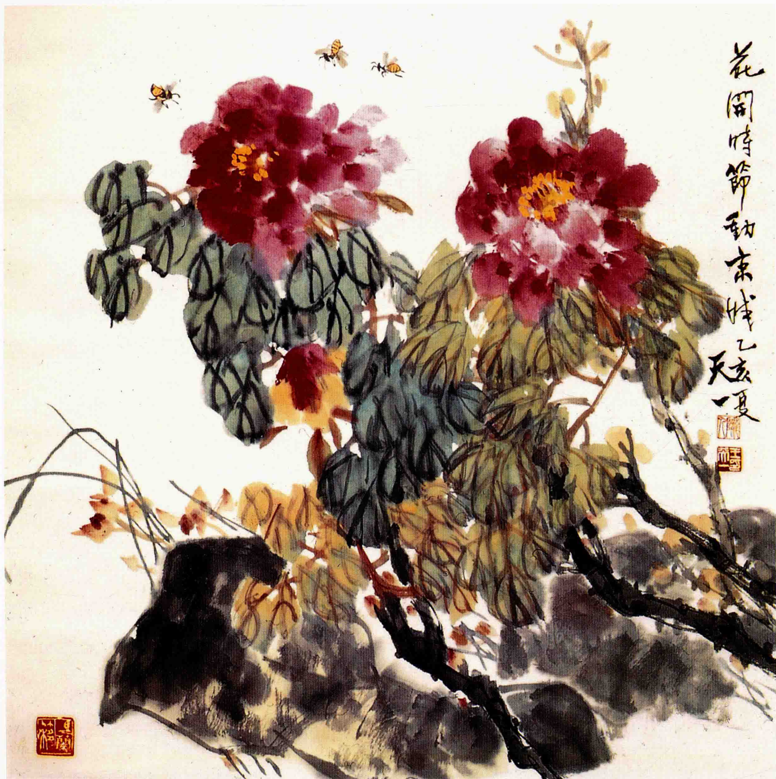
双艳 67cm×69cm 1995年

笔笔是形体，又要笔笔是书法”，两者要达到完美。和谐。有机的统一，方能得其臻妙。而王天一先生恰好具备了这些因素，他有较广泛的绘画涉猎，一度从事油画创作，有扎实的造型基础和细微精确的观察力；也曾搞过舞台美术，有较高的概括力。即使中国画他也不同于别人仅长于某一画科种类或某一题材，而是有较宽的画路，山水、花鸟、人物兼善，工笔写意皆长，且均富有造诣，这于他可以相互借鉴，取长补短。而传统文化及秦陇地区丰厚的民间艺术和丰富的人生阅历则使得他的绘画形式语言——笔墨得到了蒙养，较之他人更多了些人文气息和文化内涵，也更富有韵味。