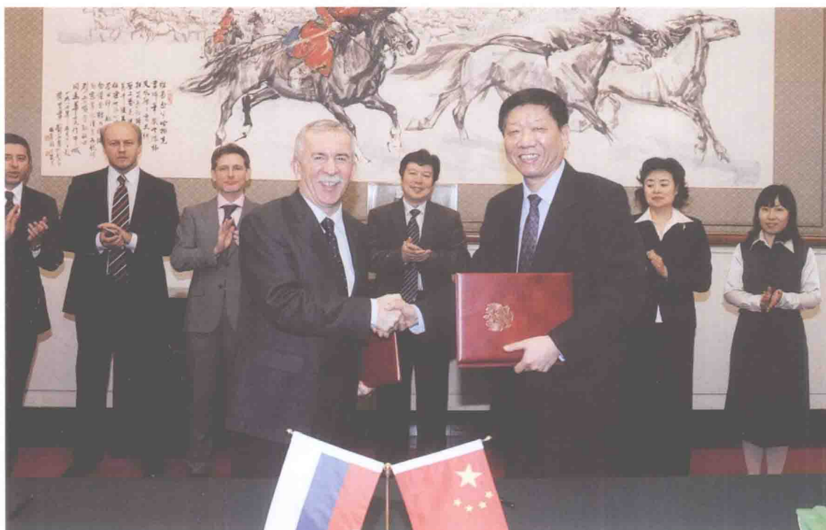
2011年4月20日，人社部部长尹蔚民与俄罗斯总统助理奥列格·马尔可夫签署合作协议。