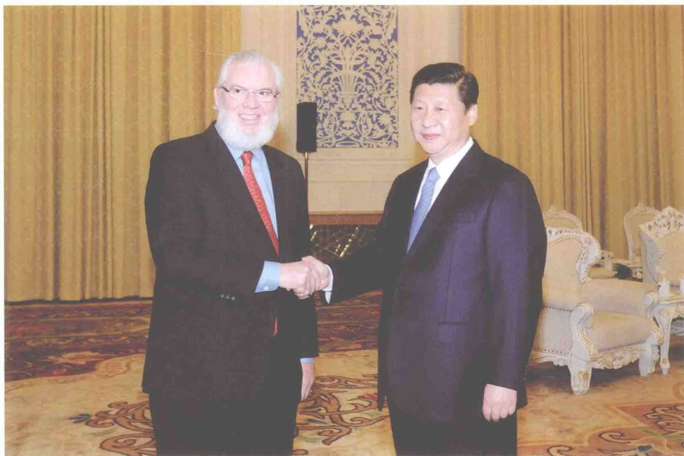
2011年11月29日，中共中央政治局常委、中央书记处书记、国家副主席习近平会见国际劳工组织总干事胡安·索马维亚。