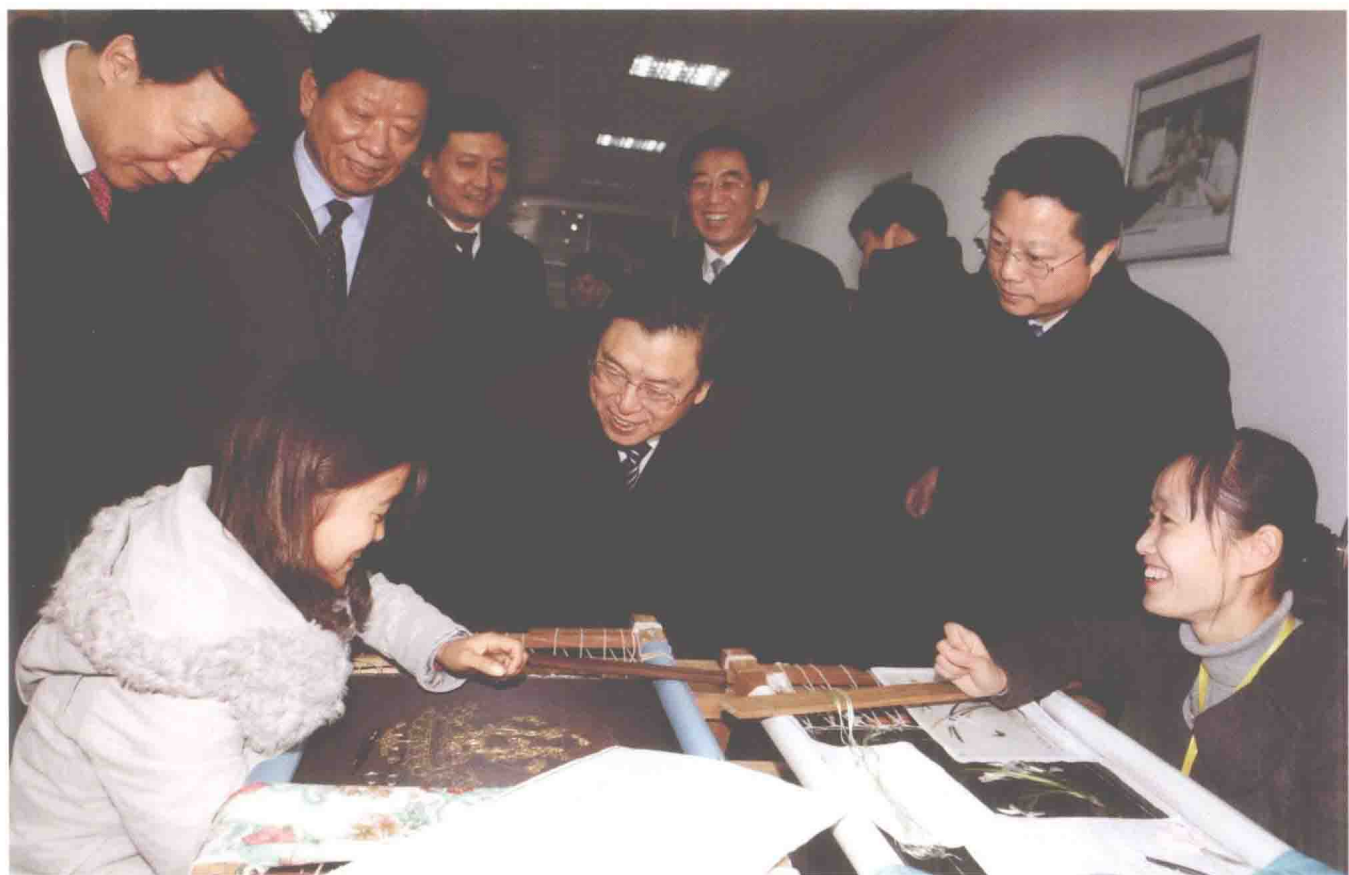
2011年2月17日，中共中央政治局委员、国务院副总理张德江在江苏无锡考察技能开发工作。人社部部长尹蔚民、副部长王晓初等陪同。