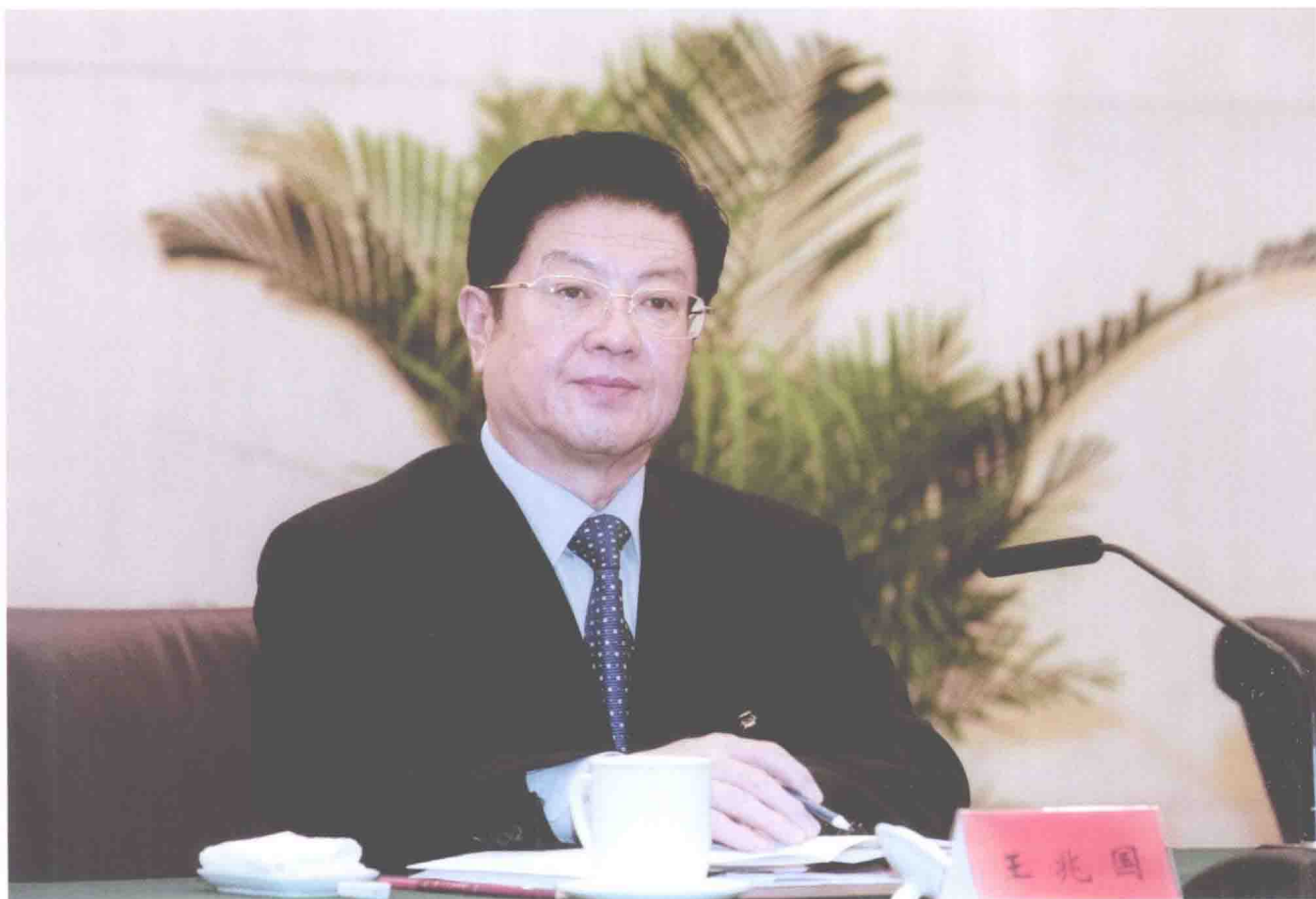
2011年8月15至16日，中共中央政治局委员、全国人大常委会副委员长、中华全国总工会主席王兆国主持全国构建和谐劳动关系先进表彰暨经验交流会议。