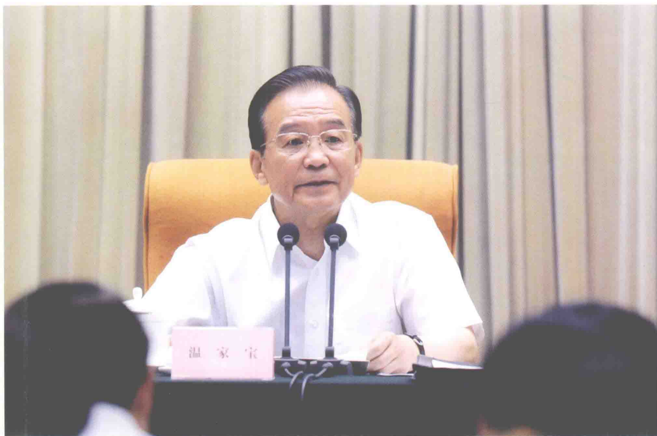
2011年6月20日，中共中央政治局常委、国务院总理温家宝出席全国城镇居民社会养老保险试点工作部署暨新型农村社会养老保险试点经验交流会议并作重要讲话。