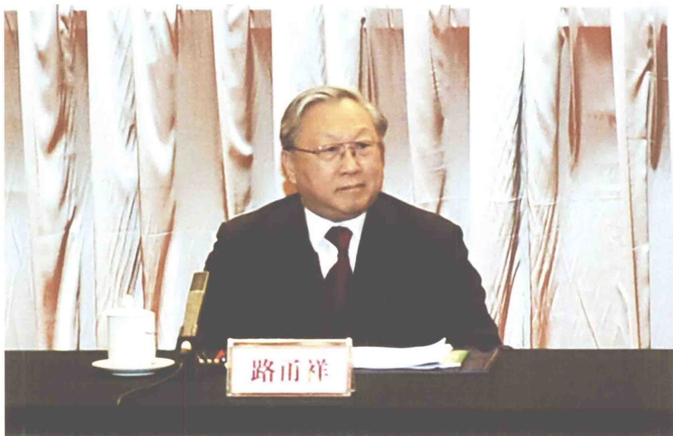
2011年1月19日，全国人大常委会副委员长路甬祥出席公务员法实施五周年座谈会。