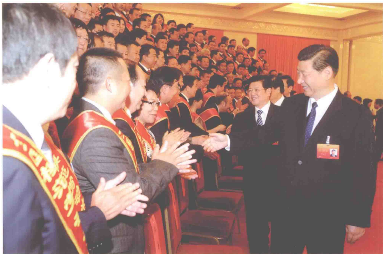
2011年8月15日，中共中央政治局常委、中央书记处书记、国家副主席习近平等中央领导同志会见全国构建和谐劳动关系先进表彰暨经验交流会议代表。