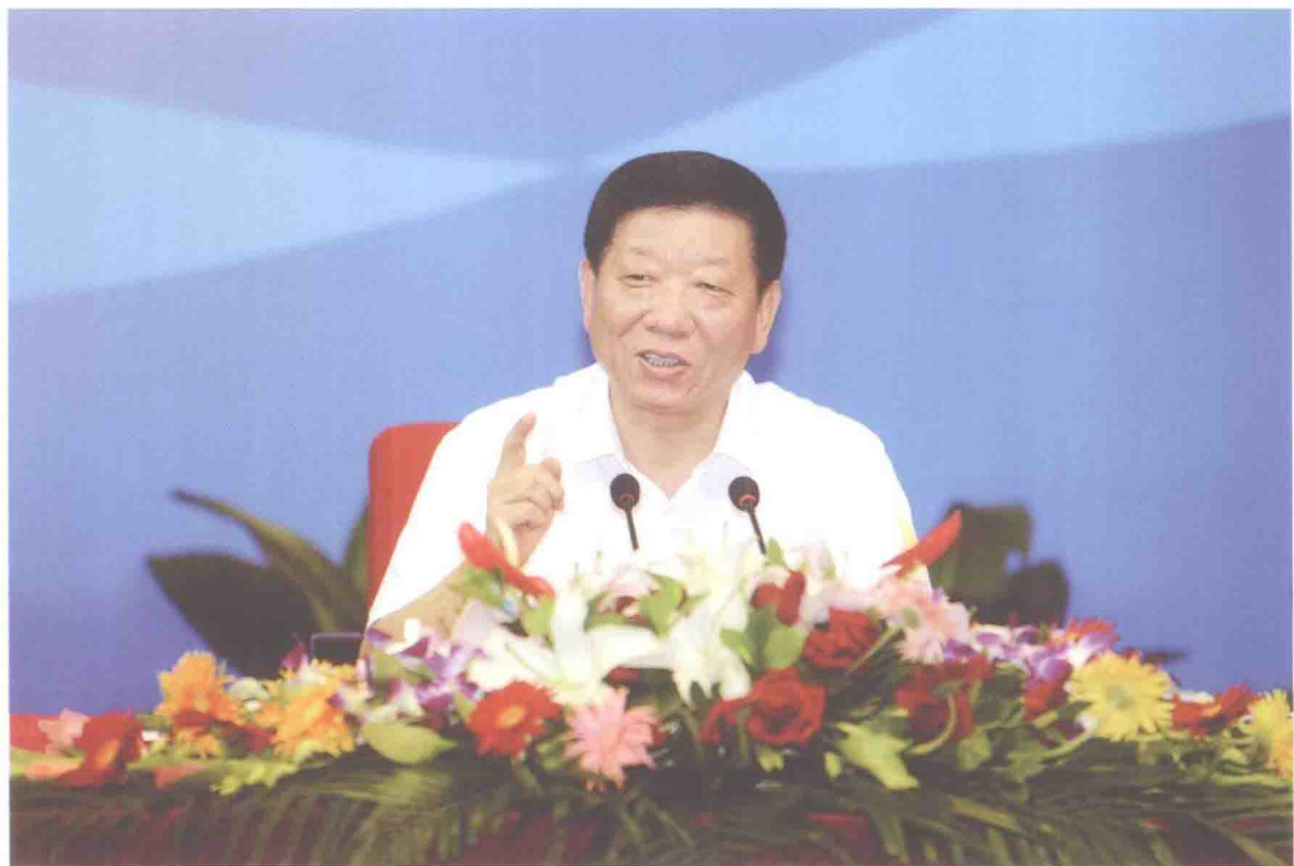
2011年7月26日，中组部副部长、人社部部长尹蔚民主持人社部务虚会并讲话。