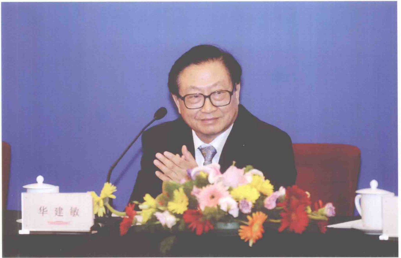
2011年7月4日，全国人大常委会副委员长华建敏出席《社会保险法》宣传周启动仪式并作重要讲话。