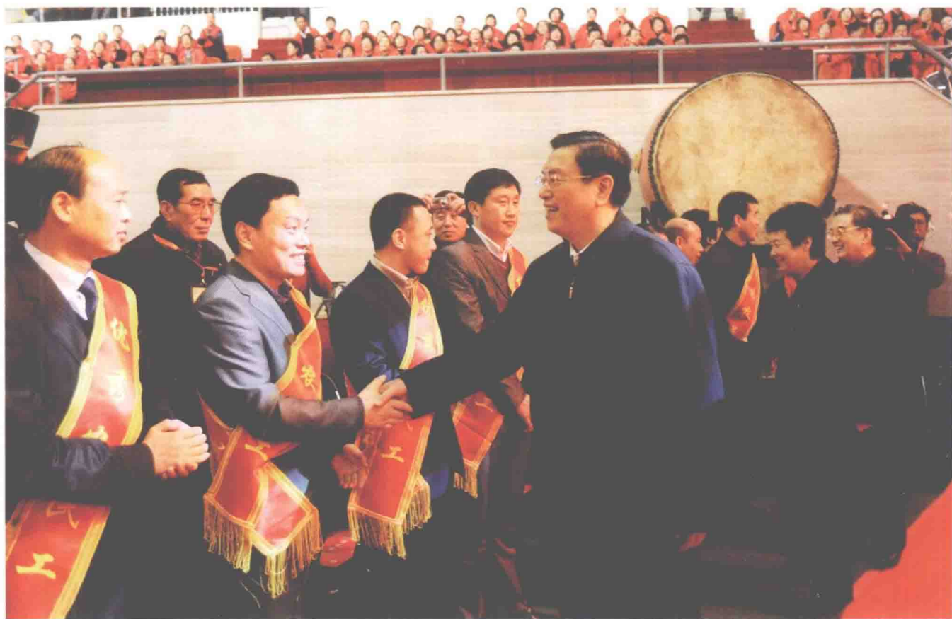
2011年12月28日，中共中央政治局委员、国务院副总理张德江，全国人大常委会副委员长严隽琪，全国政协副主席李金华出席温暖之春——2012年慰问全国农民工春节晚会，会见全国优秀农民工代表。