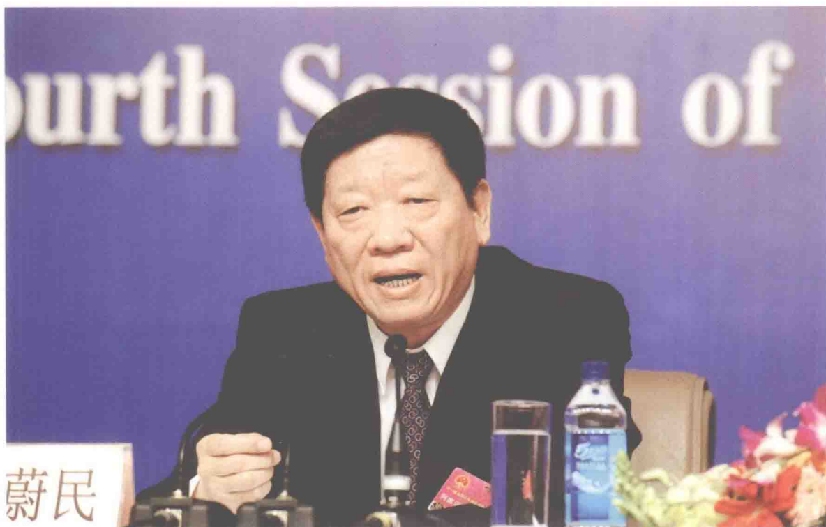
2011年3月8日，人社部部长尹蔚民出席十一届全国人大四次会议记者会答中外记者问。