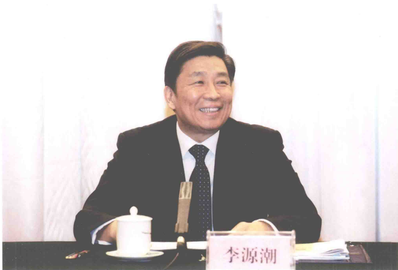
2011年1月19日，中共中央政治局委员、中央书记处书记、中组部部长李源潮出席公务员法实施五周年座谈会并作重要讲话。