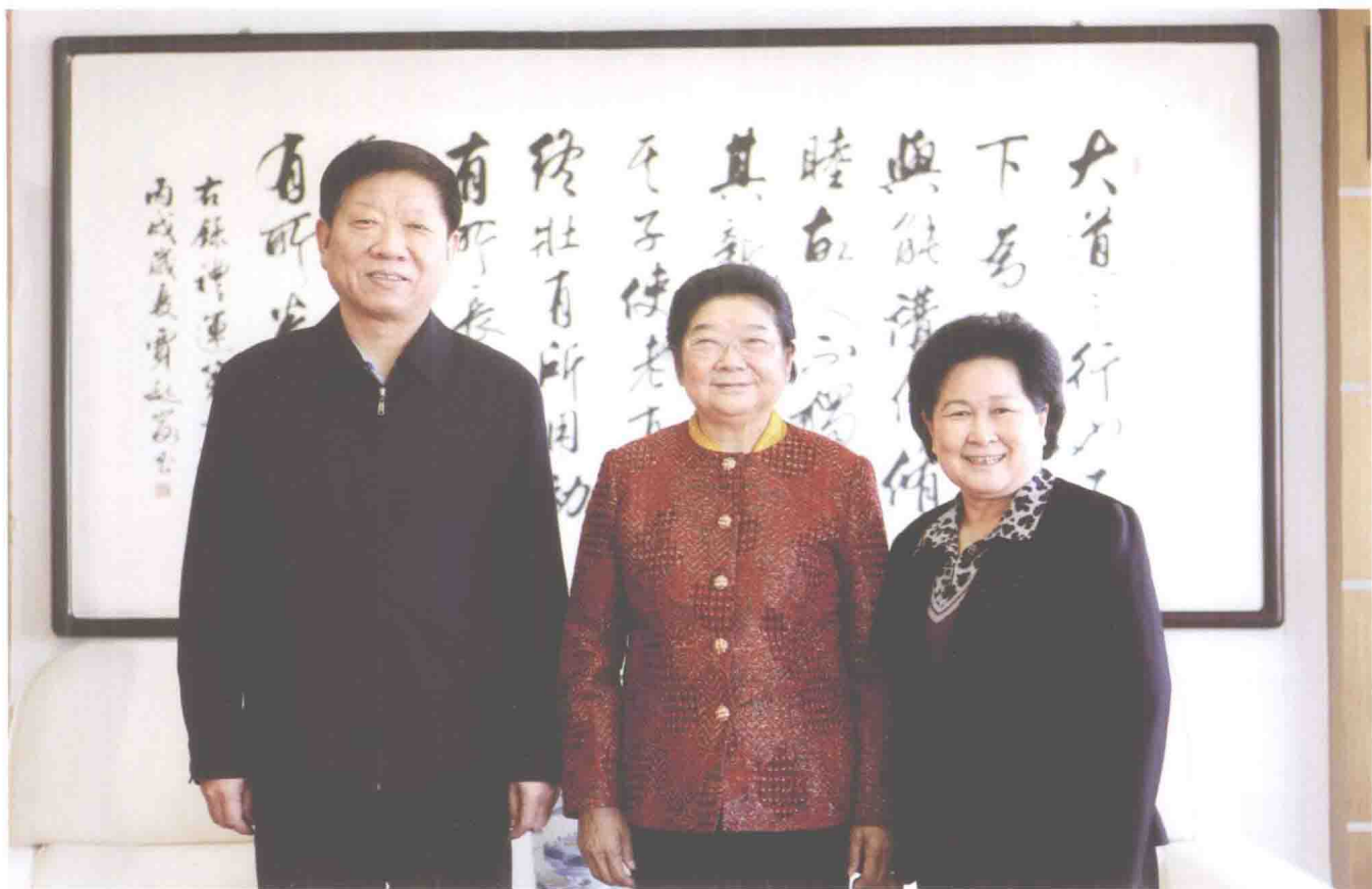
2011年3月2日，第十届全国人大常委会副委员长顾秀莲莅临人力资源社会保障部，亲切会见尹蔚民部长、中国劳动学会会长华福周。