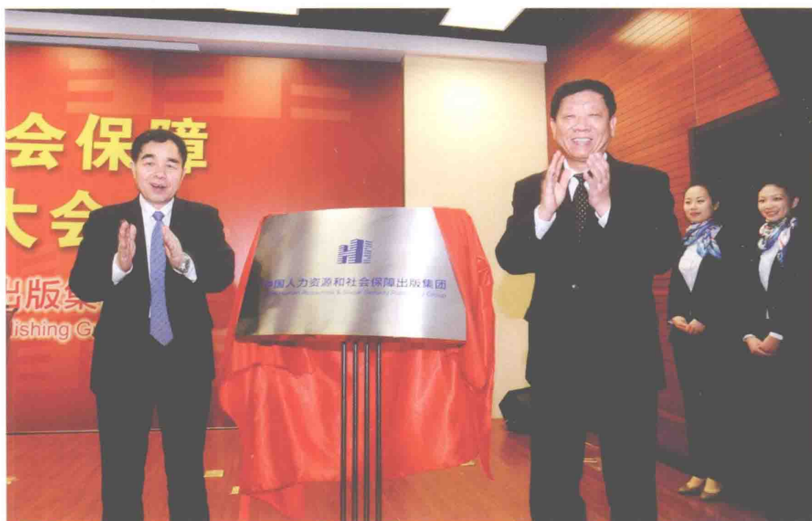
2011年1月16日，中组部副部长、人社部部长尹蔚民和新闻出版总署署长柳斌杰共同为中国人力资源和社会保障出版集团揭牌。