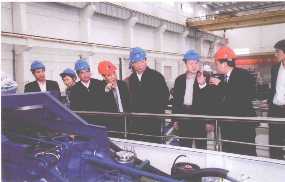
2011年3月30日，中组部副部长、人社部部长尹蔚民在广东佛山市广东明阳风电调研。