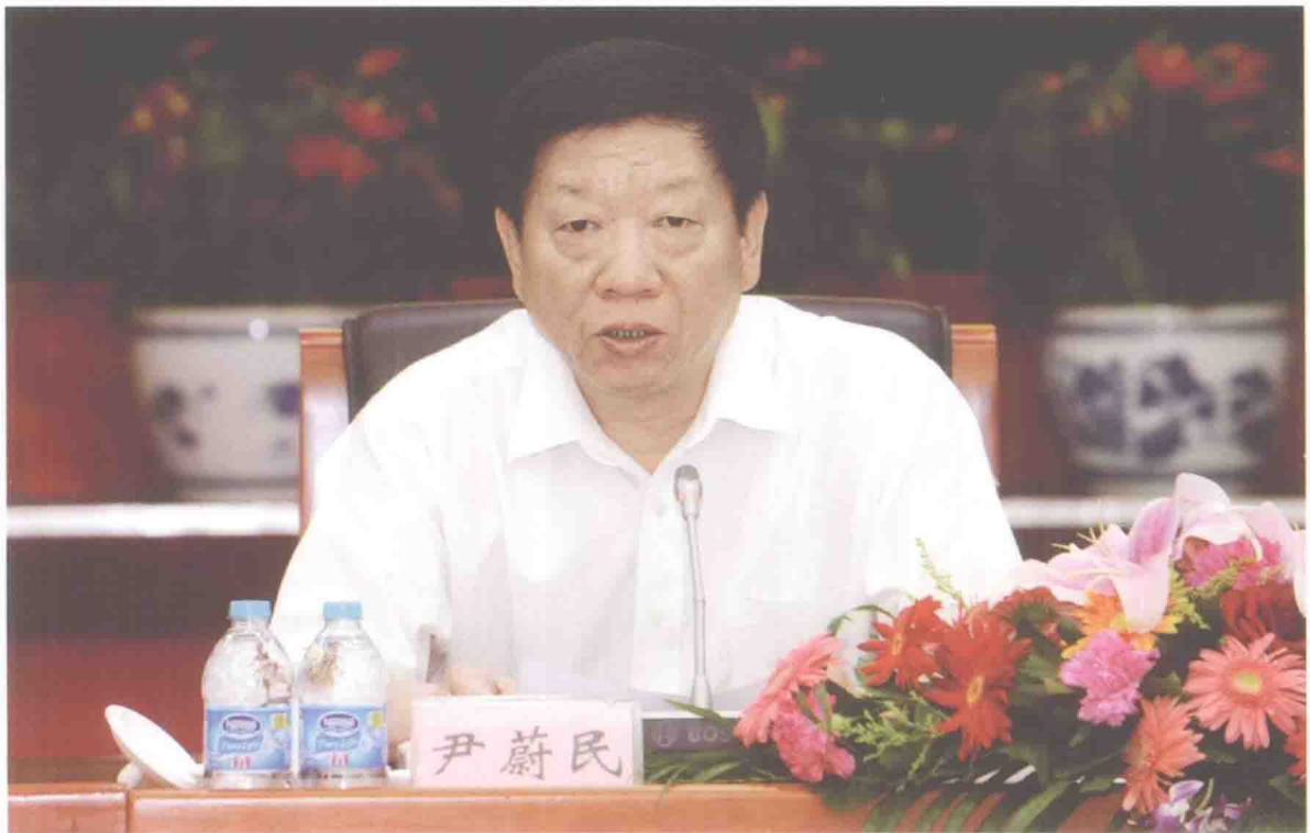
2011年6月24日，中组部副部长、人社部部长尹蔚民在庆祝中国共产党成立90周年座谈会作重要讲话。