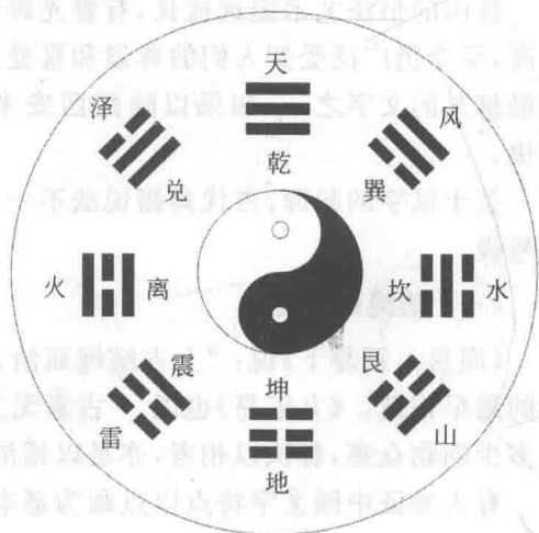
图 1-2 八卦

对于仓颉造字说，鲁迅先生在《门外文谈》中提出了自己的看法：“但在社会里，仓颉也不止一个，有的在刀柄上刻一点图，有的在门户上画一些画，心心相印，口口相传，文字就多起来，史官一采集，便可以敷衍记事了。中国文字的由来，恐怕也逃不出这个例子。”