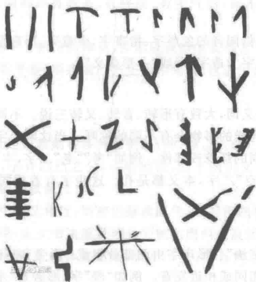
图 1-4 西安半坡出土彩陶上的刻画符号

1954年在陕西西安半坡仰韶文化遗址出土了许多新石器时代的陶片。值得注意的是,有些陶片上刻着类似文字的符号,经古文字家的研究,认为它是汉字的原始形态,是“陶文”(见图1-4)。