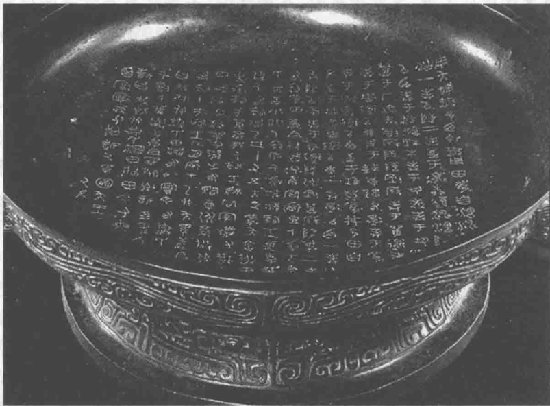
图 1-5 《散氏盘》

其中有名的《散氏盘》(见图 1-5)，上有铭文 357 字，是盘中铭文最长的一件。其书法浑朴雄伟，用笔豪放质朴，醇厚圆润；结字寄奇谲于纯正，壮美多姿。还有《毛公鼎》，铭文长达 497 字，其书法奇逸飞动，笔意圆劲茂隽，气象浑穆，结构方长，较散氏盘稍端整。