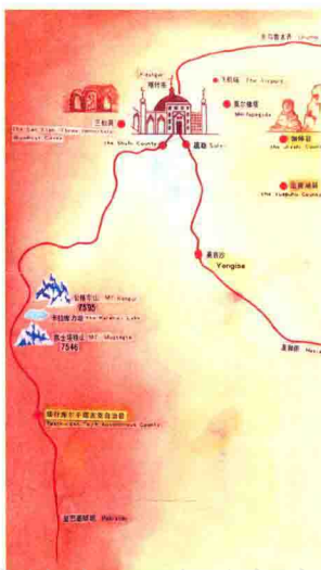
图0-1 喀什地区示意图