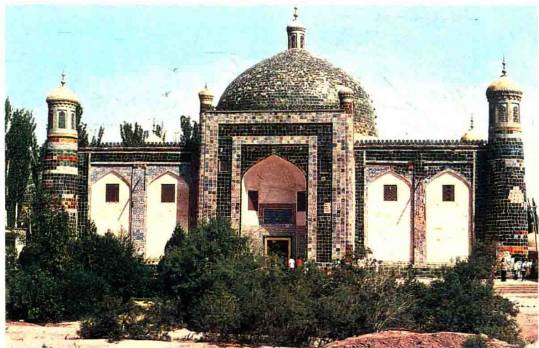
图1-1 喀什阿巴霍加麻扎，是新疆现存规模最大、保存较好的古代陵墓。该陵墓于1040年为理藩阿巴霍加之父阿吉·穆罕默德·玉素甫而建，后历经扩建修缮，成为阿巴霍加及其家族五代人的坟墓。因相传这里曾有清乾隆皇帝的维吾尔族妃子——香妃（香妃），故又称“香妃墓”。

唐代，疏勒国首府为伽师城，即疏勒镇所在地。《唐书·地理志》上说，疏勒西南北三面有山，城在水中。其遗址即今喀什市以东28公里处的汗诺依古城。这个时期佛教达到鼎盛，公元644年唐玄奘称此地“淳信佛法，勤营福利，伽蓝数百所，僧徒万余人，习学上乘教说，一切有部。”疏勒镇建起了名扬西域的大云佛寺。闻名于世的丝绸之路北线必经疏勒，进而向西延伸，使这里成为丝绸之路上的重镇，商贾云集，繁荣鼎盛。