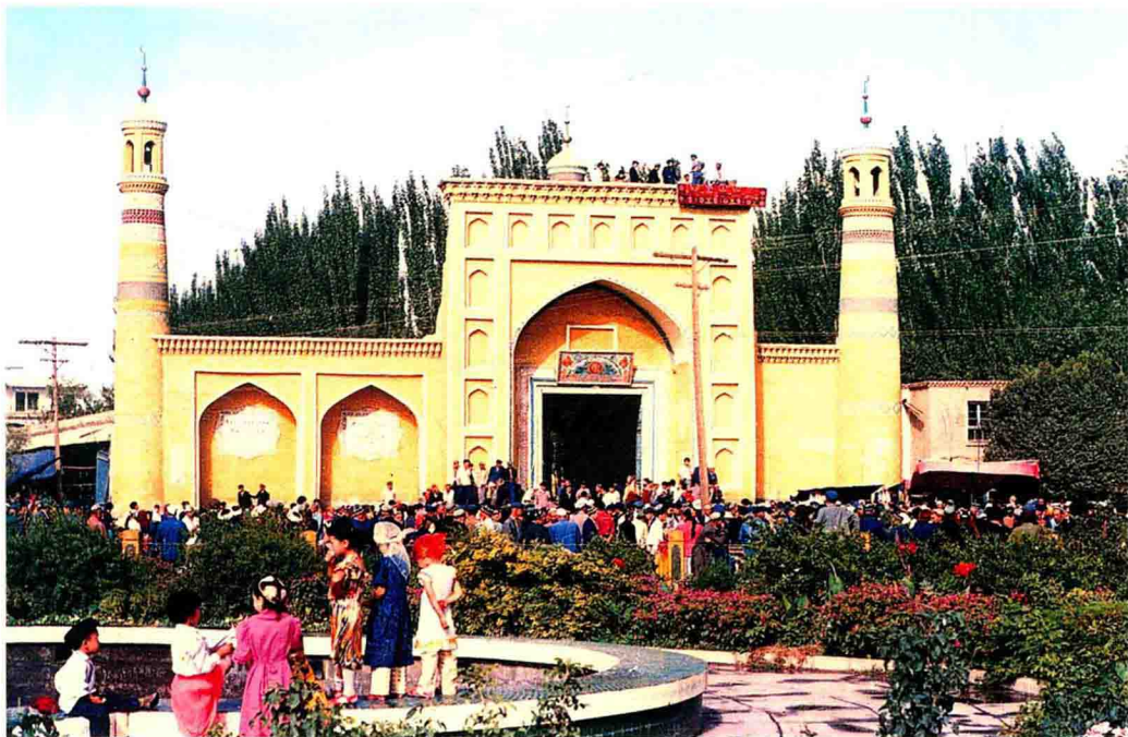
图1-2 喀什艾提尕清真寺 始建于15世纪，是目前已知的新疆最早 和最大的清真寺之一，驰名中外