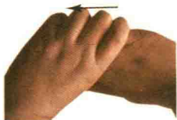
图 1-8 拔法

【适用范围】适用于手指关节、掌指关节及腕关节的局部病证，也可用于老年人的强身保健。多与捻法、揉法等配合应用。