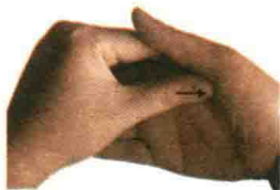
图 1-1 按法

操作时着力部位要紧贴手部表面，移动范围不可过大，用力由轻渐重，稳而持续，按压频率、力度要均匀。