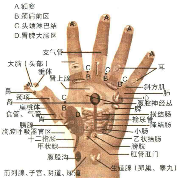
图 1-12 手反射区(左手掌)