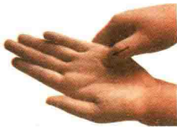
图 1-5 掐法

操作时要逐渐用力，至深透引起强反应时为止。掐至深度持续半分钟，松后再按揉半分钟局部，然后再行一次操作。注意操作时切忌滑动，以防掐破损伤皮肤。