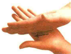
图 1-4 推法

【适用范围】适用于手部纵向长线实施。推法操作一段时间后转为擦法。推法多用于慢性病、劳损性疼痛、酸痛以及保健等。