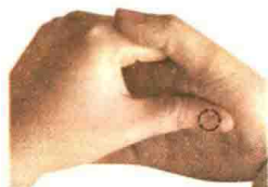
图 1-10 摩法

摩法围绕环可以自中心向周围逐渐放大，然后再回收，使中心及四周有温热感为佳。要求动作均匀协调，频率要快。