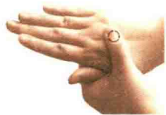
图 1-3 揉法

【适用范围】适于在表浅或开阔的穴区上操作。慢性病、虚证、劳损及保健等常选用揉法，局部肿痛也可使用。