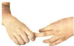
图 1-6 捻法

【适用范围】主要用于手部手指各小关节。常与掐法、推法合作运用，用于慢性病证、局部不适及保健等。