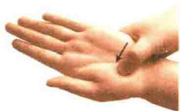
图 1-2 点法

点法较按法接触面积小，要求力度强，刺激量大。操作时要求点压准确有力，不可滑动，力量调节幅度大。