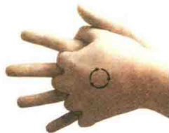
图 1-7 摇转法

【概念】是使手部指关节、手腕部关节做被动均匀的摇转环形动作的方法。可起到放松调整、滑利关节等作用（图1-7）。