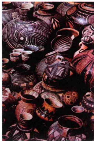
图 1-1 马家窑彩陶 (新石器)

迄今考证,从南方的闽、粤、浙、苏,到中原的豫、鄂、湘、川,以及北方的陕、甘、青、鲁,边疆地区的蒙、新、藏等处,在距今 4000~10000 年前,均有新石器时期的文化遗迹。其中,江南地区约