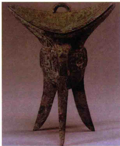
图 2-1 青铜爵 （夏，河南偃师二里头遗址）

春秋后期，社会向封建制度过渡，青铜器不再为奴隶主所垄断，转为以日用品为主，器形由大变小，纹饰也更加写实。