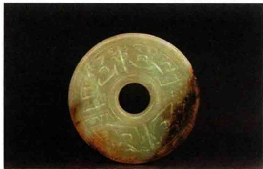
图 2-6 玉璧 (夏，河南偃师二里头)

到了周代，文献已记载产生丝织品的地区和丝织品种，出现了锦、绣、罗、绮等文字。染色方面，也使用了植物染料，染出了很多间色和复色。