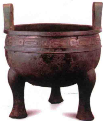
图2-4 毛公鼎 (西周晚期，陕西岐山)

立鹤方壶是春秋时代的作品，河南新郑出土。这件艺术品特别突出的是顶盖上那只展翅欲飞的仙鹤，栩栩如生，它体态生动，造型巧妙，工艺精美（图2-5）。