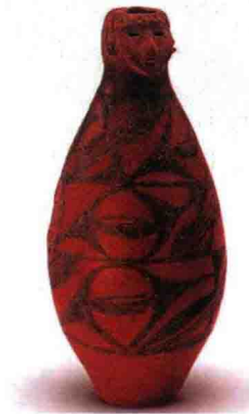
图 1-5 仰韶文化人头形 器口彩陶瓶