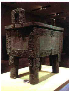
图2-2 后母戊方鼎 (商晚期，河南安阳)

四羊方尊是商代酒器，湖南宁乡出土。此器造型奇特，工艺高超，形式感很强，特别是羊头的造型概括真实，图案变形抽象而准确（图2-3）。