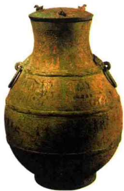
图 3-1 战国宴乐铜壶 (战国，四川成都)

而儒、道两家不仅在当时影响很大，而且延续发展，与后来传入的佛禅思想结合，成了中华民族传统审美观的基础，直接影响后人的哲学、伦理、法制与文化思想，也严重影响到我国美术独特风格的形成（参考本书附录二 中国古代美术的审美思想基础）。