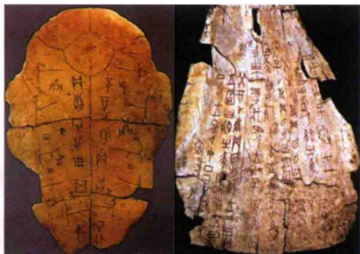
图 2-7 甲骨文 (殷商，河南安阳)