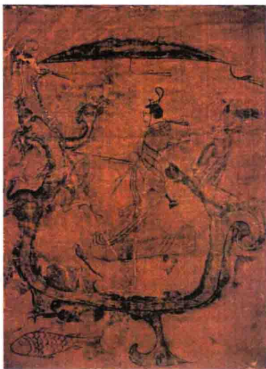
图 3-3 《驭龙升天图》 (战国, 湖南长沙)