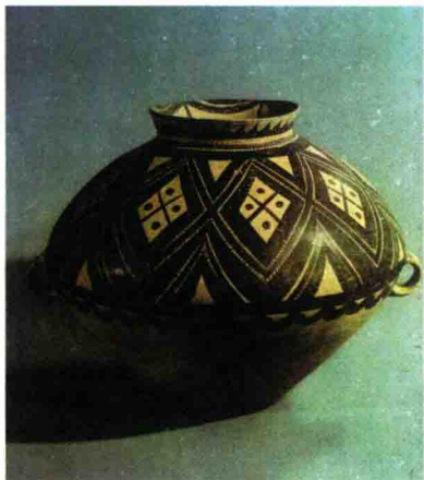
图 1-2 马家窑文化彩陶罐 (图案：玫瑰花)

如马家窑彩陶的旋涡、沿海地区陶器的水波纹、以渔猎生活为主的半坡陶盆上的鱼纹、以农耕为主的庙底沟陶器的植物纹，以及日落月出、风云变幻所引起的点线联想等（图 1-2 和图 1-3）。