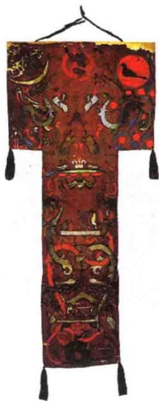
图 3-4 《T字形帛画》 (西汉, 湖南长沙)

此画分天上、人间、地下三部分。分别画有九日（一日有金乌）、扶桑、伏羲、女娲、仙鹤、门下小吏及女墓主奔月；女主人出门飞升，仆婢跪送及祭奠，等候在外的飞龙、羽人；力士、大地、海面等图像。构图对称，富装饰效果，三部分虽分属幻想与写实，但很和谐。