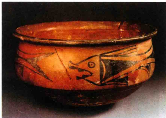
图 1-3 西安半坡遗址的鱼纹彩陶盆