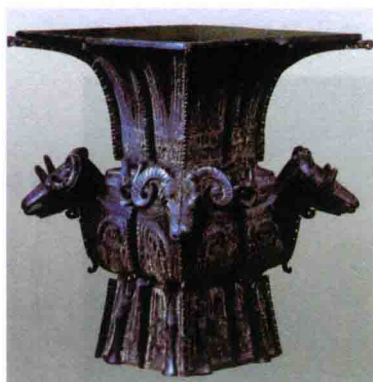
图2-3 四羊方尊 (商晚期，湖南宁乡)