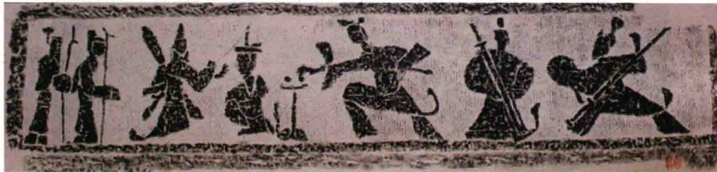
图 3-5 《二桃杀三士》 (西汉, 河南洛阳)

汉代壁画中，最主要的是墓室壁画，其最早者为 1976 年在洛阳出土的西汉中期作品。而最著名者为 1957 年发现于洛阳的西汉晚期作品《二桃杀三士》（图 3-5）。