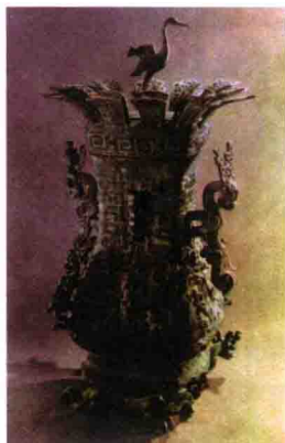
图2-5 立鹤方壶 (春秋，河南新郑)