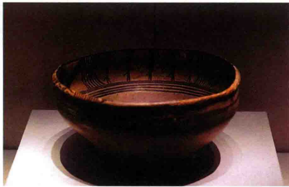
图 1-4 舞蹈纹彩陶盆 (新石器，青海大通)

我国原始时期的雕塑，也主要见于陶制品中，即独立的陶器或陶器部件。其内容主要反映农业社会的生活（家禽、家畜等）或人物形象（图 1-5）。基本制作方法是手捏，同于后来的民间泥塑。