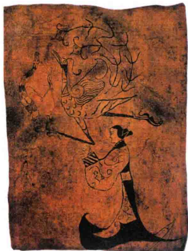
图 3-2 《龙凤人物图》 (战国, 湖南长沙)