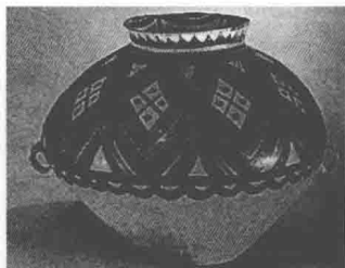
图5 半山类型彩陶瓮

半山类型彩陶器型，最有特点的是长颈（或短颈、或无颈而有折沿）小口宽肩大腹双耳罐。造型比例均衡和外廓线的转折变化都非常考究。形象丰富浑厚，稳重大方，是我国早期陶器工艺史上最成功的造型之一（图5）。