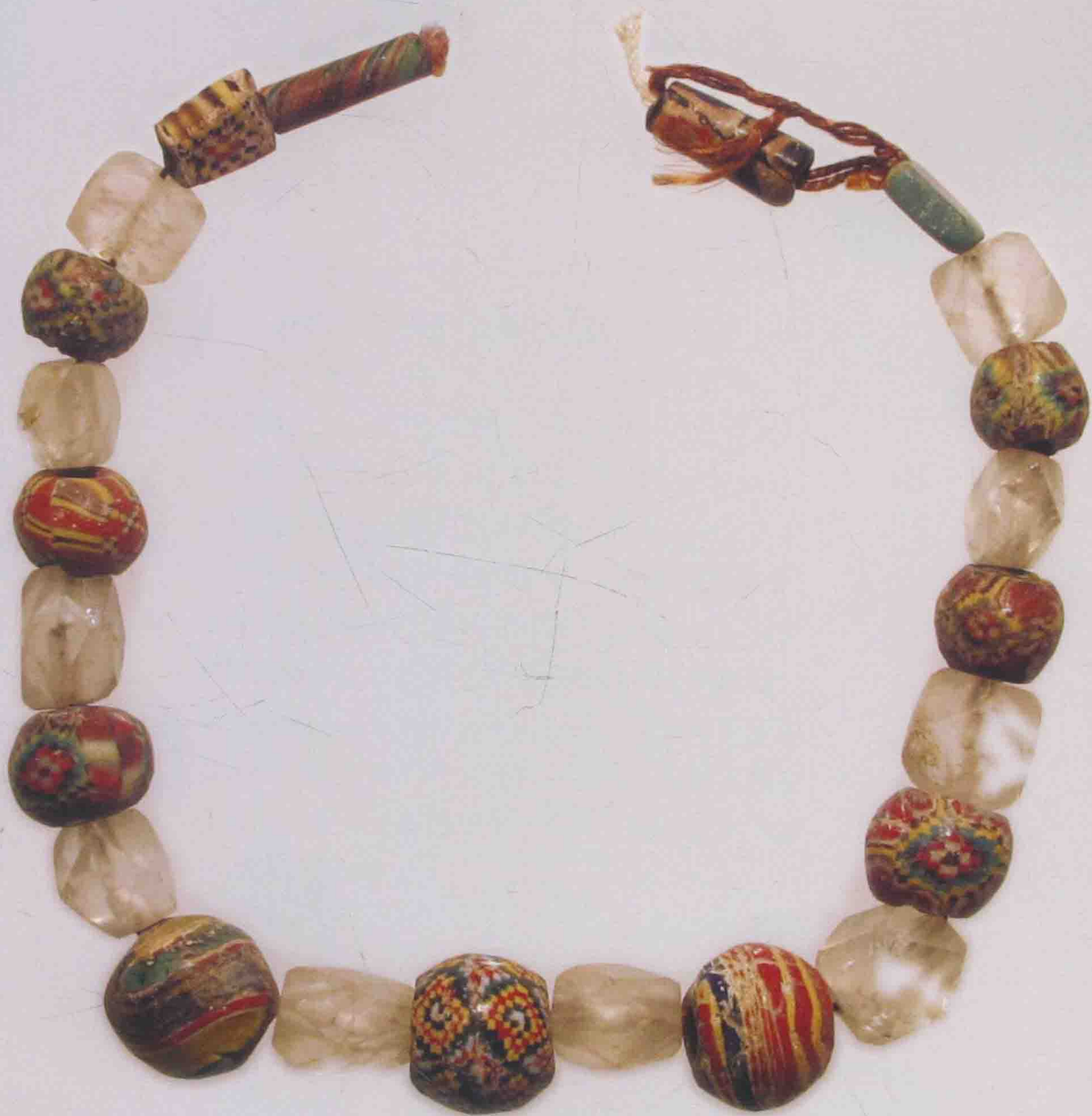
手链 古罗马 琉璃、水晶珠 长 10.8cm