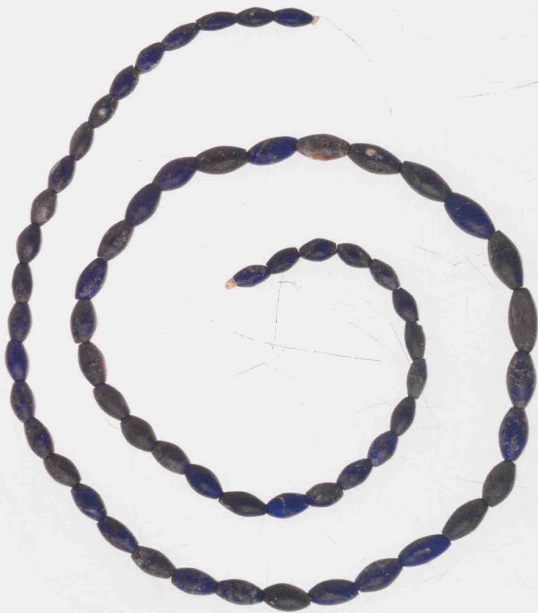
串珠 埃及中王国时期 绿色釉陶器 长 26cm