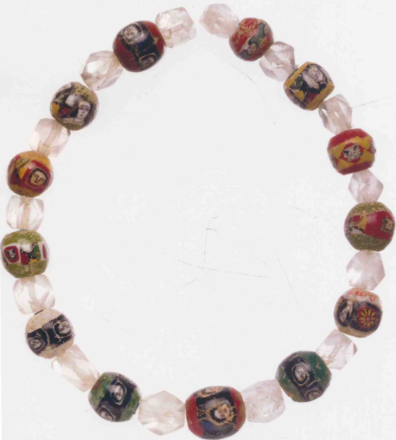
珠串 罗马早期帝国时代 玻璃、水晶 31.1cm