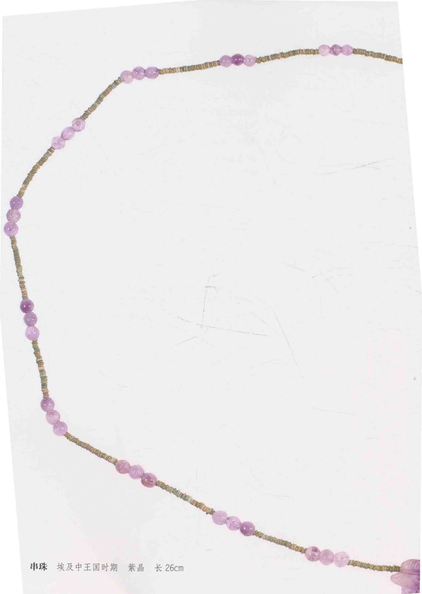
串珠 埃及中王国时期 紫晶 长 26cm