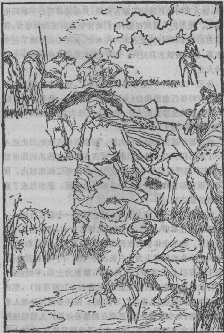
铁木真以猎物为食，浑水止渴，过着艰苦的生活。