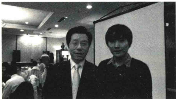
儿子在耶鲁校友会上与李开复先生合影

书。如果开复按部就班地在台湾接受传统教育，应该无法做到让“世界因他而不同”。就连一直告诉儿子“分数是世界上最不重要的事情”的郑渊洁其实也是重视家庭教育的典范，因为他给孩子设计了更适合他们父子的教育方法。在那个年代，有胆识让孩子只读完小学就回家接受家庭教育的恐怕为数不多，让