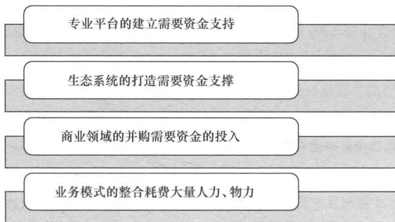
图 1-3 “大健康”布局的资金驱动作用