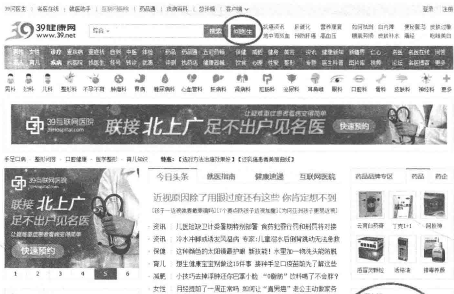
图 1-1 39 健康网

在线咨询可以算是我国互联网健康产业发展的起点，其中39健康网，如图1-1所示，为典型代表，其以提供医疗信息为主要服务内容，以有偿广告等为主要盈利模式。后来，在挂号网、好大夫在线等一批后来者的推动下，预约门诊、有偿咨询等新型的互联网医疗商业模式应运而生。