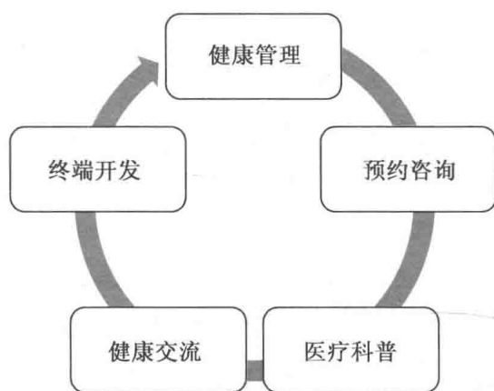
图 1-2 互联网+大健康涉及五大领域