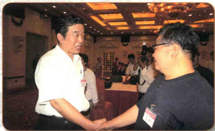
■ 与全国政协常委、文物出版社社长、中国书协主席苏士澍先生交流