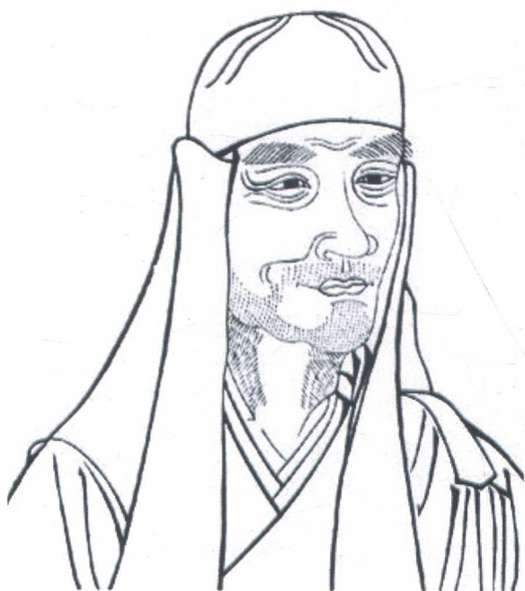
附图一：鸠摩罗什法师像