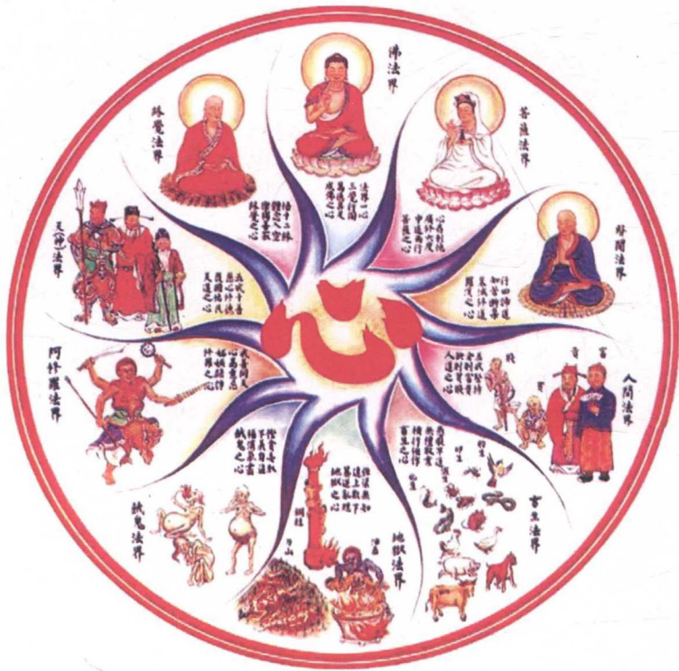
附图三：十法界示意图