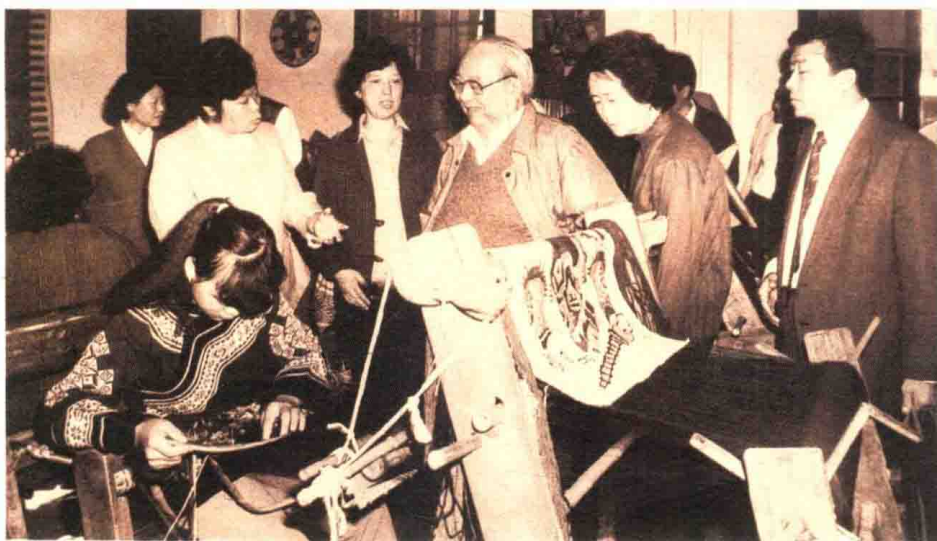
1997年10月，费孝通考察湖南省吉首少数民族的民间织锦手工艺品生产