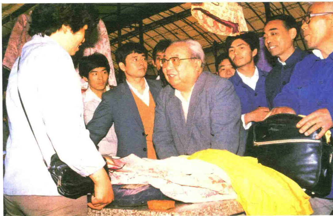
费孝通在做市场考察