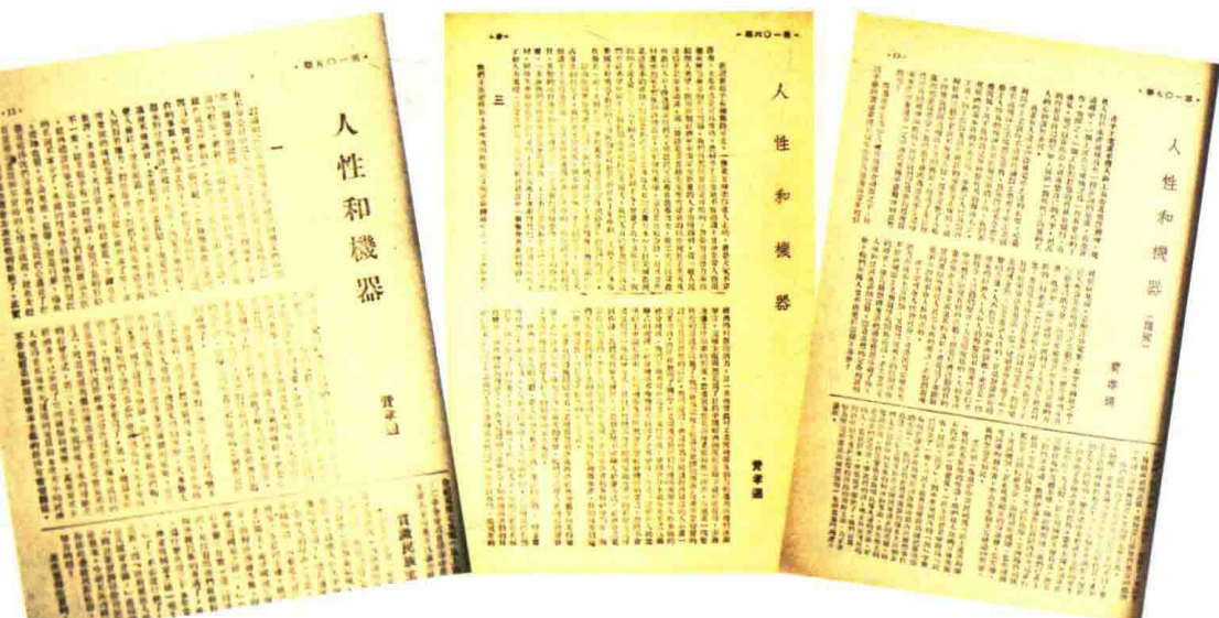
1946年三四月，费孝通的《人性和机器》一文在《再生周刊》第105、106、107期上连载