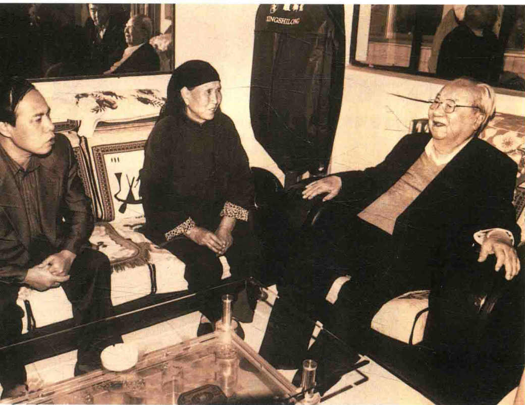
2003年8月，费孝通七访定西，在岷口村农家话变化