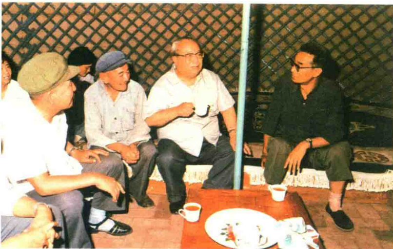
1984年8月，费孝通在内蒙古草原蒙古包访问牧民