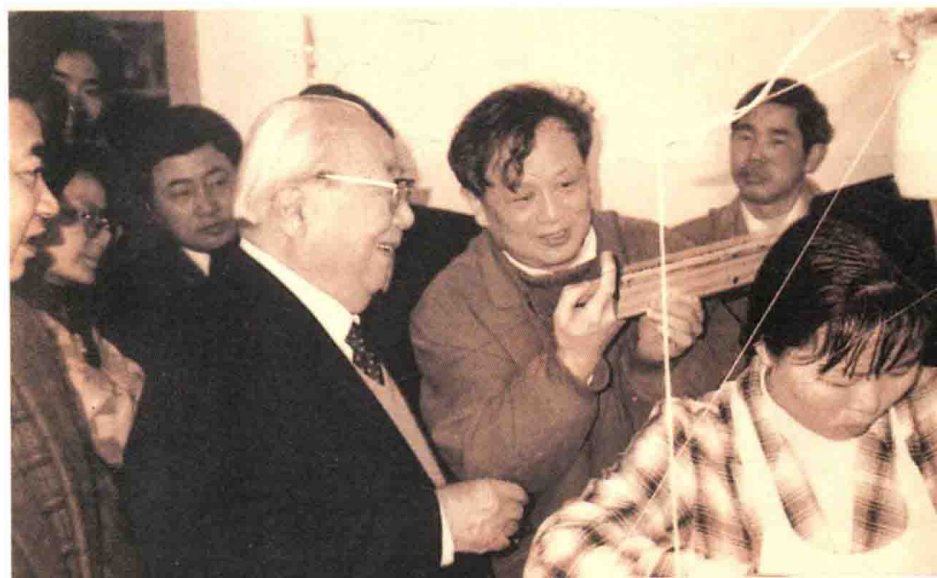
1996年，费孝通第十九次访开弦弓村，考察农家丝织厂