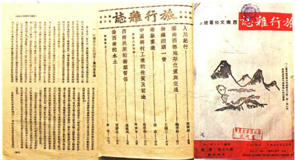
1943年2月，费孝通在《旅行杂志》上发表《中国乡村工业的性质及前途》