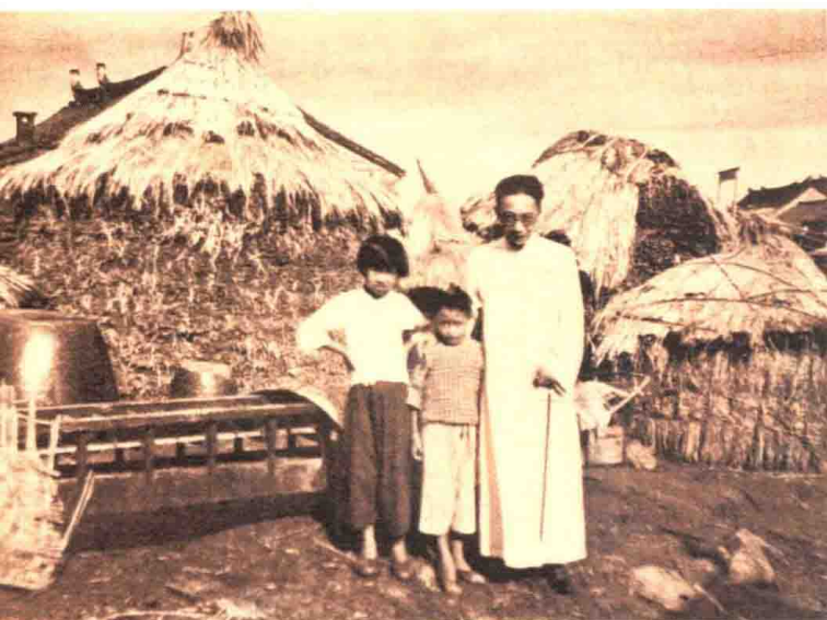
1936年初夏，费孝通和开弦弓村的两个孩子合影。居中的男孩与下图居中的青年是同一人，现年88岁