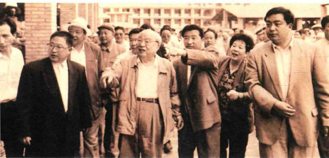
1995年9月，费孝通在临夏回族自治州三甲集羊毛批发市场考察