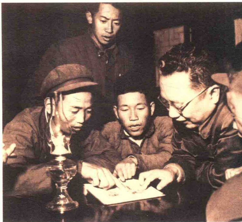
1957年，费孝通重访开弦弓村