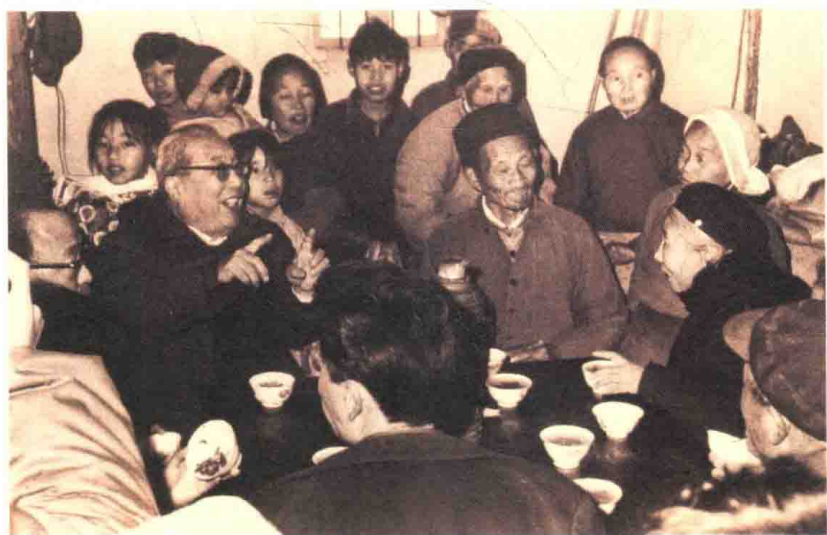
1982年1月，费孝通四访开弦弓村，和姐姐费达生（右戴帽者）与乡亲畅谈