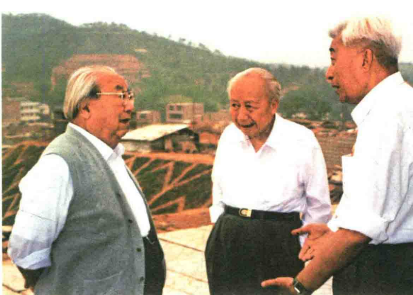
1997年，费孝通与钱伟长(中)、丁石孙(右)在京九铁路考察途中