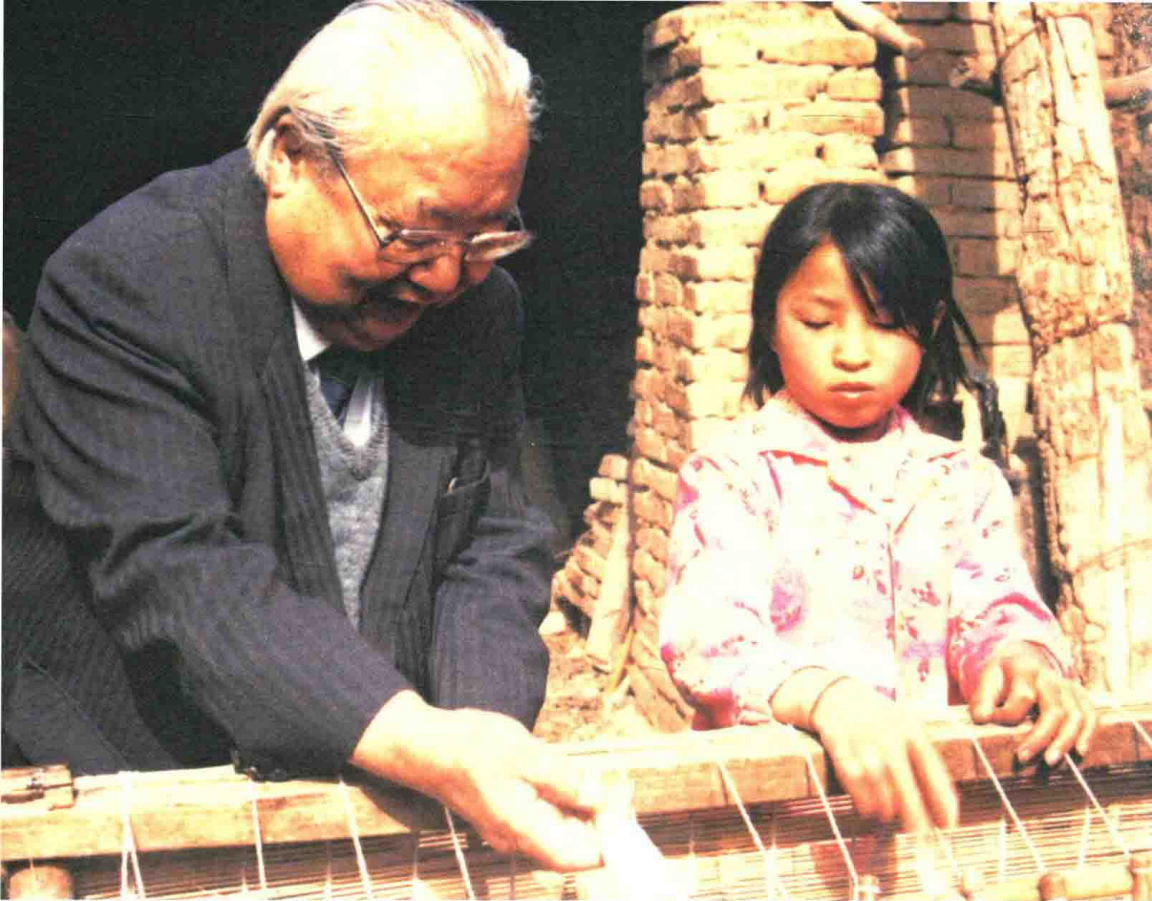
费孝通深入农户了解手工编织竹帘生产情况，并在现场学习操作