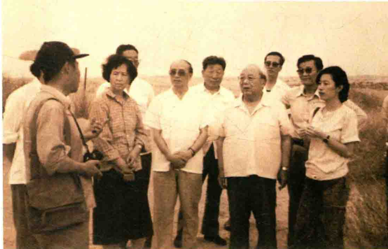
1988年，费孝通在 内蒙古作田野调查