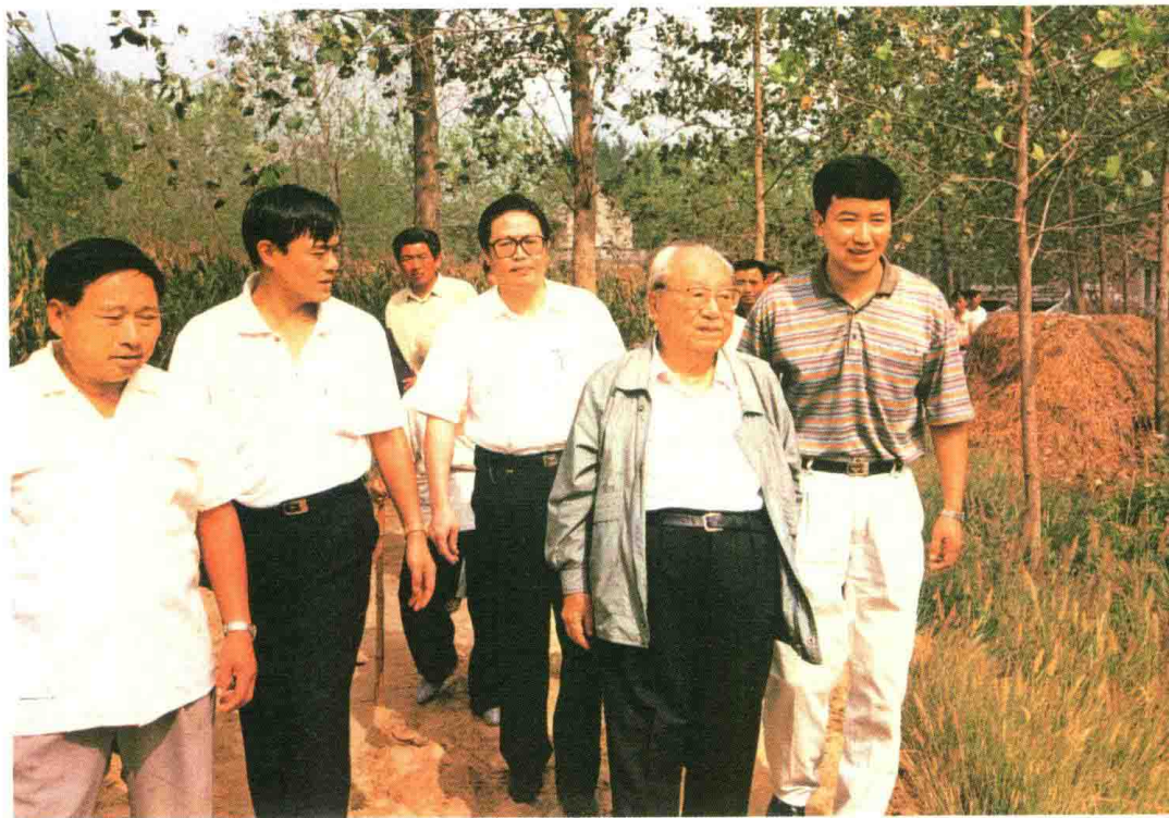
费孝通在农村考察