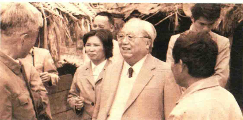
1985年，费孝通在海南岛三亚市黎族同胞聚居的村落访问农户