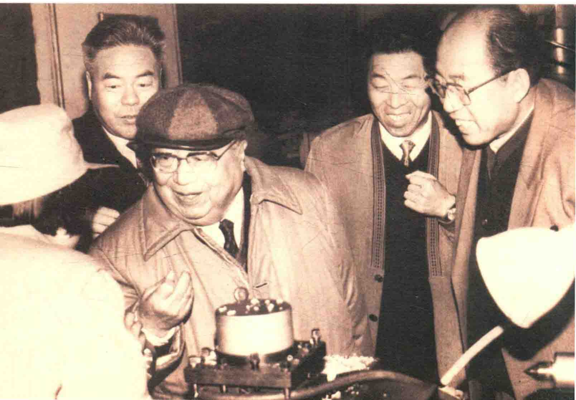
费孝通在山东某工厂考察