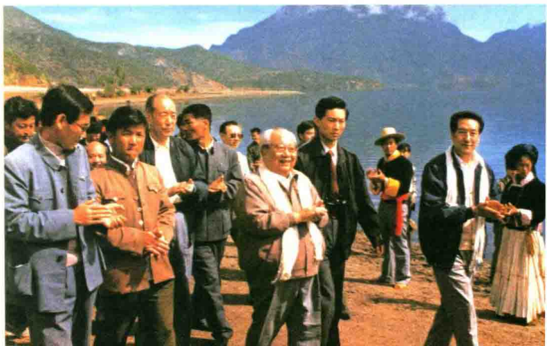
1991年6月，费孝 通访问四川省凉山 少数民族地区