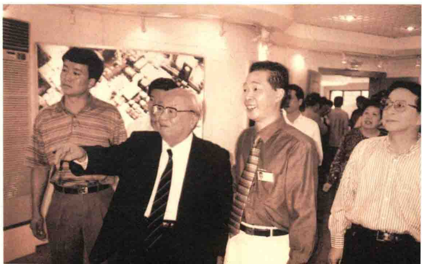
1998年，费孝通考察温州德力西集团