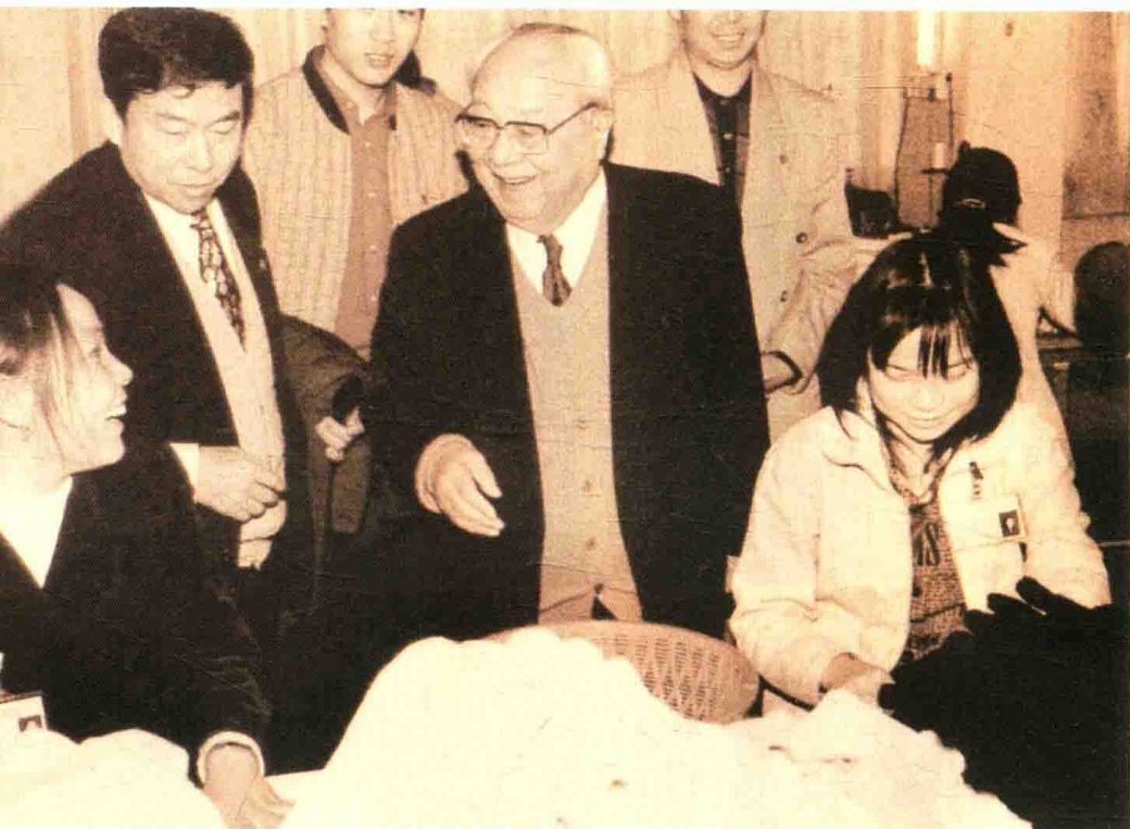
1999年12月，费孝通在惠州市考察乡镇工业