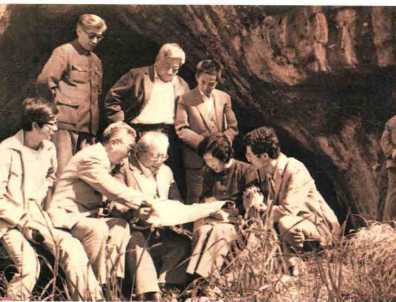
1987年，费孝通和助手在内蒙古呼伦贝尔盟的嘎仙洞察看行程和路线