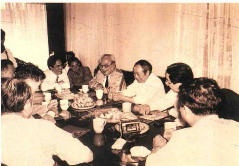
1995年11月5日，费孝通在吴江盛泽镇听吴江工艺织造厂厂长介绍企业发展情况