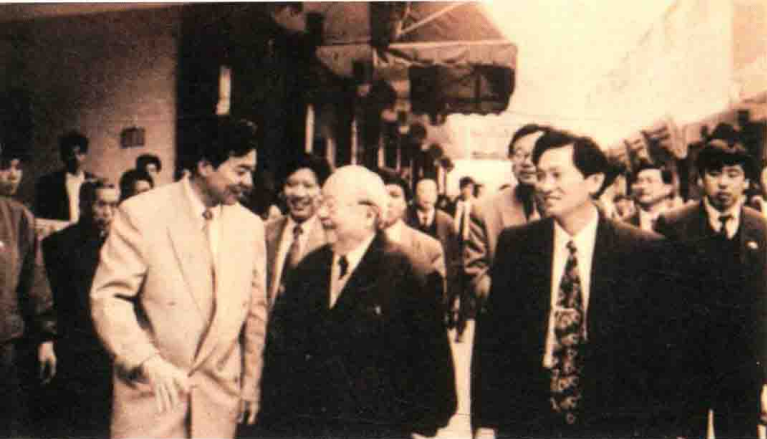
1994年，费孝通在温州苍南县灵溪镇考察专业市场