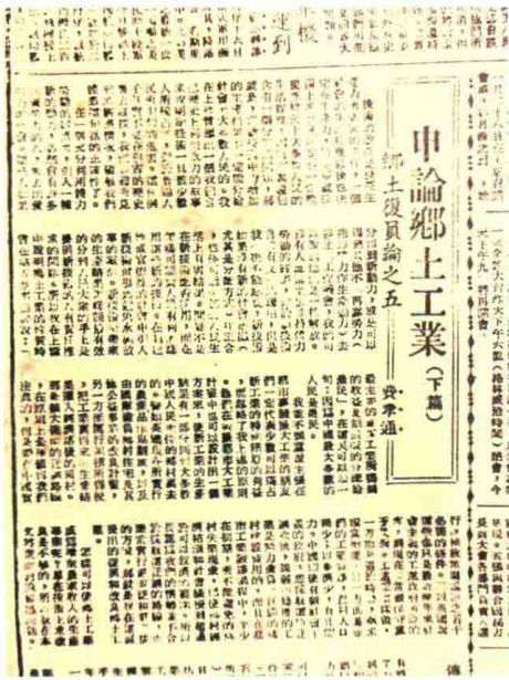
费孝通的《申论乡土工业》一文分上、中、下篇，1948年3月14日和4月15日、18日在《大公报》上发表，本篇为下篇