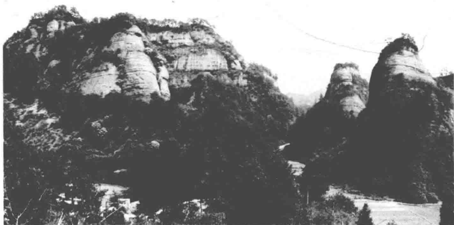
通道万佛山“丹霞”岩溶地貌

约占全县总面积的 80%，丘陵约占 15.39%，岗地约占 1.91%，平地约占 3.08%，水源占地约 1.95%。县内的地形以八斗坡为分界点，北部地势由东、南、西向中、西北倾斜，多山地、丘陵和谷地，呈明显带状分布；南部地势由北向南急剧下降，山高谷深、起伏较大，形成独特的山地景观。县内有大山八斗坡、大高山、将军坡、黄沙岗、七星山、黄竹山、玉柱山、三省坡、青龙界、天堂界等，还有形态特殊的万佛山“丹霞”岩溶地貌。