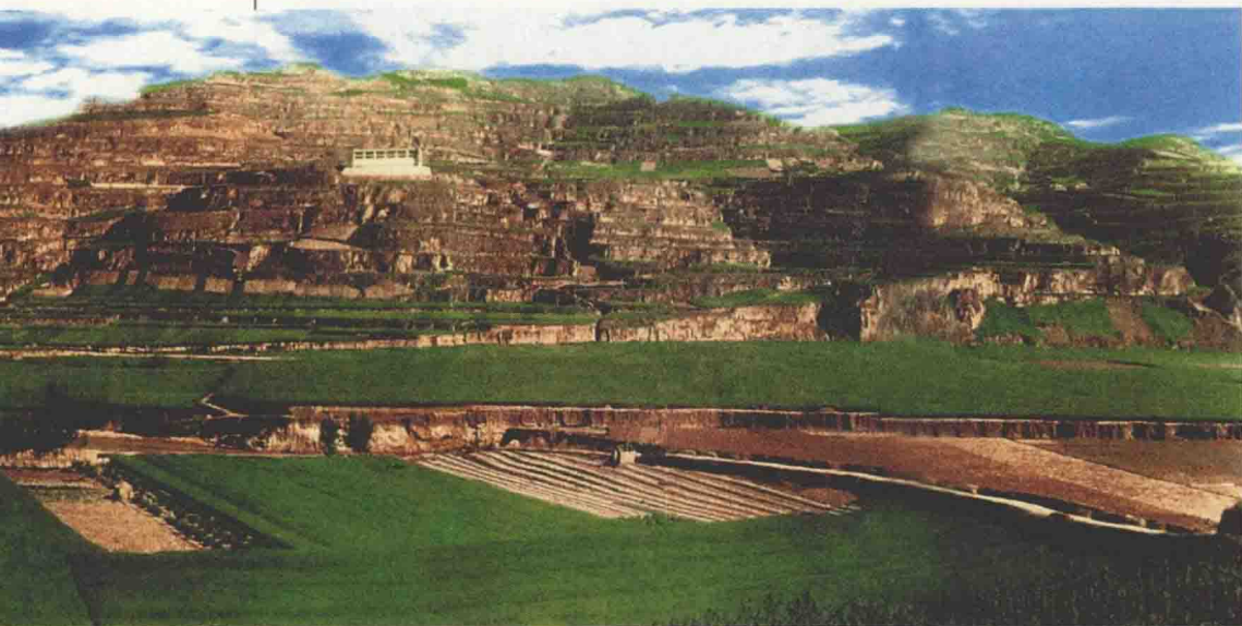
● 天水市秦安大地湾

夏商周断代工程所确立的中国 5000 年的文明史，遭到西方和国内一些学者的一再诟病和反对，他们所以说不！依据的就是克拉克洪和丹尼尔所建立的文明起源标准！中华文明起源在 5000 年的基础上还有向上拓展的空间，很多人对 8000 年文明充满着期望。