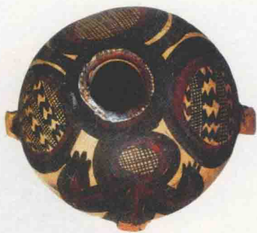
● 神人纹鸟形彩陶壶