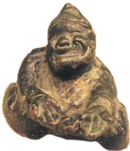
图 0-3 “胡相”俳优俑铜镇·西汉