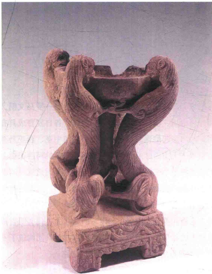
图 0-1 四狮环立石灯·北魏

在古埃及、美索不达米亚平原，狮子是力量和权利的象征，也担任神殿的守护神。狮子是经丝绸之路较早进入中国的新奇物种。东汉章帝章和元年（87），安息国王遣使进贡狮子。北魏太平真君十一年（450）十月，“颍盾国贡狮子”。作为实用器上的写实的狮子像，这件四狮环立石灯石雕，手法细腻而生动，4只狮子守护着“光明”，既有象征意义，又是美化装饰，是中西文化完美结合的产物。狮子之所以能深入中国传统文化，应归功于古代东西方经济文化交流。