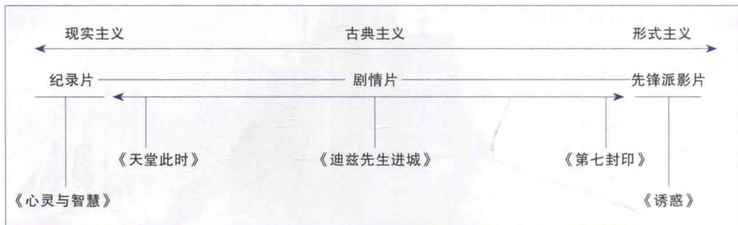
1-2 电影风格和类型的分类表

影评人与学者根据多种准则将电影分类，但这些准则并非都很明确。电影的风格和类型是两种最常用的分类法。三种风格——现实主义（realism）、古典主义（classicism）和形式主义（formalism）——之间的关系可以被视为一个延续性的光谱，而不是三个截然的范畴。相同的，三种电影基本类型——纪录片（documentary）、剧情片（fiction）和先锋派影片（avant-garde）也只是为了区别的方便，因为在电影中它们经常彼此重叠。现实主义风格的电影《天堂此时》（ Paradise Now ，见图 1-4）有纪录片的风格；而形式主义风格的电影像《第七封印》（ The Seventh Seal ，见图 1-6），导演伯格曼则呈现了先锋派影片特质的个人风格。大部分的剧情片，特别是在美国制作的，通常都遵循古典模式（classical paradigm）。古典主义风格的电影可被视为是回避极端形式或现实主义的中間风格，但大部分古典主义电影的形式都会倾向某种风格。