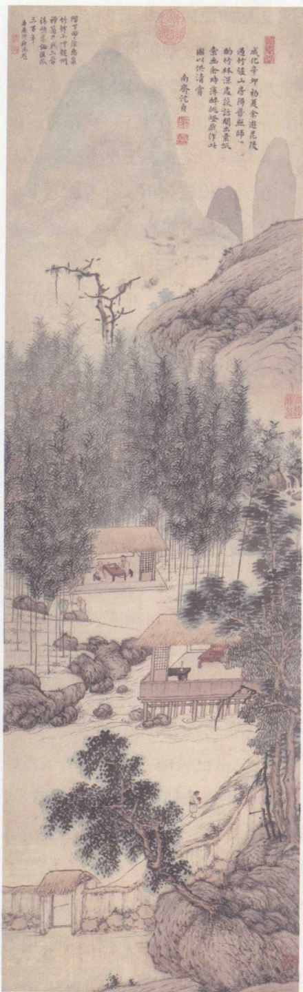
■〔明〕沈贞 竹炉山房图

这幅《竹炉山房图》曾为清代内府藏品，画轴左上方有乾隆皇帝题画诗一首，现藏于辽宁博物馆。作者沈贞，生于建文二年（1400），是明代画坛巨匠沈周的伯父。