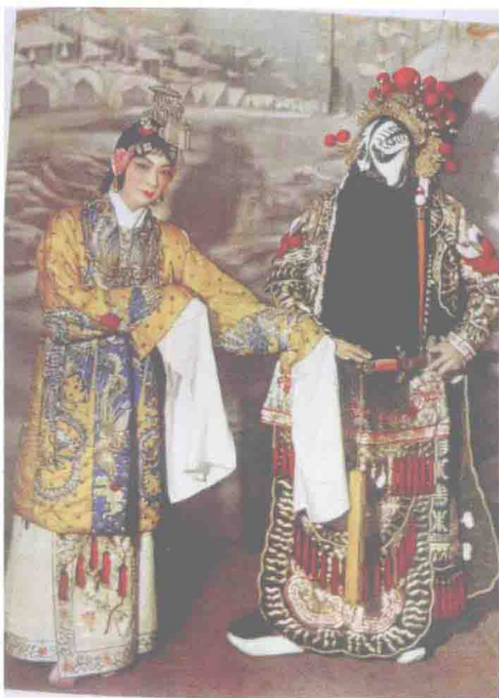
梅兰芳、杨小楼演出《霸王别姬》