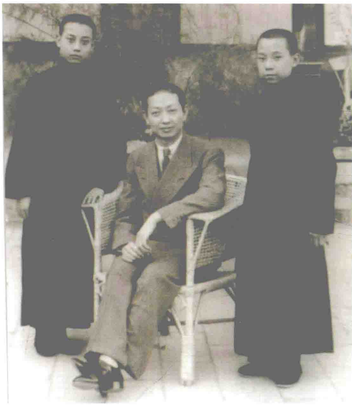
1930年，梅兰芳收李世芳、毛世来为徒