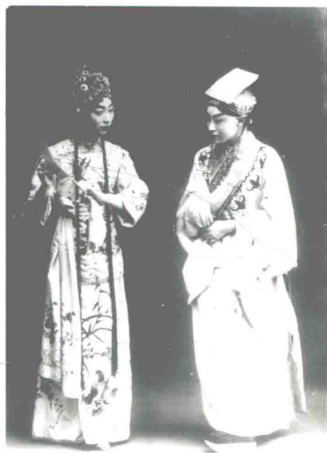
梅兰芳、尚小云演出《西厢记·寄柬》，1929年