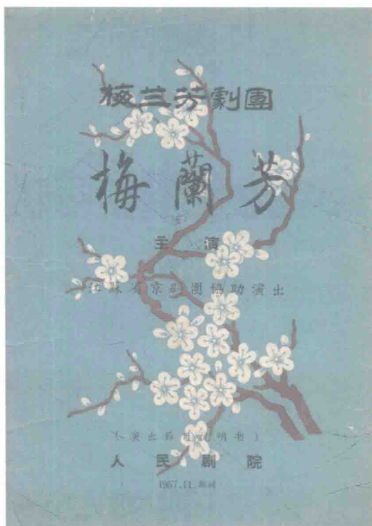
1957年梅兰芳在郑州人民剧院演出戏单