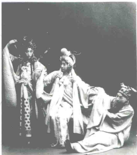
梅兰芳、尚小云、程砚秋演出《断桥》，1929年