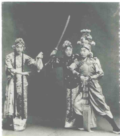
梅兰芳、尚小云、程砚秋演出《虹霓关》， 1929年