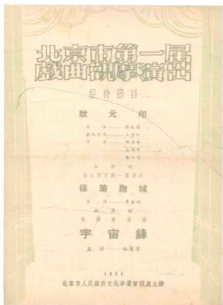
1954年北京市第一屆戲曲觀摩演出戏单