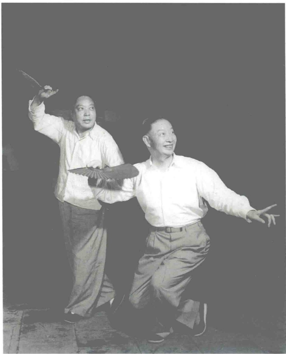
梅兰芳、韩世昌排演《游园惊梦》便装照