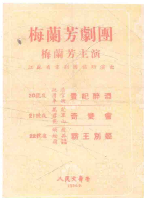
1956年上海人民大舞台戏单