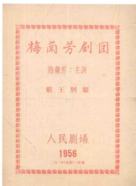
1956年北京人民剧场戏单