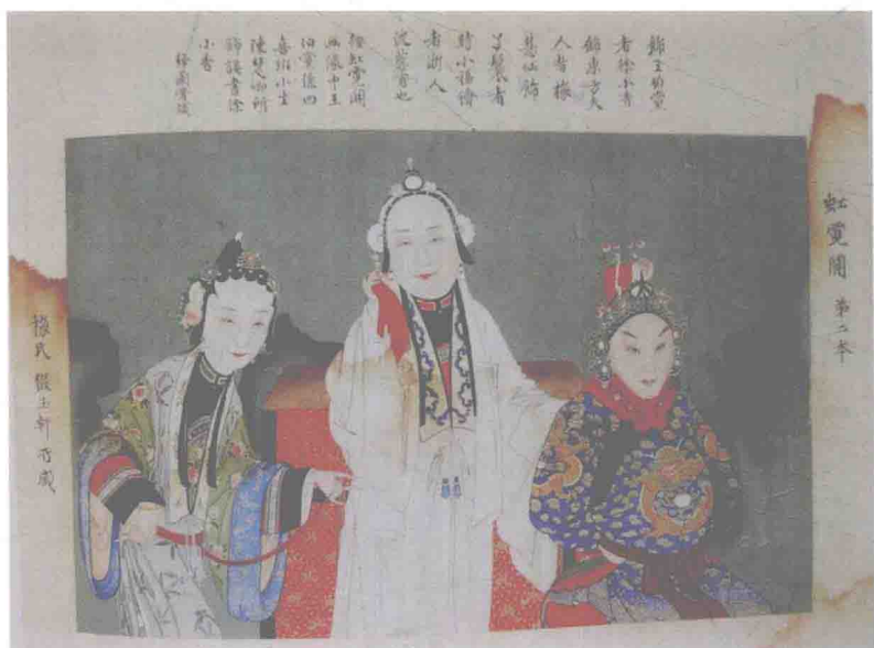
梅兰芳缀玉轩藏《虹霓关》画像