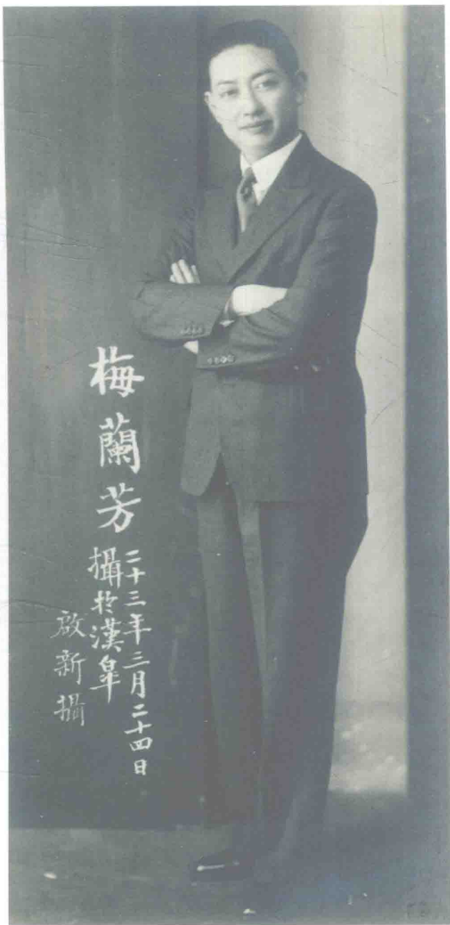
梅兰芳像，1934年3月24日在汉皋