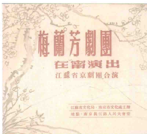
1956年梅剧团在南京人民大会堂公演戏单