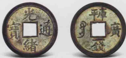
I-1-01 廣東錢局開制時所造方孔一文制錢

圓10萬枚、銅錢270萬枚的規模在當時各國造幣廠中堪稱之最。合同中也要求代聘英國技師隨同第一批機器到廠料理安裝等事宜。此外，模具由該廠代辦，其他還包括車床多架及“作鋼模之大螺旋機一座，用此