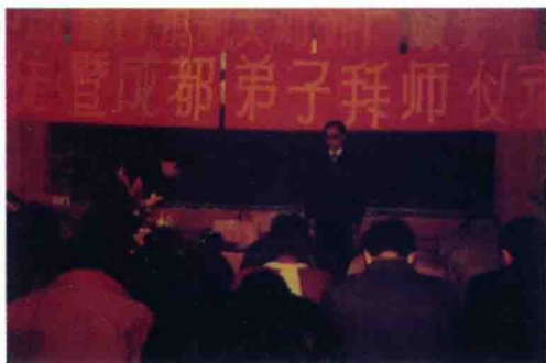
一九九三年 冬，作者在 成都接受弟 子们拜师作 者)