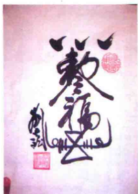
在发功状态下作者书写的具有趋吉避凶作用的“福”字