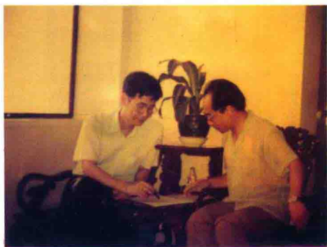
香港作者与香 版社皇冠出 祺先蔡敦研 究奇生门通 甲的应用