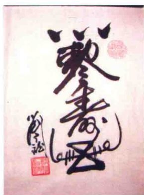
在发功状态下作者书写的具有趋吉避凶作用的“寿”字