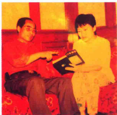
中国著名歌唱家 李娜询问学习 《奇门预测学》 中遇到的难题