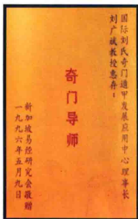
新加坡易经研究会授予“奇门导师”称号