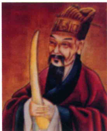
刘氏奇门宗师，明朝开国 军师刘伯温公绣像