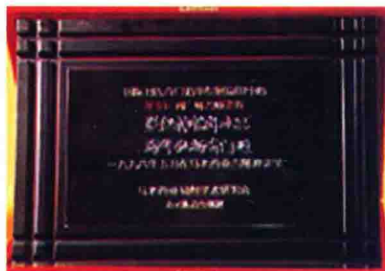
马来西亚易经学术研究会授予“星仪神格卦九宫，海外弘扬奇门遁”金牌