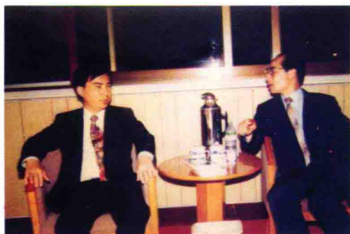
加坡研究沈先生 新易会长先奇的 与周会主讨论甲 代会探讨通代的 应用