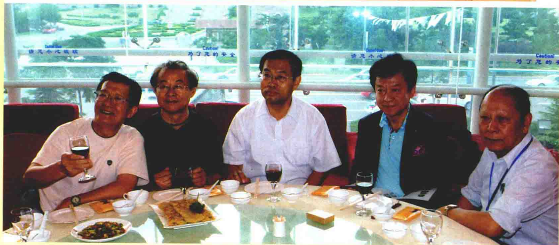
青岛市领导和评委们在一起。