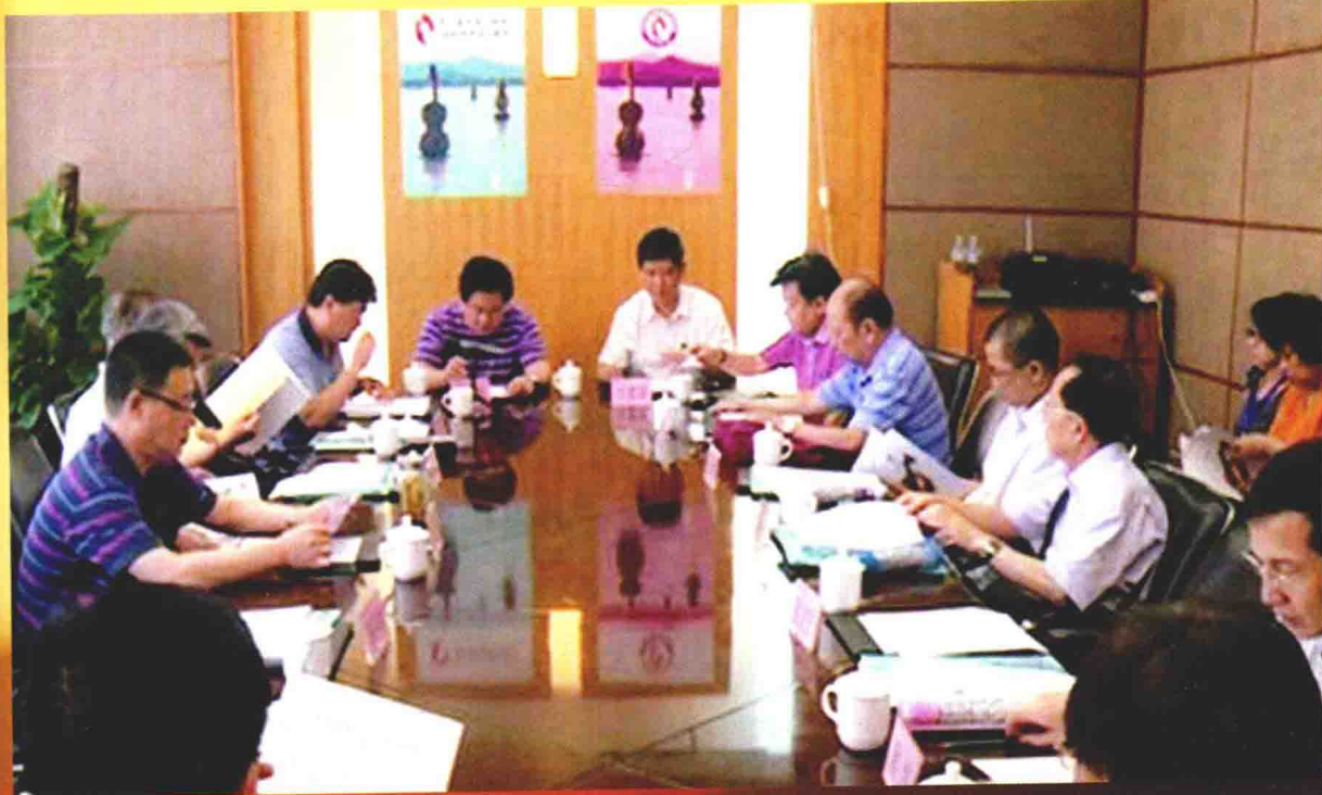
2011年第二届全国小提琴优秀选手展演评委会