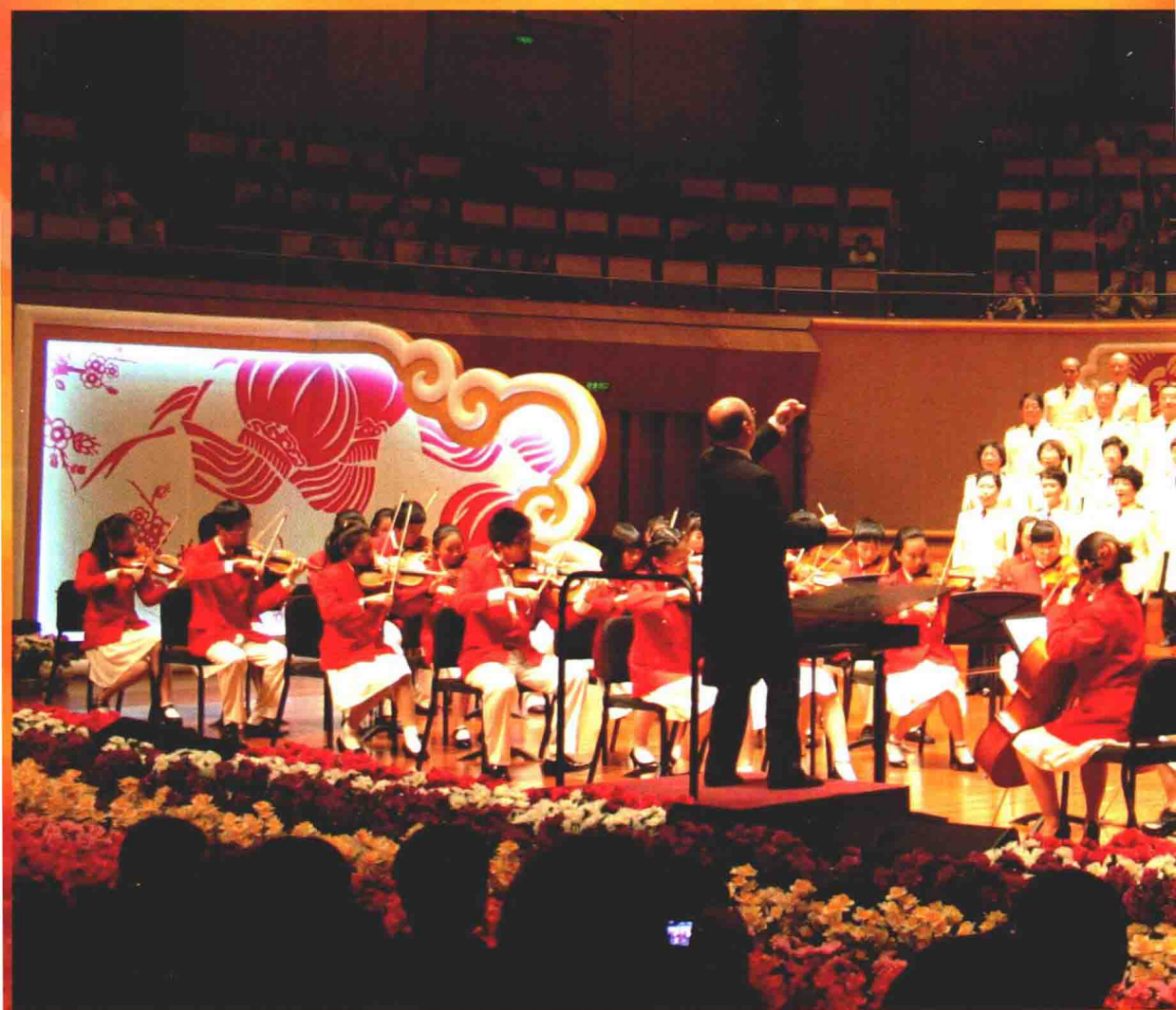
2013、2014 春节，北京太阳青少年乐团和海军老干部合唱团参加北京市民新春联欢会，演出于国家大剧院。