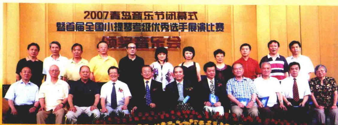
2007年8月首届全国小提琴考级优秀选手展演比赛全体评委，于青岛。