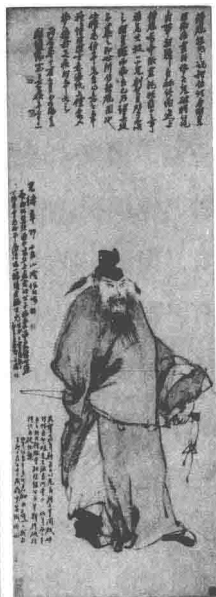
任伯年《朱钟馗》 (河北省博物馆藏)