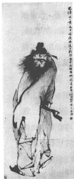
任伯年《朱钟馗》 (常熟博物馆藏)