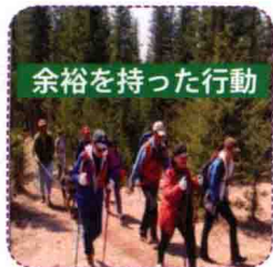
余裕を持った行動