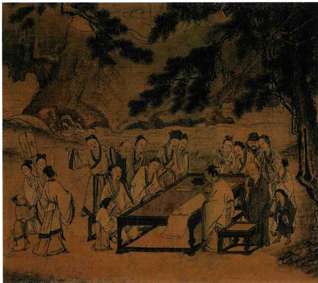
马远《西园雅集图》（局部）

此画描绘了北宋名人旧事。所有下班的官员都作文人着装，衣袍素雅，没有一个穿华服美袍，可见当时返朴归真的审美情趣蔚然成风。