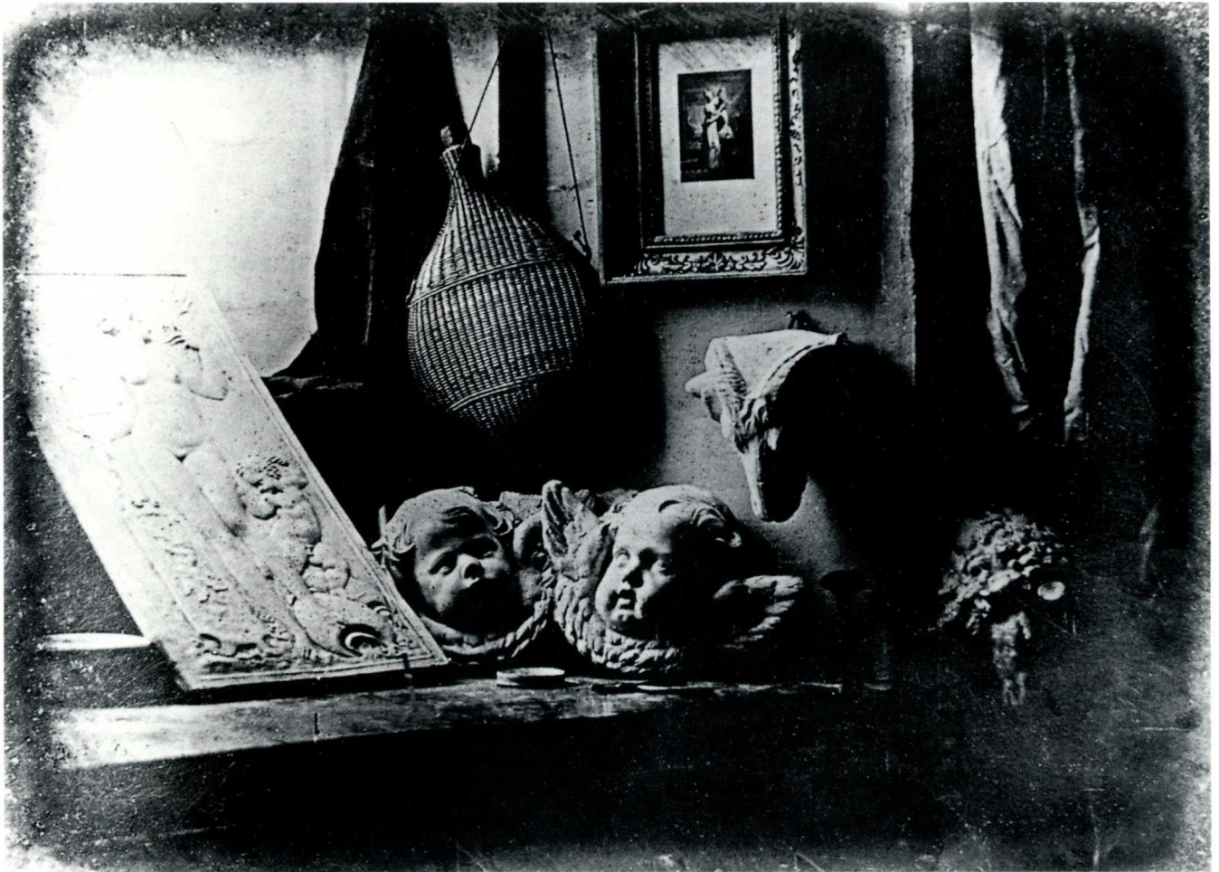
上图： 路易·达盖尔 《静物》(博古柜内景)，1837年 达盖尔银版照片