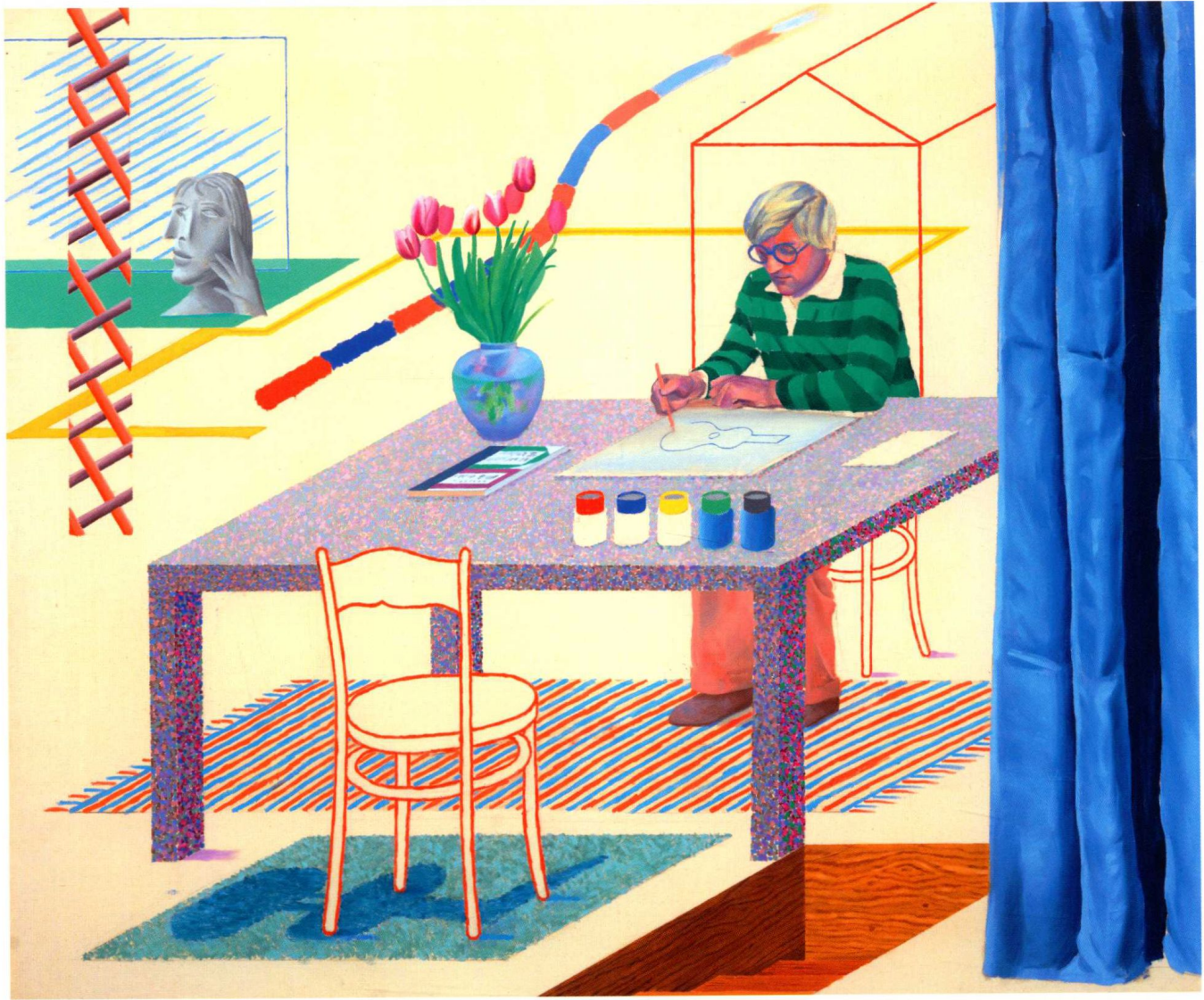
大卫·霍克尼 《蓝色吉他自画像》，1977年 布上油画