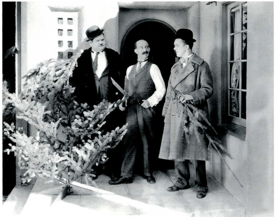
右图： 詹姆斯·W·霍恩 《大生意》，1929年， 斯坦·劳累尔和奥利弗·哈迪主演 电影剧照