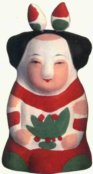
●耍货《小花因》(喻湘涟 塑彩)

传统的惠山泥人，大体分耍货（粗货）和手捏戏文（细货）两类。粗货是明清以来附近的农户、居民在农闲之余以黑泥捏塑成玩具、神像出售，以补贴家用，这也是惠山泥人初期的创作的场景，以后又有手捏戏曲人物出现，这种全凭艺人的艺术修养捏制的品种，称之为细货。“手捏戏文”的产生，就与戏曲的流传普及密不可分。